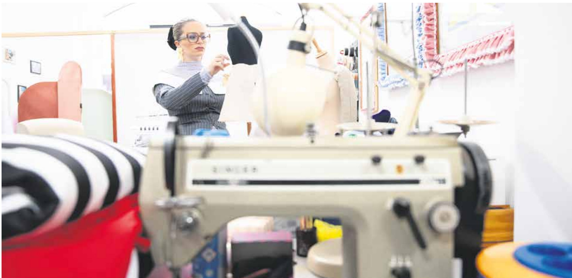
La diseñadora, en su taller.