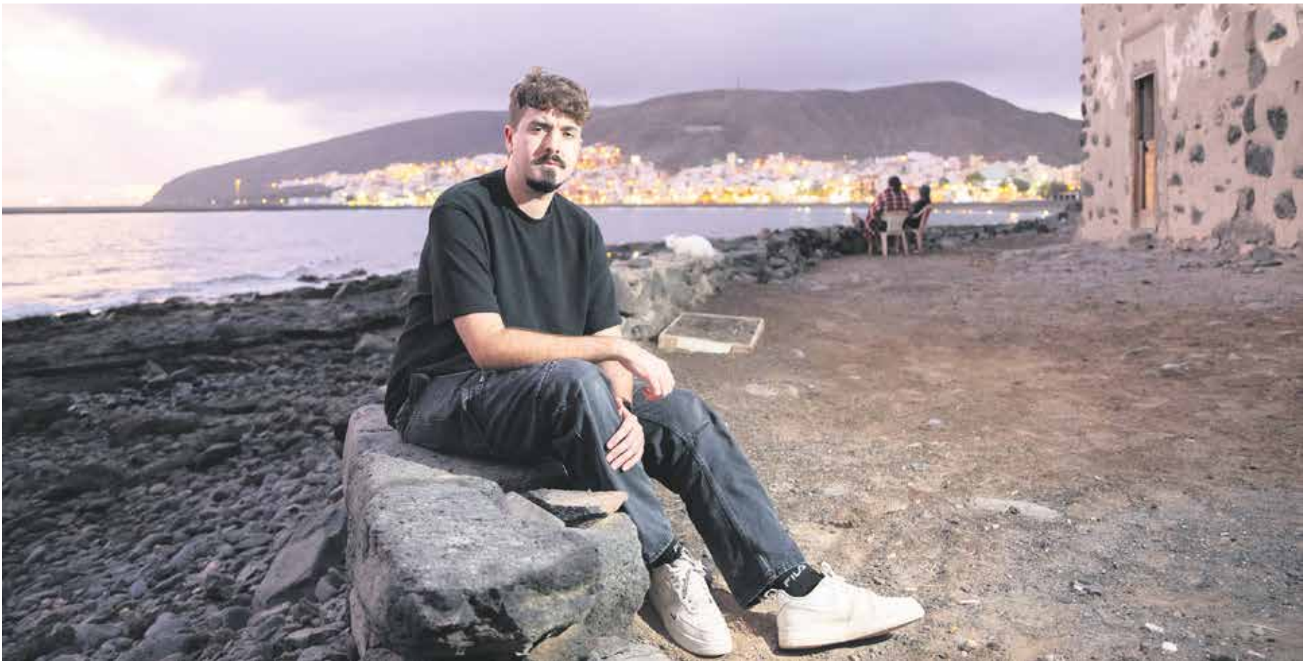
El joven cineasta, en Gran Tarajal.