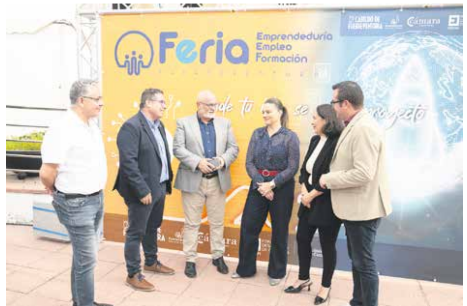
Participantes y autoridades en la Feria de Empleo.

de la formación para adaptarse a las exigencias del mercado laboral actual.