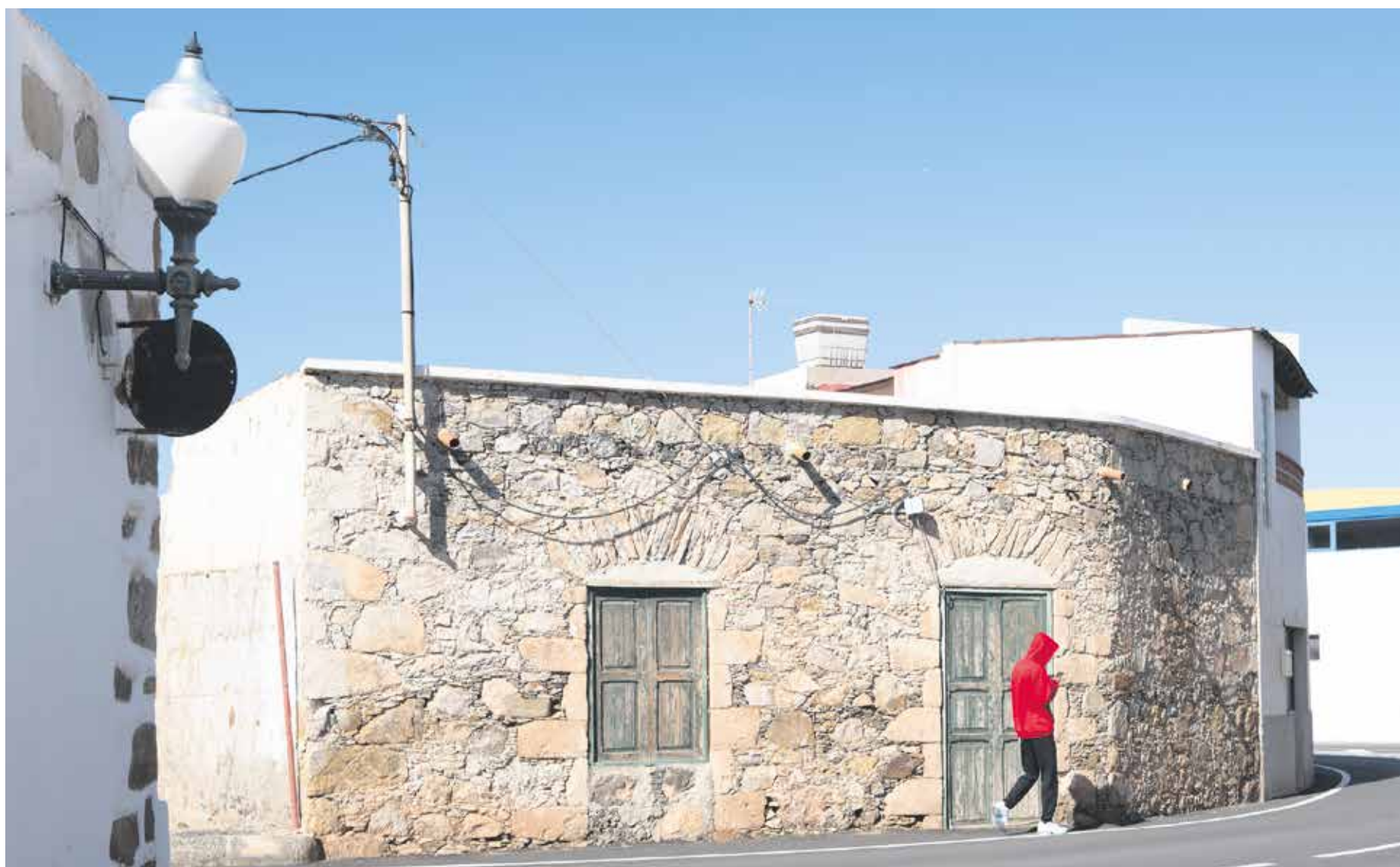
Un joven pasea delante de una casa histórica en Pájara.