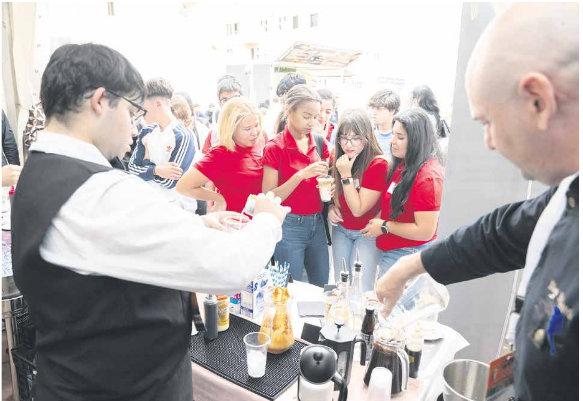
Un joven camarero atiende a los asistentes a la Feria de Empleo.