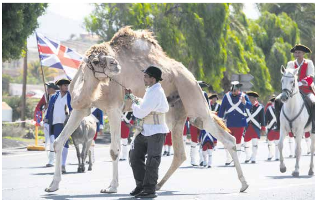
Recreación de las batallas de El Cuchillete y Tamasite.