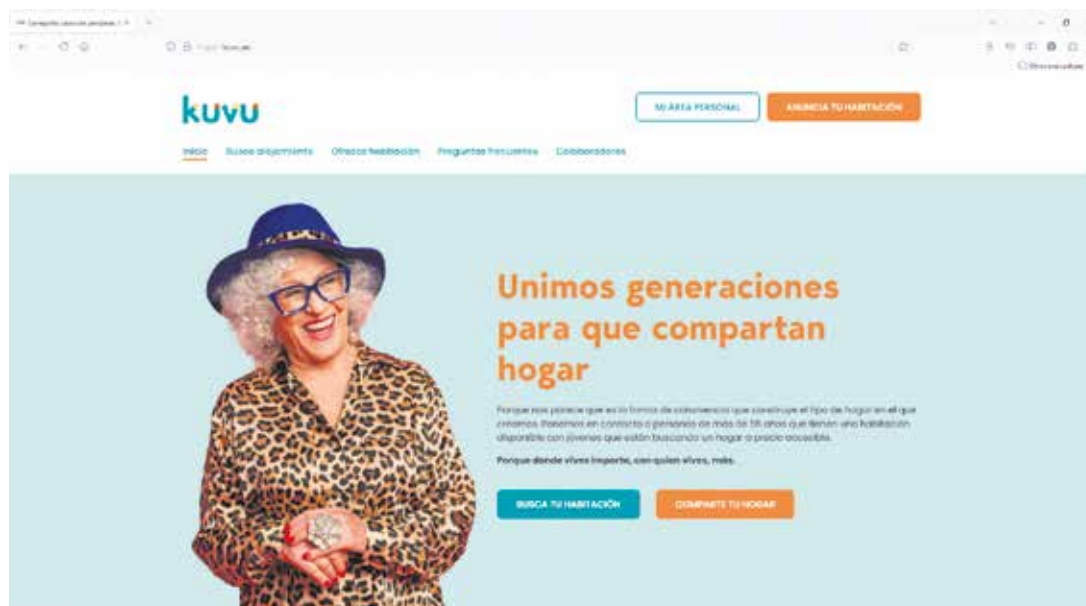
Plataforma Kuvu (kuvu.eu).

“Cada vez tenemos más perfiles de personas jubiladas que contaban con un alquiler antiguo y que el casero no desea renovar. Y se encuentran con precios en el mercado libre que no pueden costear con su pensión. No deja de ser una relación intergeneracional porque conviven personas de 60 años