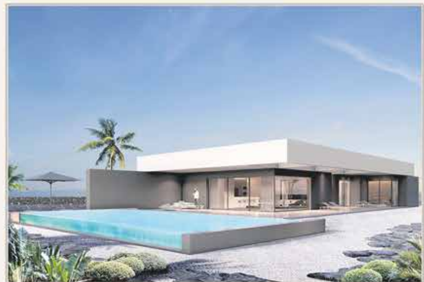
LAJARES - VILLA 3