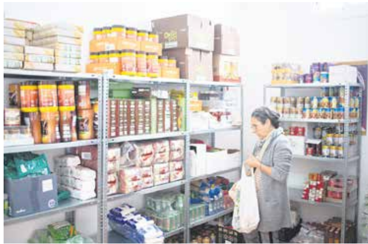
Almacén de Cáritas en la capital majorera.