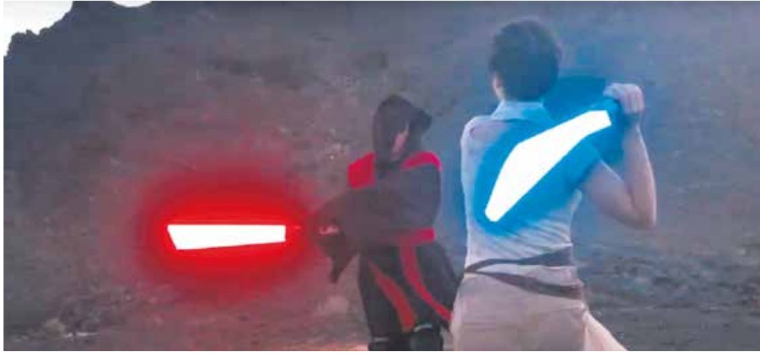
Fotograma de 'Calev'.

Otro aspecto importante del que se percató Tejero fue de las oportunidades de las que disponía en Fuerteventura a diferencia de sus compañeros, pues nadie había estrenado nunca un cortometraje en un auditorio ni le habían financiado un corto. “Me di cuenta también del valor que tiene Fuerteventura y de que hay un filón importantísimo. Al final uno piensa que aquí no hay nada, pero creo que por lo menos en el mundo del cine hay