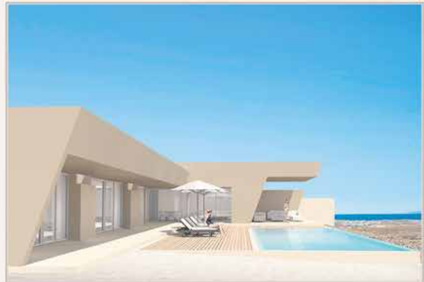
CORRALEJO - VILLA 1