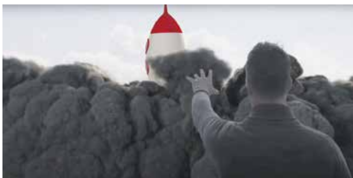
Imagen del corto 'Rocket Boy'.

Otro aspecto importante es el talento joven que existe en las Islas gracias, en parte, a la escuela de cine de Gran Canaria. “Hay muchísimas producciones de altísimo nivel”, señala Adrián. De hecho, el director de fotografía de su anterior cortometraje era un joven de apenas 26 años que durante todo el año trabaja en películas nacionales y de Hollywood, cuenta. “Creo que en Canarias hay muchísimo talento y muchísimas oportunidades”, recalca, al tiempo