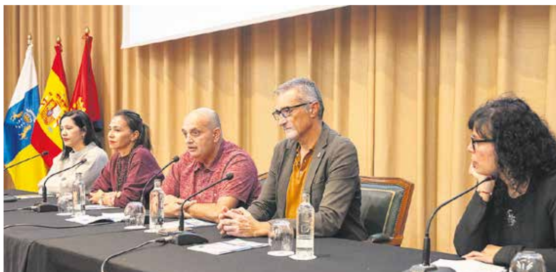
Inauguración de la Jornada.

La tasa de reincidencia de los que pasan primero por el régimen abierto es del 12,6 por ciento y la de los que salen a la calle directamente sin pasar por esa modalidad es de más del doble. Canarias es una de las regiones que se sitúa en la media española de porcentaje de presos con esta modalidad, pero el centro de Tahíche está muy por encima, con un 10 por ciento más que la media. De 419 personas en la cárcel, 113 están en