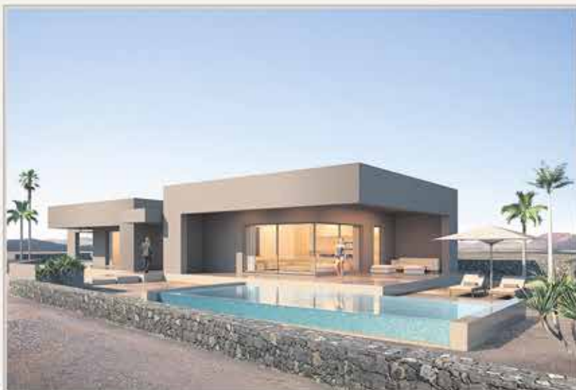
LAJARES - VILLA 2