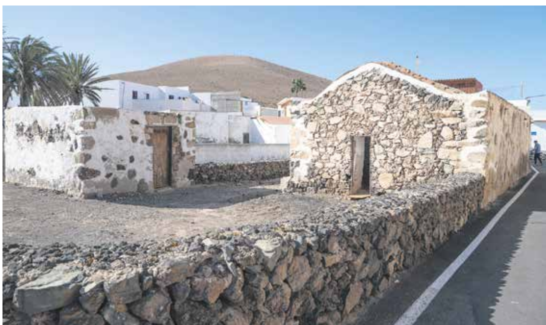
Inmuebles antiguos en la localidad de Pájara.

El equipo redactor del documento alerta del “preocupante deterioro” que sufren parte de las construcciones con valor patrimonial del municipio