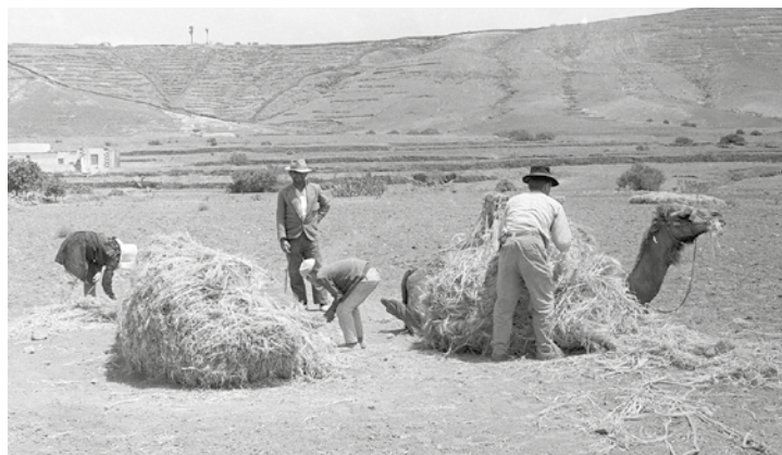
Campeños trabajando con un camello en los años 60 en Fuerteventura.

caso de las batallas de El Cuchillete y Tamasite en Fuerteventura en 1740, cuando las milicias locales usaron los camellos como herramienta de defensa para rechazar de forma victoriosa el ataque de unos corsarios de las colonias británicas de Norteamérica.