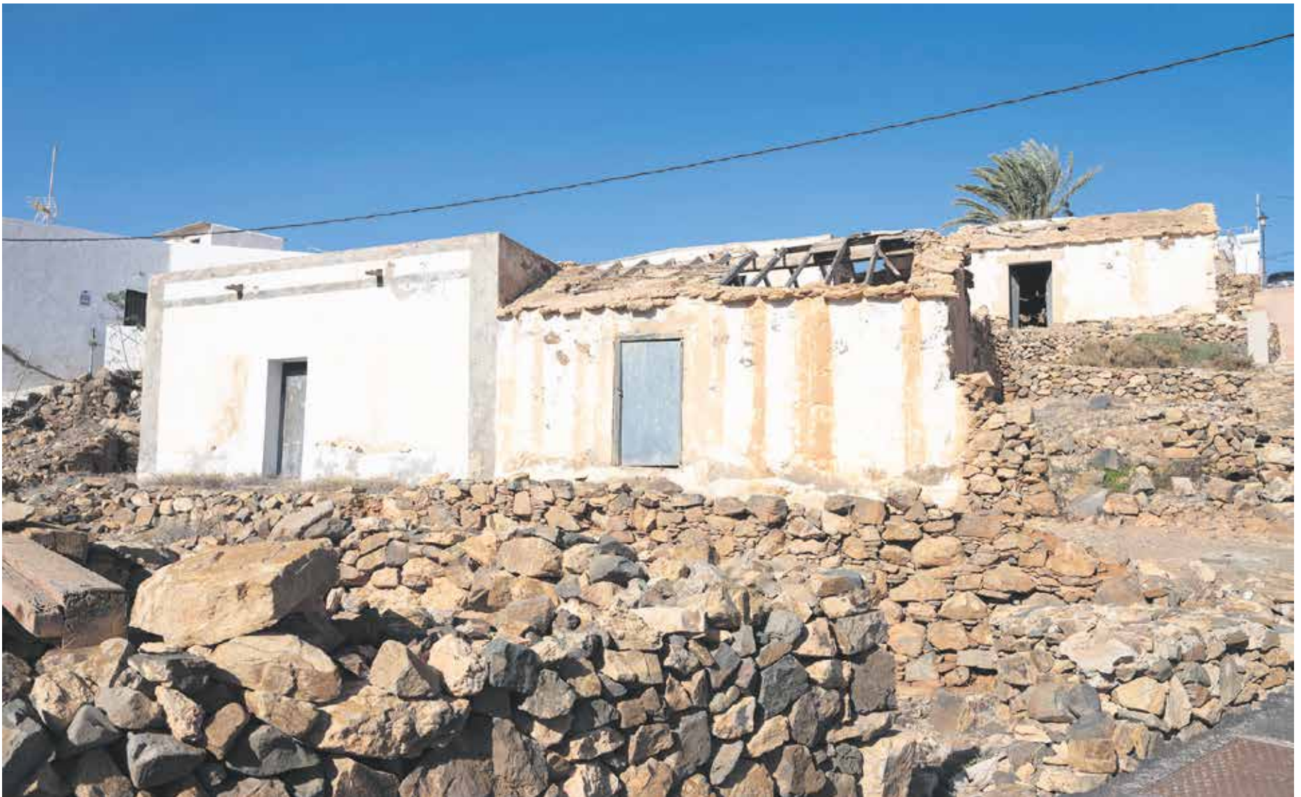
Inmuebles con valor patrimonial en Toto.

cativa” de los inmuebles a “un preocupante deterioro”.