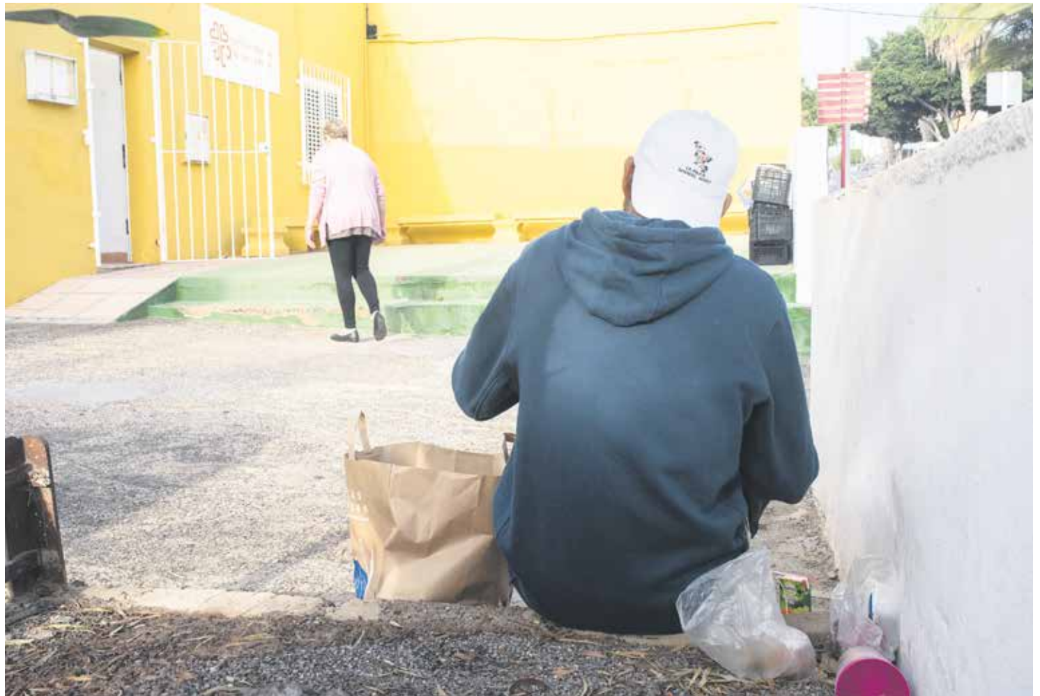
Sede de Cáritas de Puerto del Rosario.