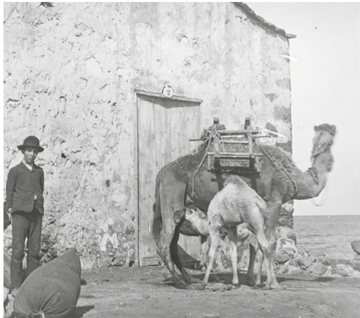
Imagen del siglo XIX de una camella con su cría en Fuerteventura.

Además, de este animal también se obtenía leche, carne, huesos, fibras, aunque estos usos no estuvieron tan generalizados en nuestro archipiélago. Sí era más habitual usar, cuando fallecían, el sebo de la joroba o corcova para fines médicos. En Canarias también se llegaron a emplear incluso hasta con fines militares. Es muy famoso el