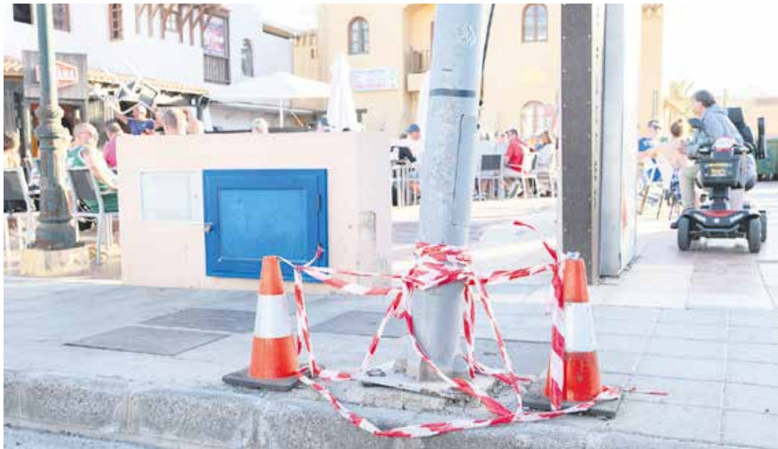
Desperfectos en Caleta de Fuste.

Comerciantes y residentes hablan de “abandono” y reclaman más seguridad y mejoras en las infraestructuras públicas