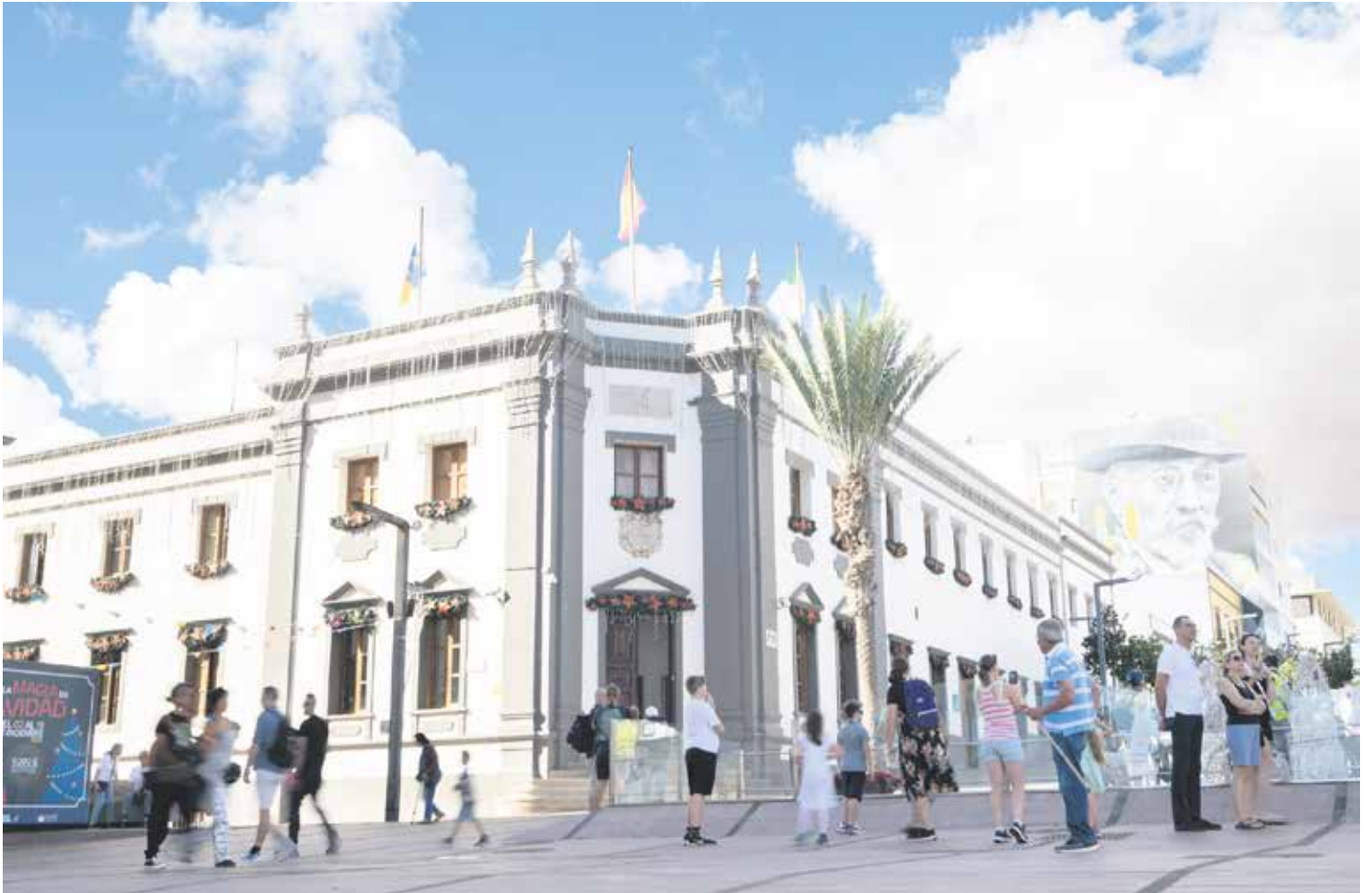
Cabildo insular de Fuerteventura.

Las cuentas no llegan a los 170 millones e Intervención advierte sobre plazas de personal de las que “no se conocen sus funciones” y abuso de las ayudas nominadas