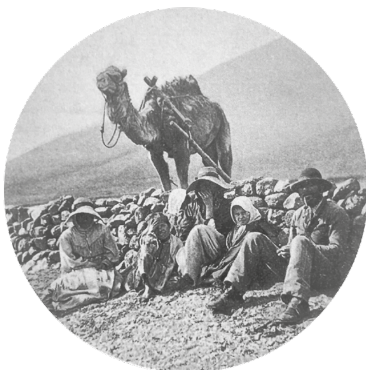
Campeños de Fuerteventura retratados junto a su camello por Henry E. Harris.

Como en otros muchos iconos de la cultura canaria, una mezcla de diferentes continentes, en este caso lo africano y lo europeo, configuró un elemento identitario clave de estas islas atlánticas. Tanto que a pesar de ser un dromedario, el animal ha sido rebautizado tradicionalmente como "camello" en Canarias sin que el empeño de los puristas por llamarlo dromedario haya calado en la sociedad.