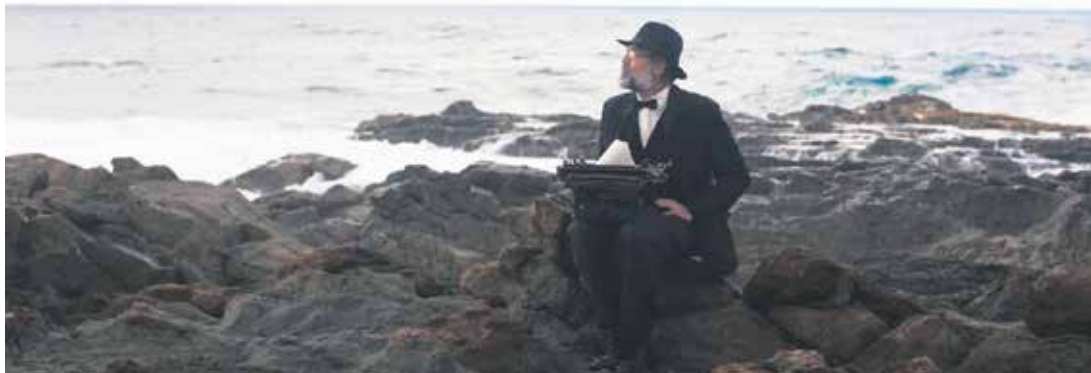
Extracto del cortometraje 'San Manuel Bueno mártir'.

bastantes oportunidades, sobre todo para empezar”.