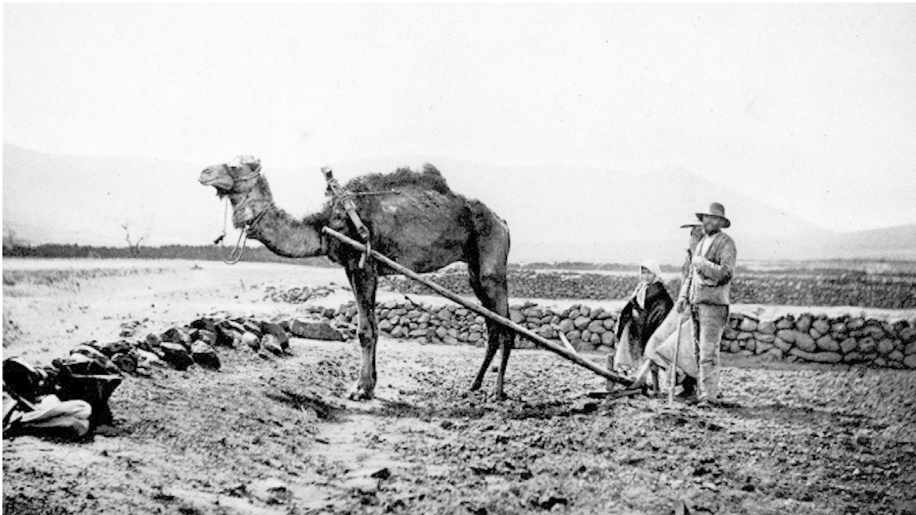
Campeños de Fuerteventura retratados junto a su camello por Henry E. Harris. Las fotografías se publicaron en 1901 en el libro 'Some birds of the Canary Islands and South Africa'.