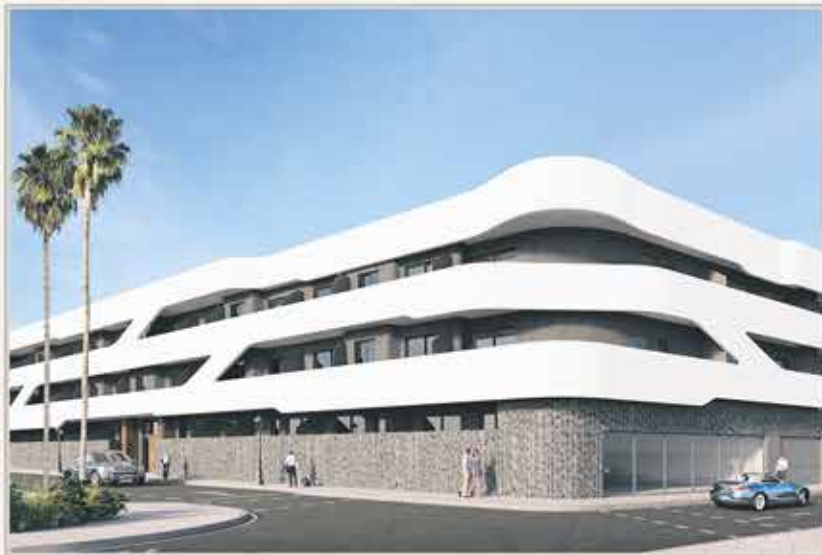
CORRALEJO - VIVIENDAS