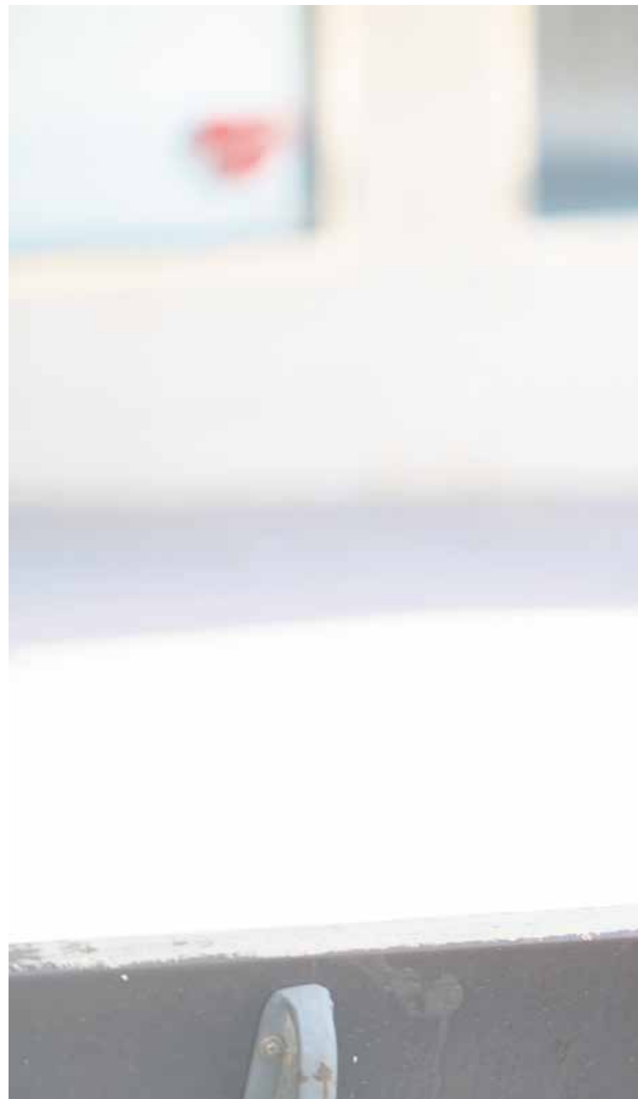
El periodista, en Puerto del Rosario.

-En Canarias, los fotoperiodistas se encuentran, en ocasiones, con obstáculos para cubrir las lle-