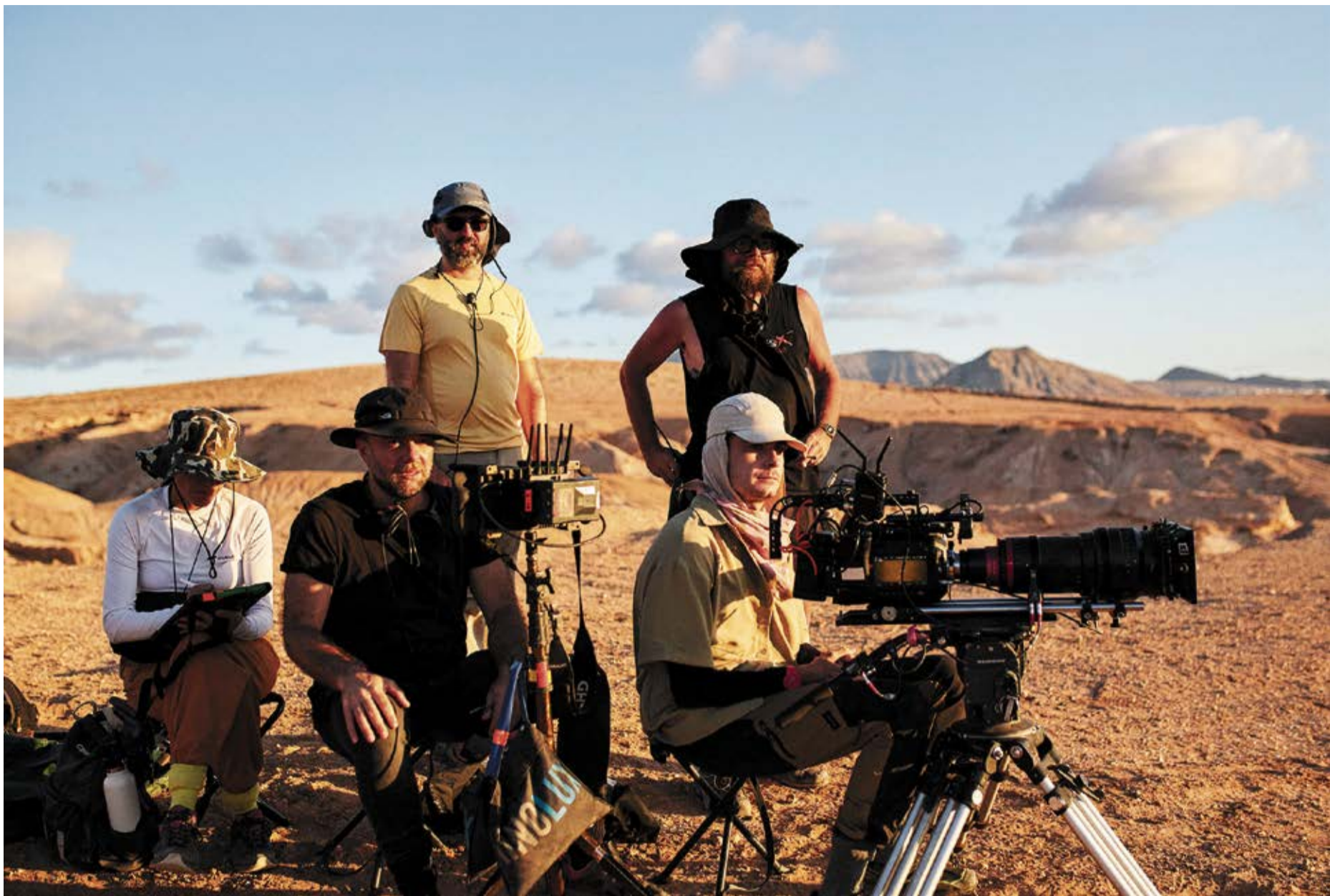
Equipo de rodaje de 'El Exterior' en Fuerteventura.