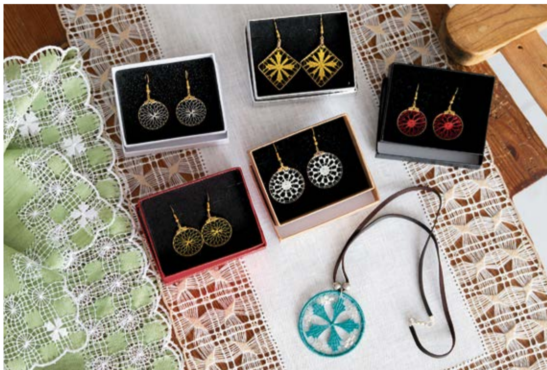
Pendientes, una de sus últimas creaciones.