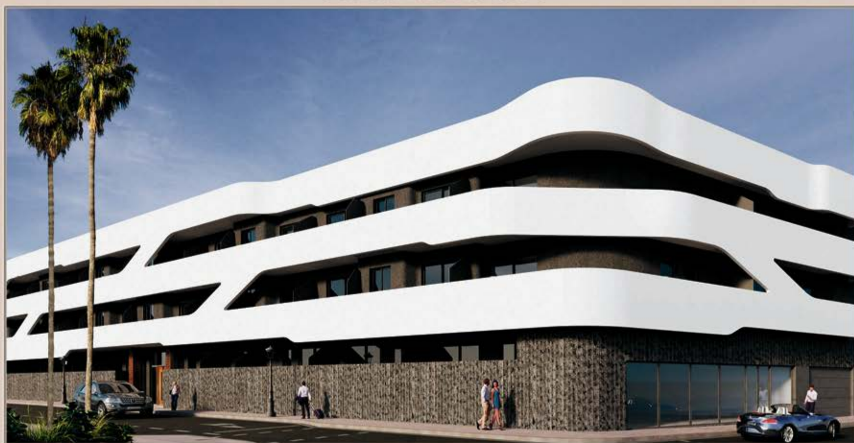
CORRALEJO VIVIENDAS - GARAJES Y TRASTEROS