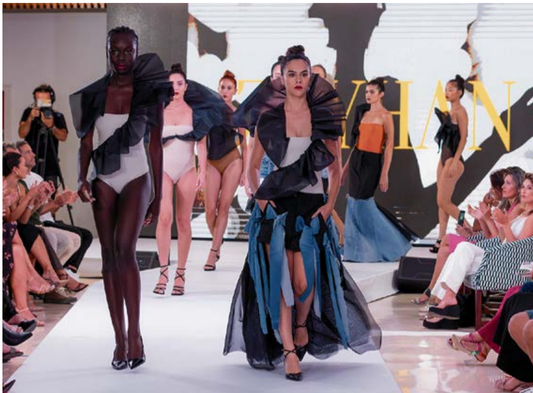
Colección 'Prestige' de Zayhan en la pasarela Fuerteventura Fashion Week.

Prestige dio vida a la colección de Zayhan, inspirada en las mujeres pioneras de comienzos del siglo XX, que se atrevieron a cortarse la melena, bailar charleston y usar pantalón. Bañadores reciclados para hacer piezas con volúmenes y pantalones de pinza negros simbolizaron la libertad y emancipación femenina.