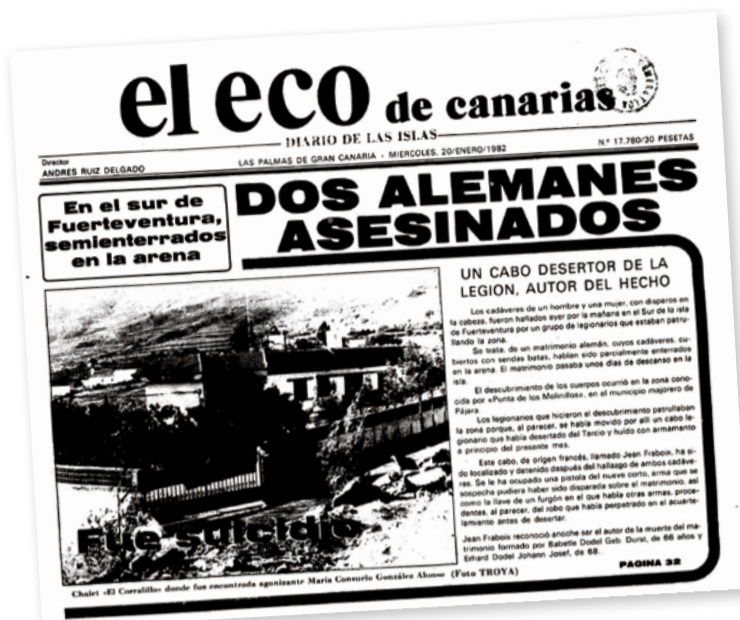
Portada del periódico 'El Eco de Canarias' de 1982 dedicada al asesinato de dos alemanes por parte de un desertor de la Legión.

A partir de finales de 1975 se abrió otro frente, con el traslado de la Legión a varias zonas de Canarias y de la Península, pero