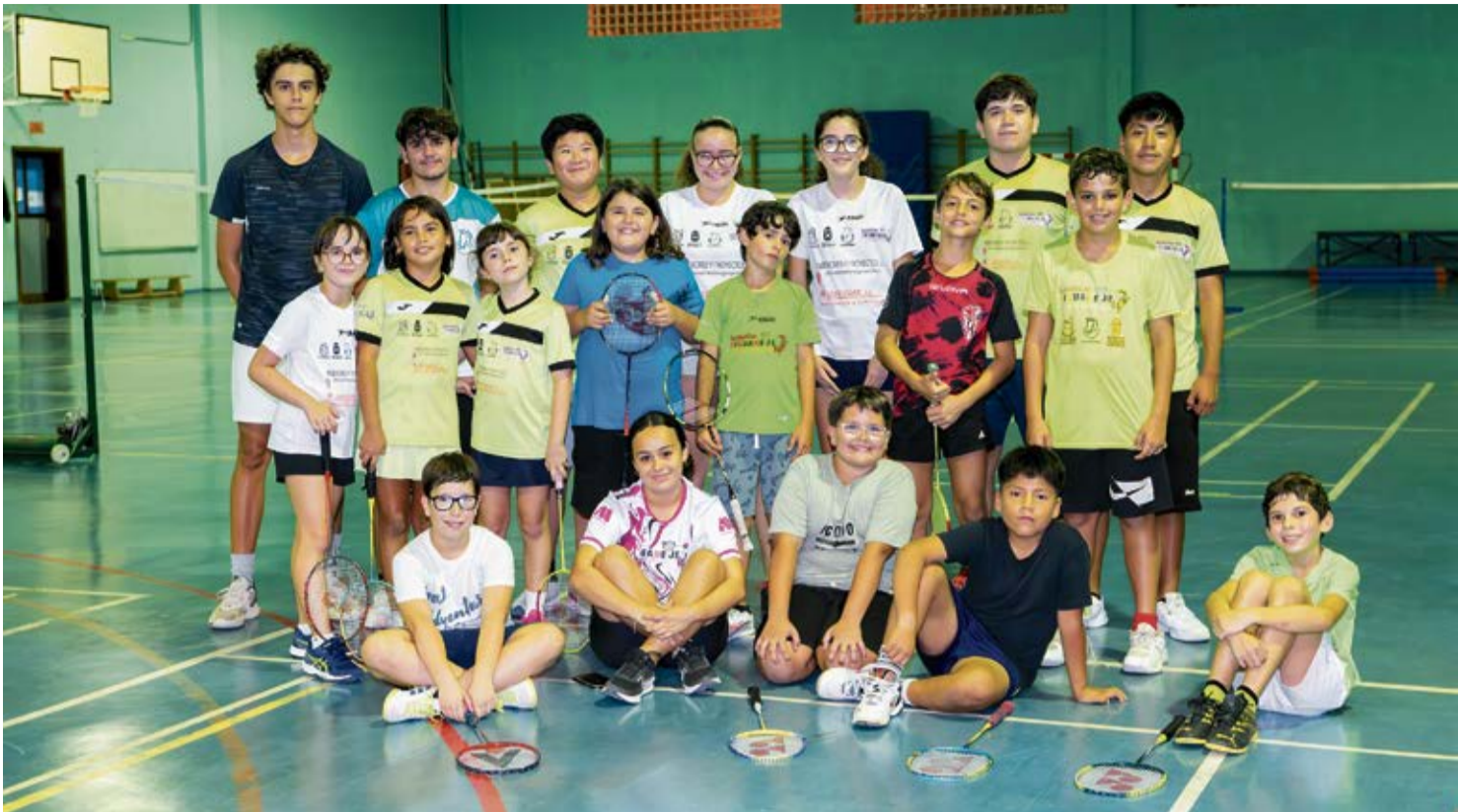
Deportistas del club posan para Diario de Fuerteventura.

Por último, el presidente también destaca una competición que organiza su club junto a los vecinos del Club Raqueta de Lanzarote. Un torneo con casi tres décadas de historia. “Es como un contrato sin firmar de hace 29 años. Es algo que he-