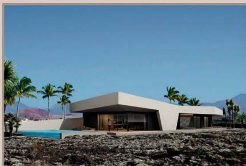
LAJARES VILLA 1