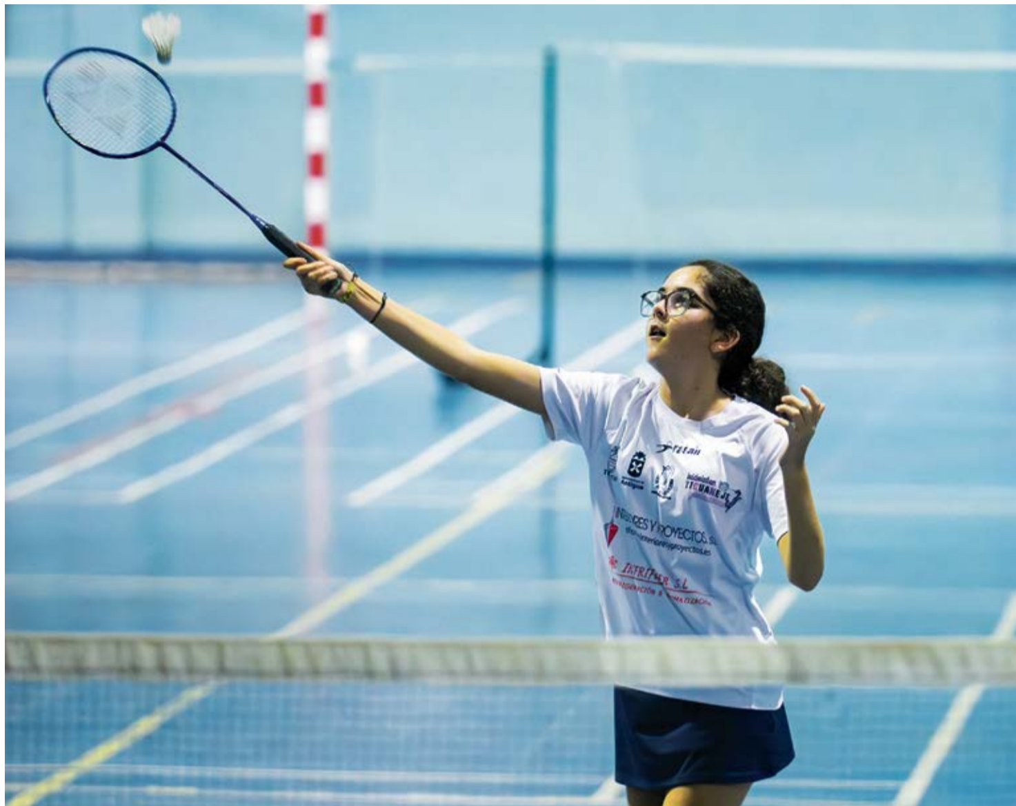
El club majorero aspira a llevar a sus deportistas a la Península.

En el Polideportivo de Antigua comienzan a las seis de la tarde y terminan a las siete y media para los más pequeños, y luego siguen los mayores.