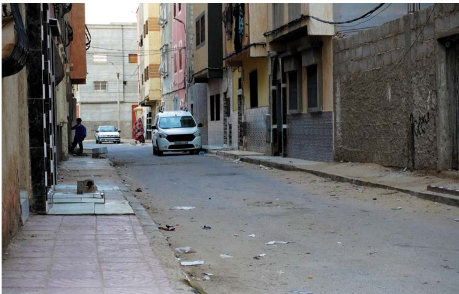
Calles de El Aaiún.

En 2020 se dio por roto el alto el fuego, hay más de 160 víctimas por ataques de drones y son reiteradas las denuncias por la represión marroquí