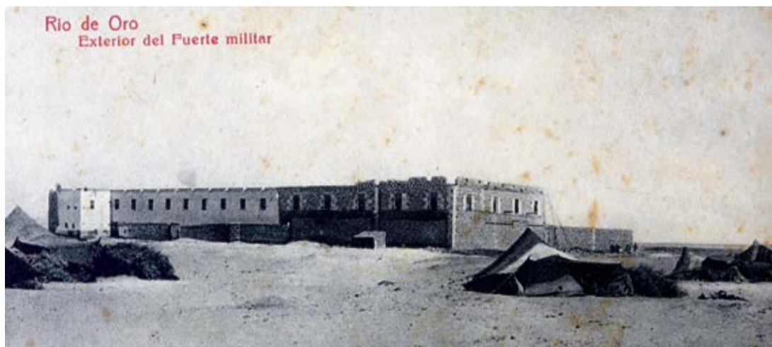
Postal de principios de siglo de un acuartelamiento español en el Sáhara.

La tensión fue aumentando al mismo tiempo que el franquismo afrontaba sus últimas etapas. Franco había prometido la autodeterminación a los saharauíes e inició consultas con organismos internacionales, aunque al mismo tiempo la presión de Marruecos y Mauritania iba en aumento. El rey Hassan II lanzó la Marcha Verde, con cientos de miles de civiles desarmados adentrándose sin permiso en el Sáhara Occidental para reclamar la "marroquinidad" de estos territorios. El 14 de noviembre de 1975 (seis días antes de la muerte de Franco) se firmaron los Acuerdos Tripartitos de Madrid. Este pacto daba la admi-