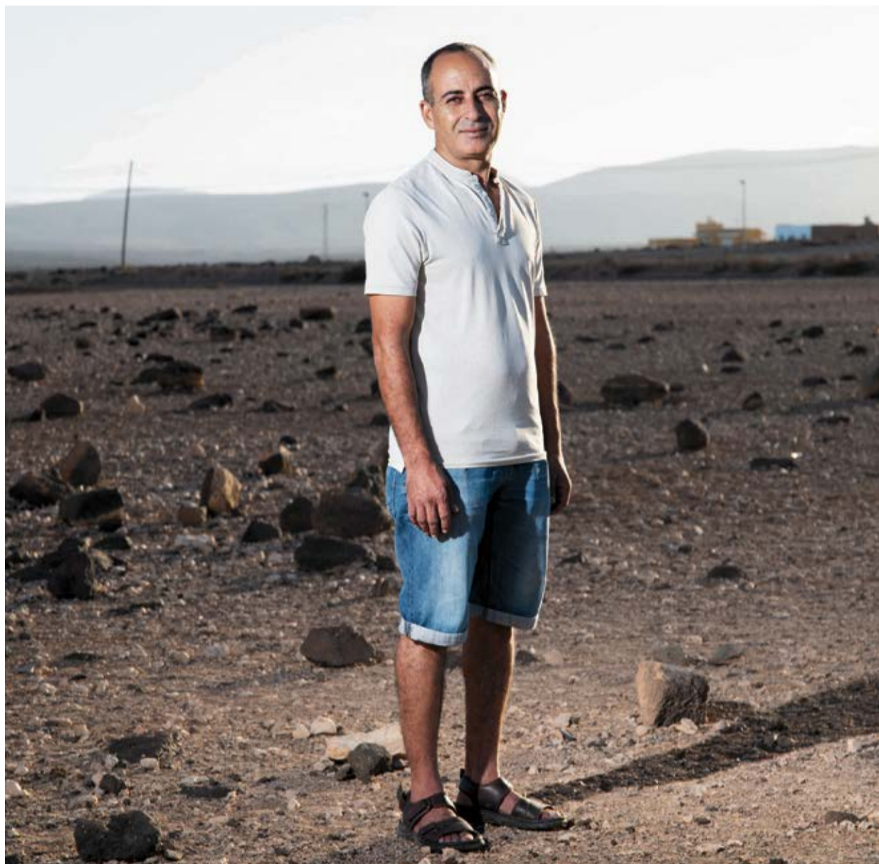
Ramda, en Fuerteventura.

Con tan solo un año y cinco meses de edad, huyó con sus padres y sus ocho hermanos al desierto de Tinduf tras la llegada de la Marcha Verde al Sáhara Occidental