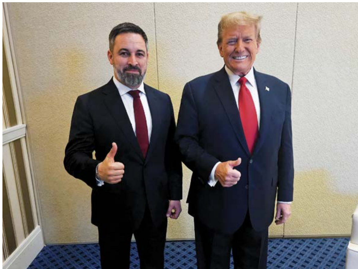
Santiago Abascal y Donald Trump.

Lo intentó en las elecciones generales de Canadá hace unos meses, con resultados nefastos para su patrocinado. El ganador de los comicios y ahora primer ministro supo envolverse en la bandera como respuesta al propósito expansionista del vecino del sur. La suerte de Canadá es que, aun siendo EEUU su principal socio comercial, no padece una dependencia del vecino en lo económico y mucho menos en lo psicológico. No era este el caso de Argentina, que acudía a los comicios legislativos en una situación financiera angustiosa que a corto plazo solo tenía y tiene remedio con el rescate del Tesoro estadounidense. Y Trump se lo dejó muy claro a los votantes: los 20.000 millones de dólares (ampliados al doble) destinados a frenar el desplome del peso argentino solo llegarían en caso de que el presidente Javier Milei, su aliado y vasallo, lograra un triunfo lo suficientemente claro para poder implementar su agenda de reformas. Vistos los resultados, sobre todo comparados con los que se produjeron en las elecciones en la provincia de Buenos Aires, solo unas