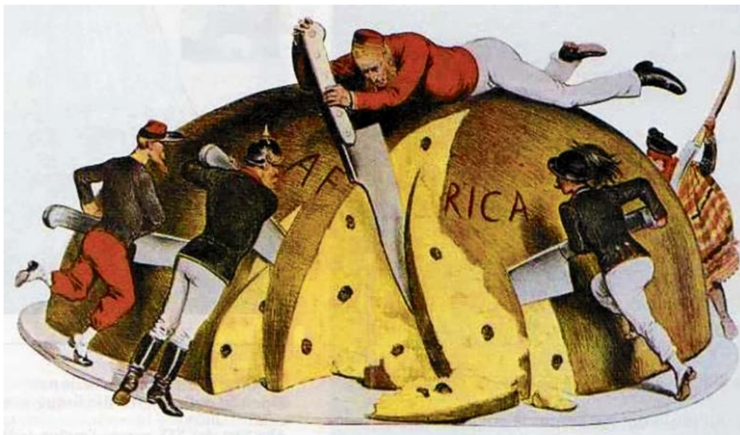
Viñeta histórica del "reparto de África" realizado por los dirigentes europeos.

La aventuras y desventuras españolas en el continente africano siempre han afectado especialmente a Fuerteventura y Lanzarote