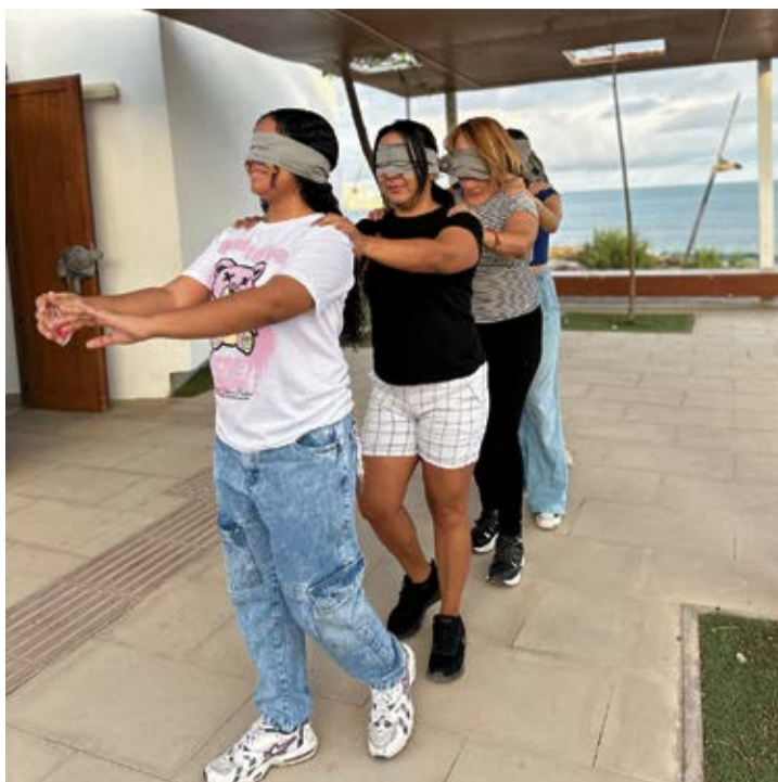
Ejercicio de confianza y comunicación durante el taller de autodefensa feminista.

-¿Por qué es tan importante en estos talleres poner el foco en lo estructural?