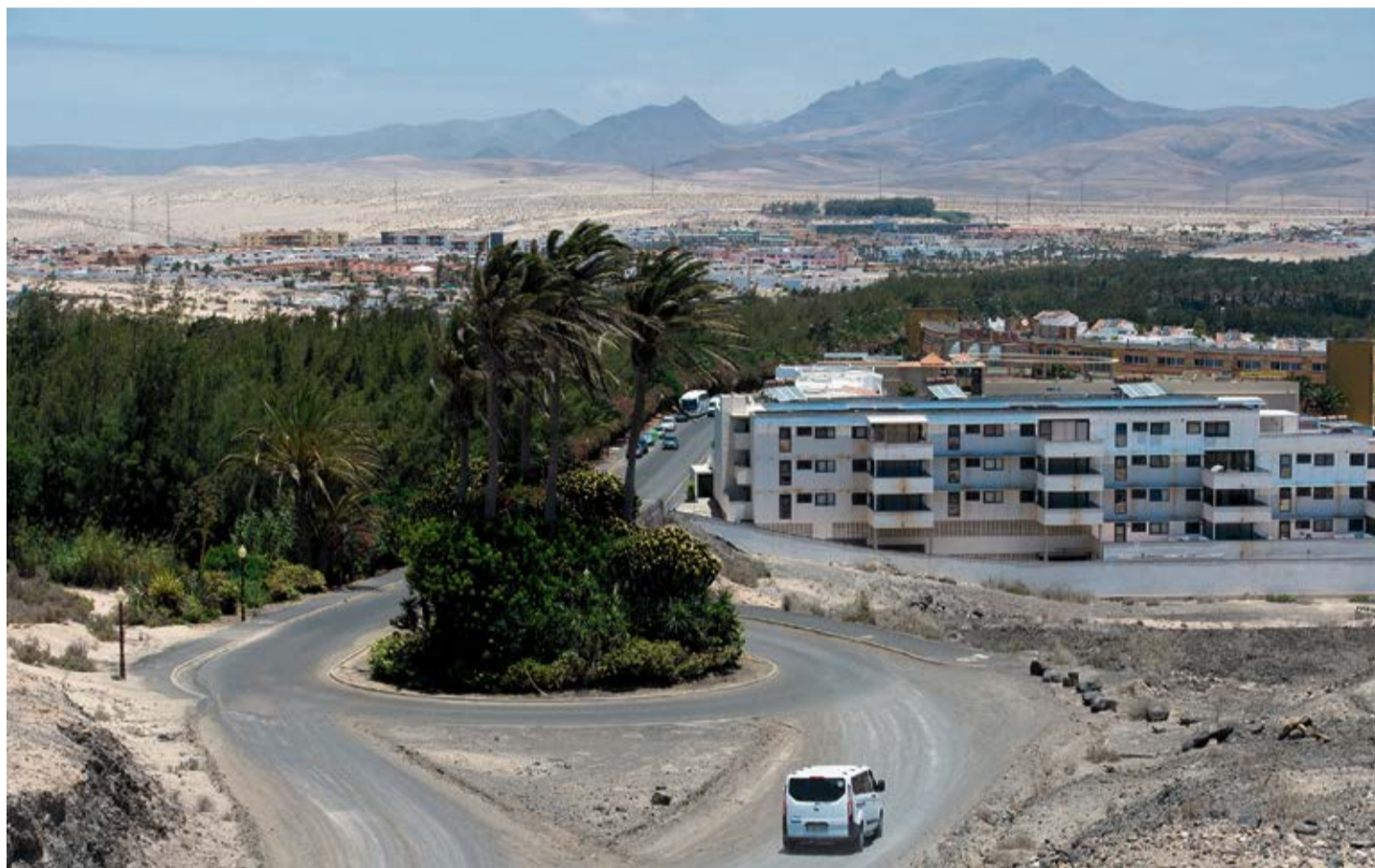
Vista de la localidad de Costa Calma.

El coste medio del servicio integral de abastecimiento de agua potable y de alcantarillado y depuración de Pájara es de 3,57 euros por cada metro cúbico facturado. El informe técnico utiliza ese desglose de costes para el nuevo servicio. “La justificación de la utilización de costes medios de servicios existentes en el entorno más cercano de