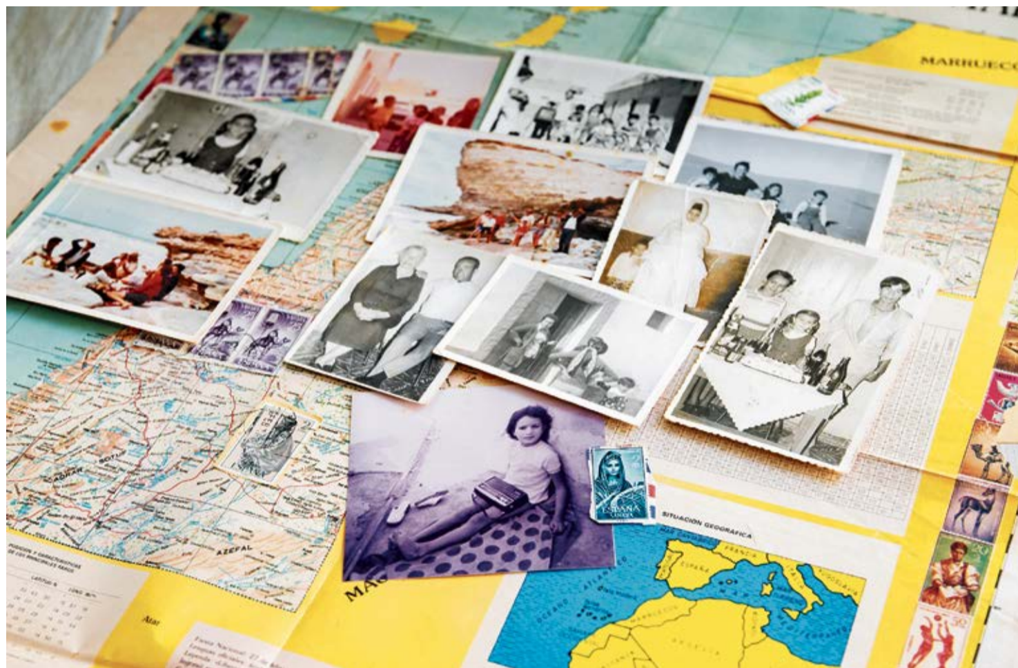
Fotografías antiguas de majoreros residentes en el Sáhara.

Tal vez el padre de Rita Díaz se cansó de mirar al cielo y eso fue lo que le empujó a irse a apenas cien kilómetros de Fuerteventura en busca de oportunidades. “Mi padre y algunos de los hermanos se marcharon en 1965. El resto de la familia en 1966. Fueron a trabajar al Sáhara porque en la Isla lo único que había era agricultura, ganade-