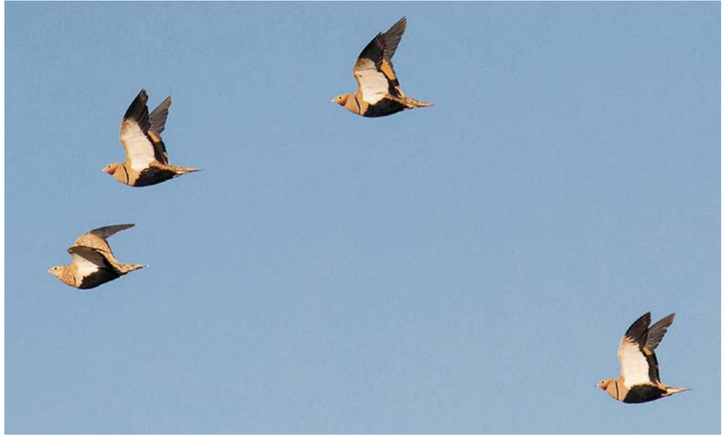
Ejemplares en vuelo.

La ganga ortega está perfectamente adaptada a los ambientes áridos. Más fácil de escuchar que de ver, su plumaje, en tonos ocre, grises y cremosos, con la inconfundible barriga negra y collar en el pecho, lo camufla entre los llanos pedregosos hasta el punto de hacerla invisible a nuestros ojos. Solo cuando sale volando mientras emite su inconfundible reclamo la descubrimos hermosa, pues es un ave de figura potente, compacta, recia pero al mismo tiempo muy aerodinámica. Es capaz de recorrer largas distancias de hasta 50 kilómetros diarios, con una velocidad de vuelo de unos 60 a 65 kilómetros por hora, en busca de agua y alimento. Estos desplazamientos son especialmente habituales en las primeras horas de la mañana y al atardecer, ya que el consumo de agua es vital para estas aves granívoras. Sus patas, cortas y fuertes, le permiten caminar por terrenos duros donde son capaces de encontrar entre