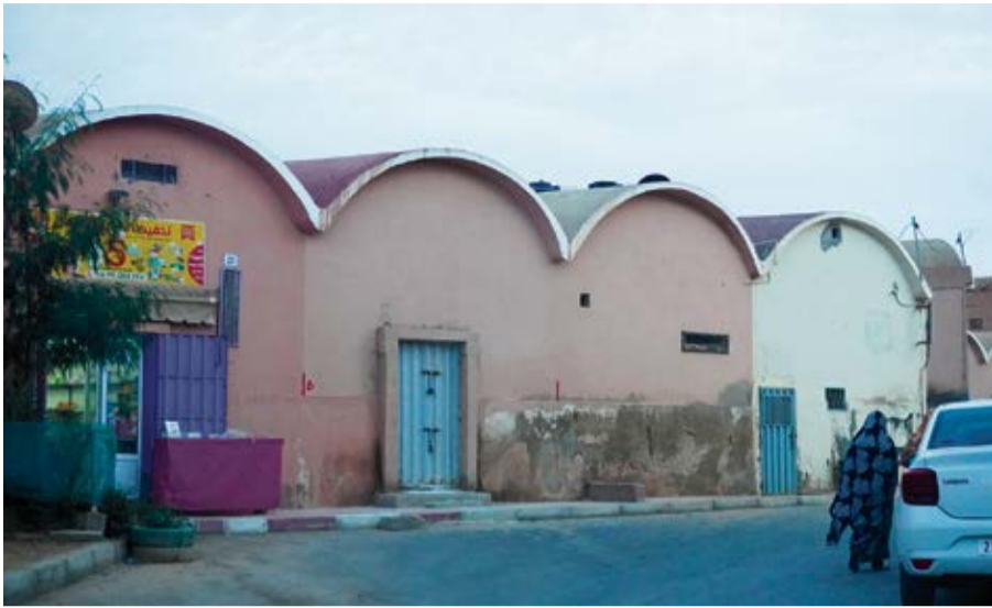
Una mujer camina cerca de una tienda en la localidad saharauí.