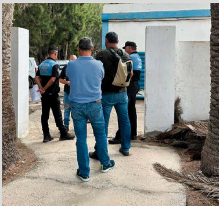
El pasado mes de agosto, el Ayuntamiento intentó visitar, sin éxito, la desaladora tras recabar autorización judicial.

“Si quisiera hacerse cargo de la explotación de las plantas desaladora y depuradora, deberá hacerse antes con su titularidad y posesión. No resulta procedente que el Ayuntamiento incluya en la licitación de referencia la explotación y