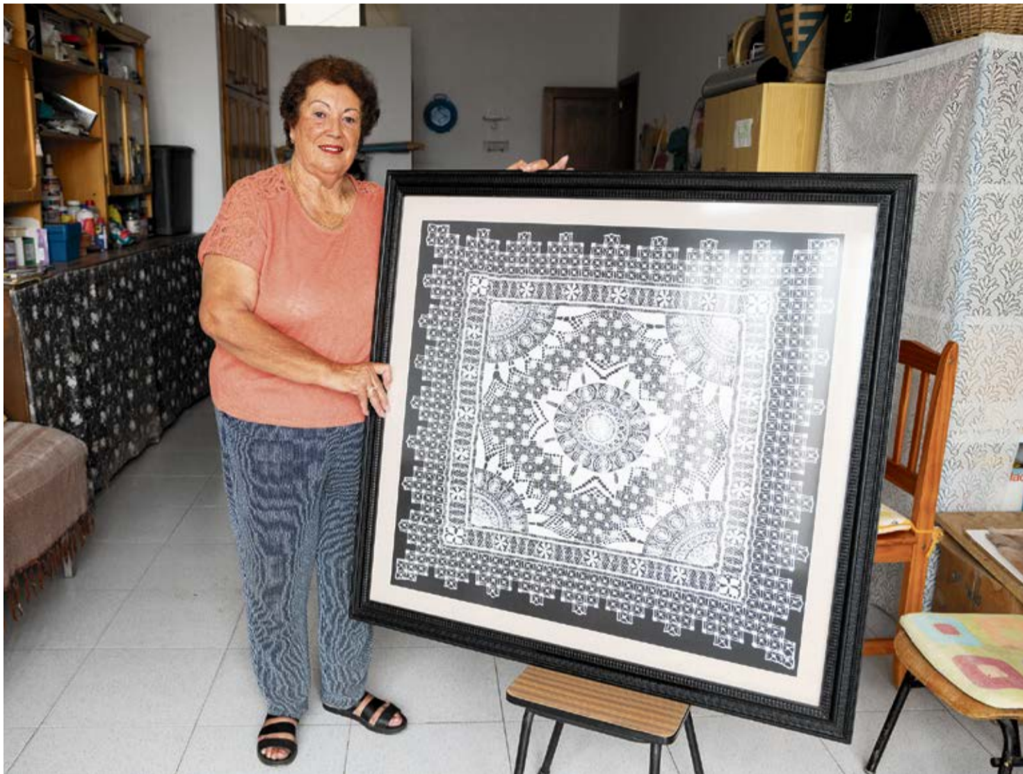
La artesana muestra una de las obras de las que más orgullosa está.

A sus 80 años, sigue con la misma ilusión de entonces. Asegura que con esta dedicación se mantiene muy activa, pero también le encanta su trabajo porque le gusta “lo nuestro” y no duda en colaborar mostrándose voluntaria para cualquier feria o actividad donde pueda poner en valor este oficio. “A mí me quitan mi calado y es como si me cortaran las alas”. Tanto es así, que se sorprende de que aún se acuesta todas las noches “rumiando” qué idea va a poner en práctica al día siguiente. Una de sus últimas creaciones son los ya so-