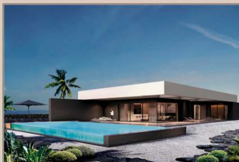
LAJARES VILLA 2

TFNO: 922 27 94 12 teotimo@teotimoarquitecto.com