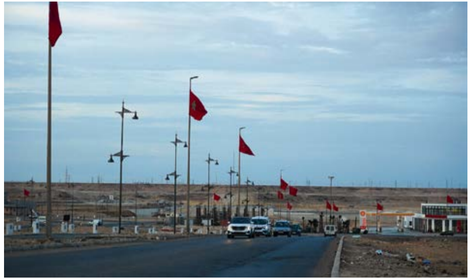
Numerosas banderas marroquíes impuestas por las fuerzas de ocupación.