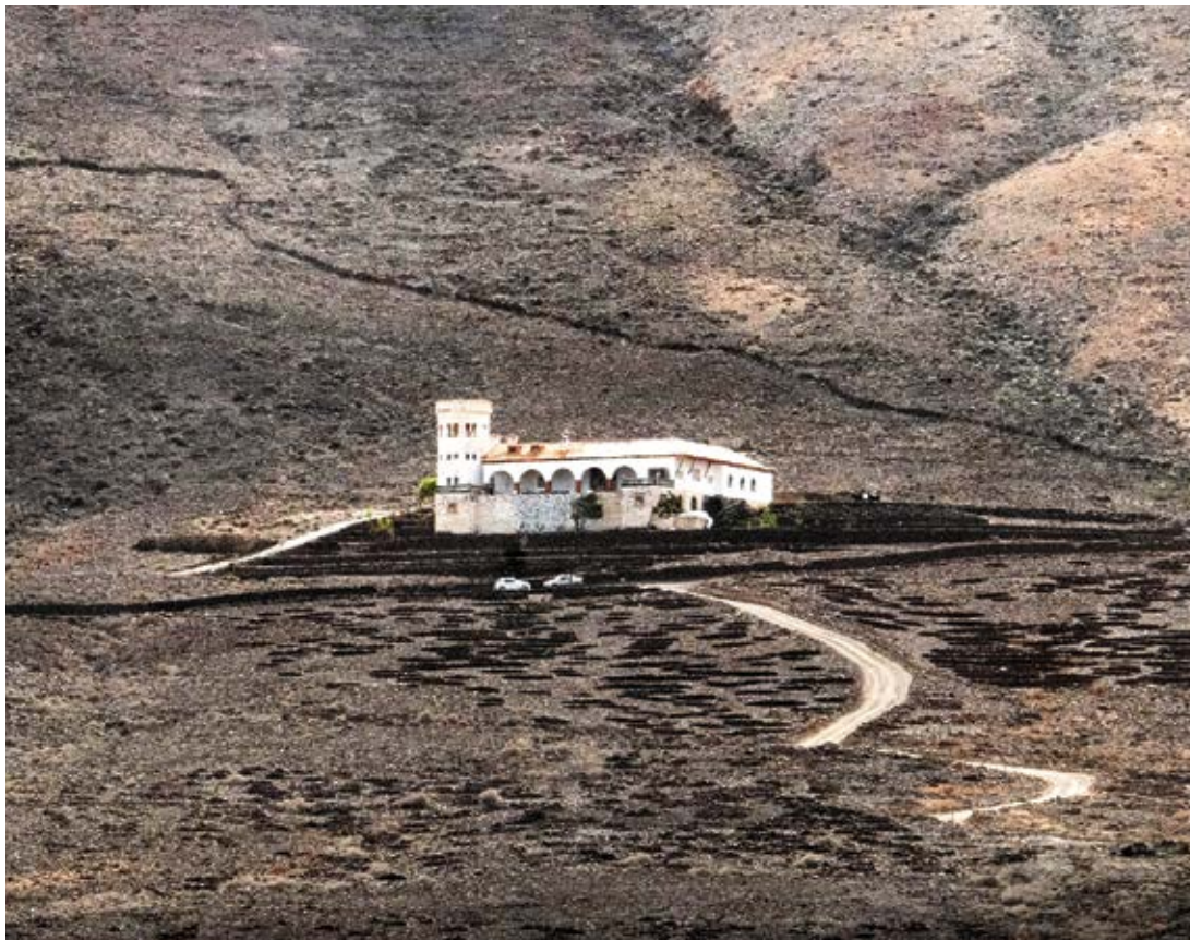
Casa Winter en Cofete.

-Hubo una fase inicial intensa, de octubre de 1946 a septiembre de 1947, y luego la obra se paralizó año y medio. En septiembre de 1947 mis padres viajaron desde Madrid: mi ma-