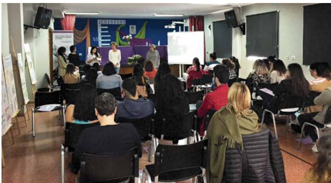
Encuentro entre técnicos y técnicas en Promoción de Igualdad de Género.