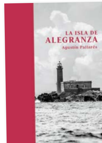
Portada de 'La isla de Alegranza'.

Este faro está situado en el punto de Canarias más cercano a África, a aproximadamente