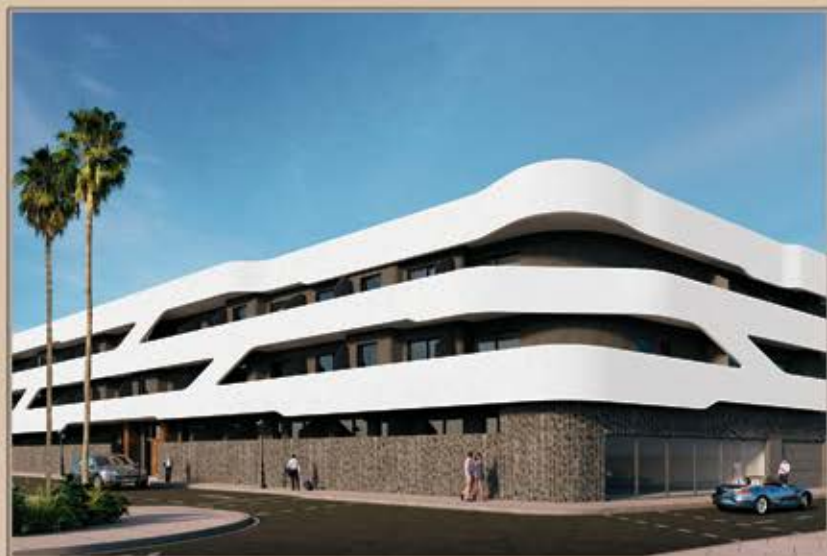
CORRALEJO - VIVIENDAS