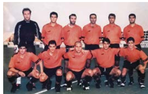
Fotografías de equipos históricos del CD Corralejo, junto a su escudo.