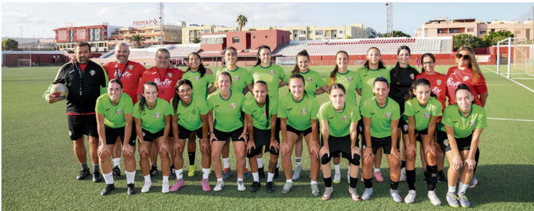
Plantilla del CD Caday que disputará la Tercera Federación femenina.