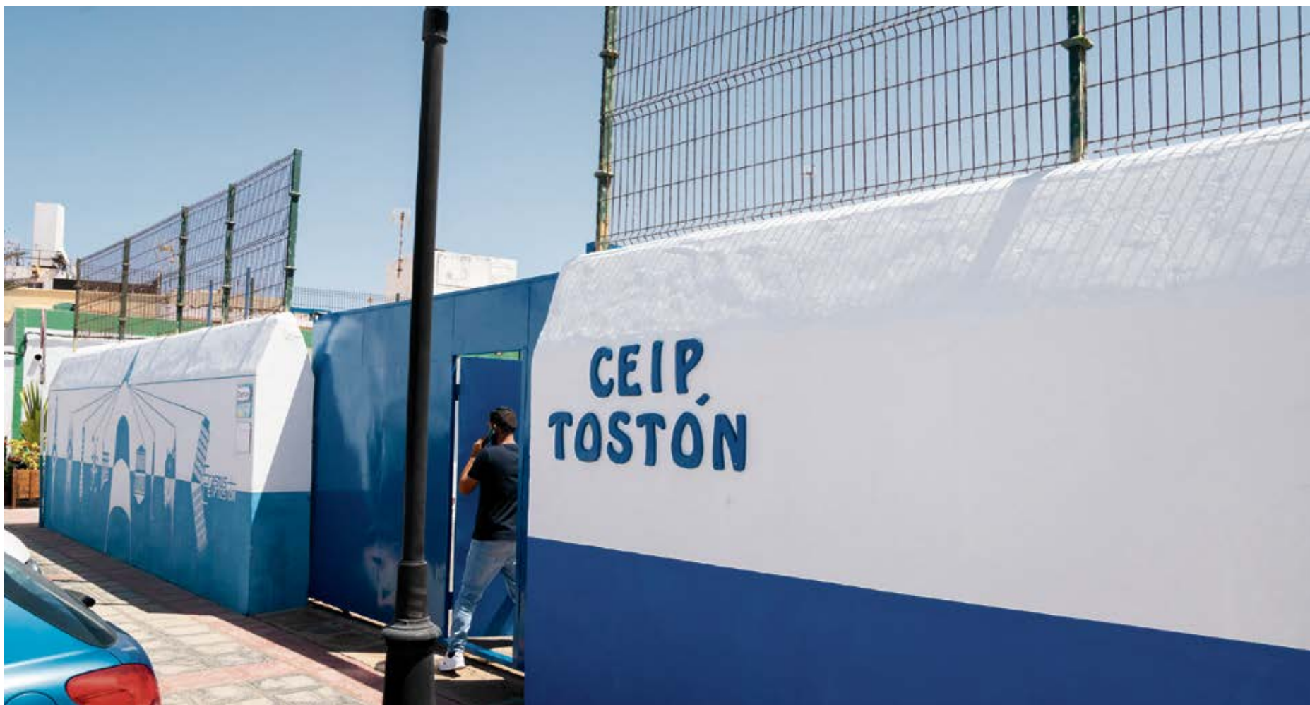
CEIP El Tostón en El Cotillo.