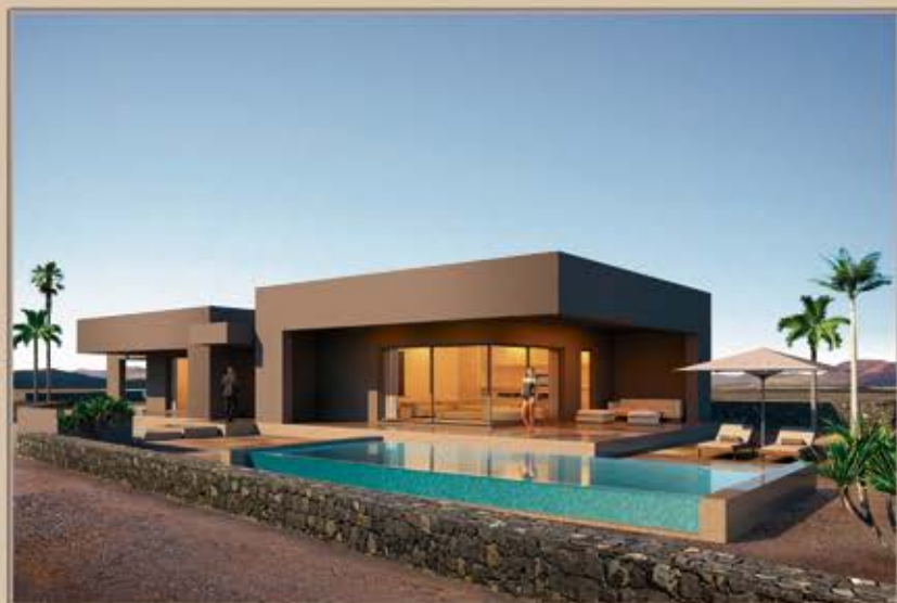
LAJARES - VILLA 2