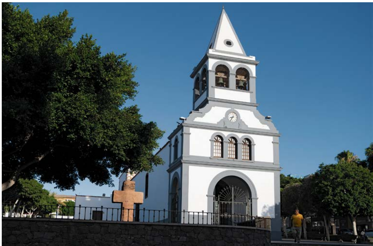
Iglesia de Puerto del Rosario.