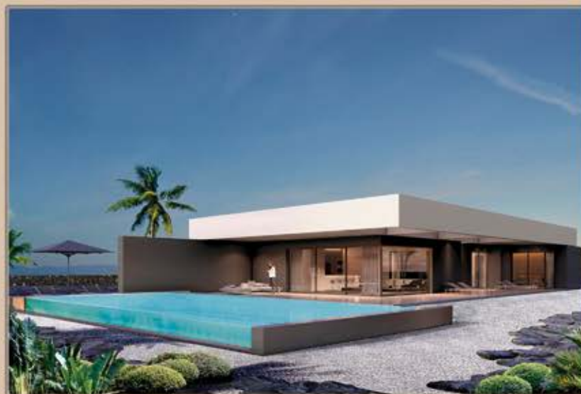
LAJARES - VILLA 3