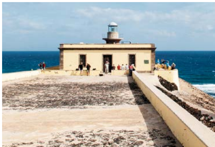
Faro de Isla de Lobos.

Al otro lado de La Bocaina, viéndose e iluminándose mutuamente, está el faro de Martiño, en el norte de Isla de Lobos. Es de la misma hornada que los de Lanzarote nombrados anteriormente, ya que entró en funcionamiento en 1865. Los tres tienen características muy similares: una torre cilíndrica de 15 metros de alto y 3,7 de ancho que va adherida a una construcción de una sola planta, la cual, a su vez, se divide en varias habitaciones para los fareros y sus familias, a partir de un patio central. Además, están provistos de aljibes y otros sistemas de recogida de agua. Los materiales de construcción son sencillos: piedras de cantería, barro y cal.