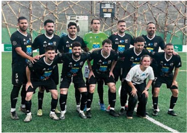
CD Herbania.

El primer equipo dio comienzo a la pretemporada el 18 de agosto para una temporada que el propio Alba califica de “atípica”, pues a comienzos de este mes de septiembre disputará la Copa Canaria y, a finales de ese mes, el día 27, será el debut en liga ante el Elche en su feudo. La segunda jornada, al ser un grupo impar, le toca descansar y hará su debut como local contra un equipo catalán. “El coste es muy elevado”, señala el presidente, que recalca que tienen que desplazarse a la Comunidad Valenciana y Cataluña y que, por tan-