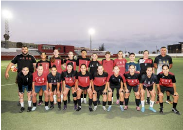
CDRC Peña de la Amistad.

to, “tendremos que hacer noche y, por tanto, son gastos de viaje, dietas, alojamiento, comida, coches de alquiler...”. Sin embargo, el club continúa en la búsqueda de patrocinadores y considera que la ayuda de las instituciones públicas es “fundamental”. El presidente del combinado sureño espera que las instituciones se vuelquen con el equipo para poder sacar la temporada y salvar la categoría, pero la realidad es que aún no han mantenido encuentros: “De momento hemos estado confeccionando la plantilla, planificando lo que es la temporada deportiva y ahora afrontaremos la temporada económica. Tenemos un colchón económico para afrontar el comienzo de la temporada”, asegura Alba.