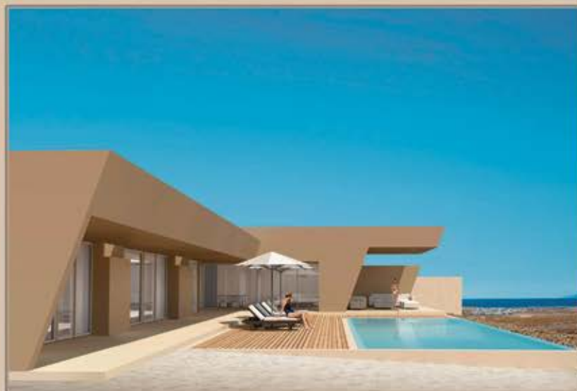
CORRALEJO - VILLA 1