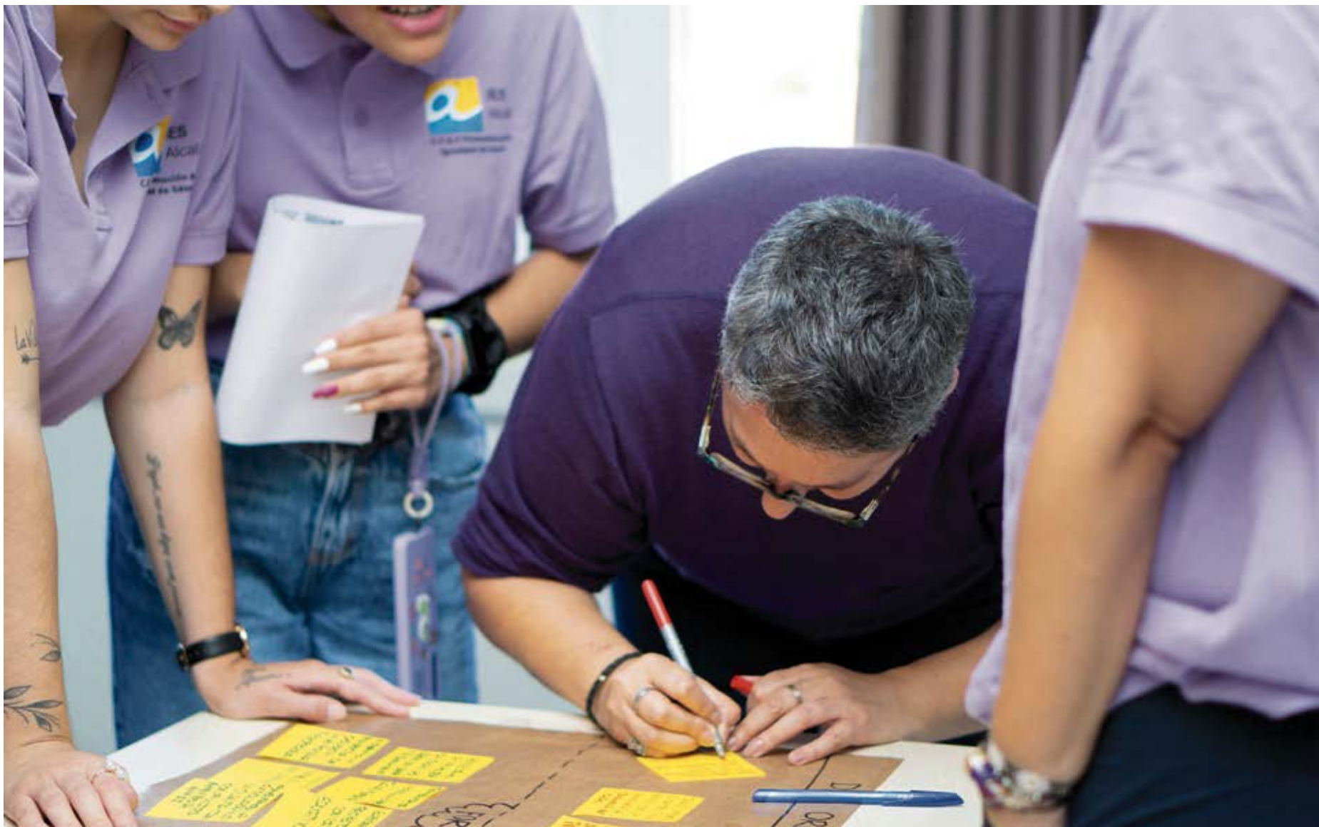
Promotoras de igualdad durante las Jornadas 'Somos+', celebradas en 2023, realizando un análisis DAFO sobre la profesión.