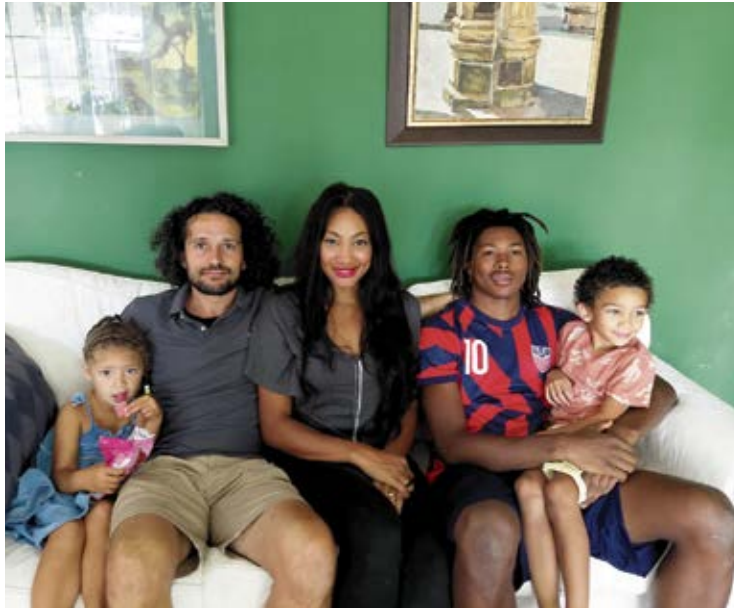
La familia, al completo.