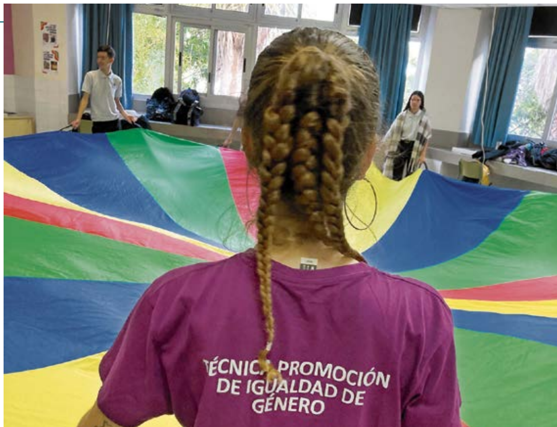
Alumna del Ciclo Superior de Promoción de la Igualdad de Género del CFP Felo Monzón Grau-Bassas.

Desde la Viceconsejería destacan que “de las 19 solicitudes de matrícula en modalidad presencial para el curso 2024/2025 se ha pasado a 80 solicitudes en formato virtual”. No obstante, la Viceconsejería no ha compartido datos acerca del perfil de esas 19 personas interesadas en la modalidad presencial, ni si las 19 han ingresado en la modalidad virtual o si han optado por otra formación con motivo de no poder cursar de manera presencial, o si simplemente han ingresado en la online pero preferían la opción presencial. Se trata de unos datos que, junto con otros de carácter también