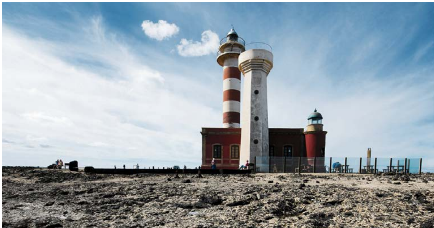
Faro de El Cutillo.

Estos elementos de iluminación tienen una función esencial de orientación en la navegación, pero han ido mucho más allá, convirtiéndose en iconos arquitectónicos de la costa canaria y también en emblemas de un modo de vida, el de los fareros o torreros, una profesión legendaria que conforme desaparece por la automatización del servicio su recuerdo adquiere más romanticismo. Eran hombres, con sus familias, que muchas veces vivían en lugares remotos, desempeñando una labor clave para la seguridad de miles de personas, la cual, además, requería conocimientos técnicos avanzados. Su oficio fue mejorando