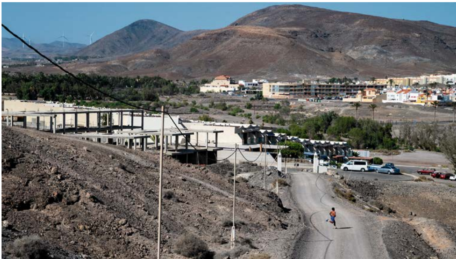
Localidad de La Lajita, donde existe la demanda histórica de un instituto.

También tendrán que seguir esperando un año más los vecinos de Lajares. La demora tiene pinta de eternizarse en el tiempo. Al terreno que el Ayuntamiento tenía previsto ceder a Educación le ha salido otro propietario. “En el Ayuntamiento tenemos claro que nosotros somos los pro-