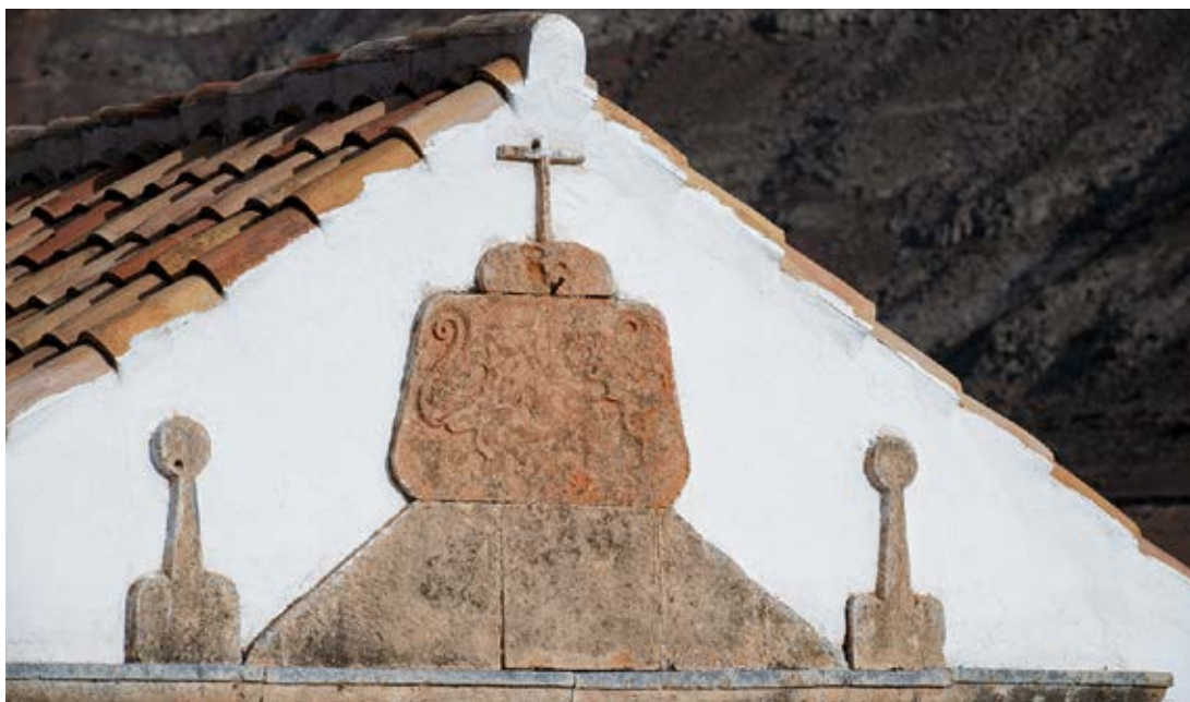
Sobre el dintel de la puerta de entrada de la ermita puede verse en relieve la figura de dos ratas enfrentadas.