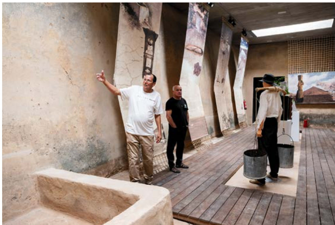
Centro museístico en el Aljibe del Veneno.

En el pueblo norteño es posible acumular unos 10.000 metros cúbicos de agua en más de un centenar de construcciones diseminadas por la localidad