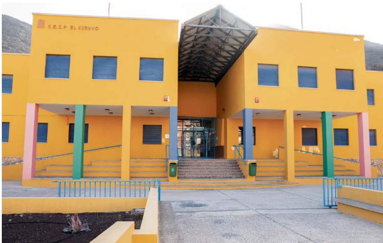
Fachada del antiguo colegio El Ciervo que, a partir de este curso, albergará la Formación Profesional.

La nueva oferta en Administración ha sido una de las más exitosas, con 20 matrículas en el CFGM de Gestión Administrativa, y se ofertó inicialmente el primer curso de Grado Superior de Administración y Finanzas, que fue eliminado. Sale también en Comercio y Marketing un primer curso del CFGM en Actividades Comerciales, que cuenta con una decena de alumnos, y se anunció