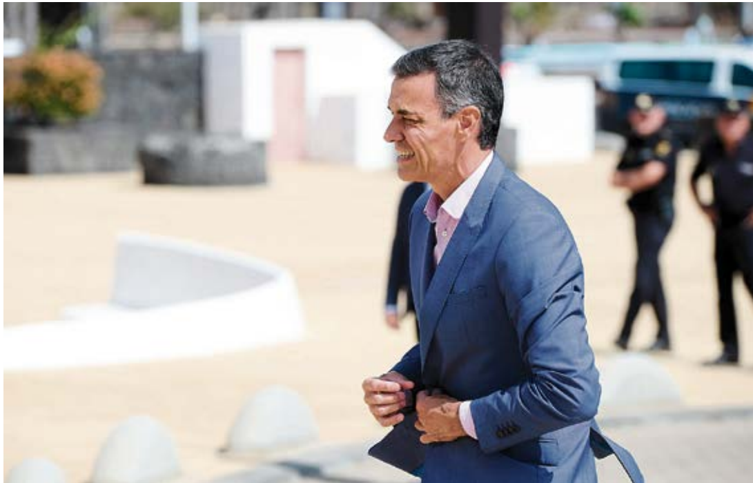
Pedro Sánchez, este mes de agosto, a las puertas del Cabildo de Lanzarote.

El sistema constitucional llamado Estado de las Autonomías fue uno de los objetivos preferidos de la dialéctica política de la Gran Recesión sufrida por España hace década y media. Con razón o sin ella, los propagandistas del momento quisieron eludir las causas profundas de la crisis, esencialmente basadas en la deuda privada y los excesos de un sector financiero voraz de dinero y cemento, y las trasladaron al sistema público, bajo la afirmación de que la solución a la escasez del momento era la supresión de ayuntamientos y diputaciones provinciales, así como resultaba recomendable, decían, una tijera salvaje sobre las competencias autonómicas, en la medida que, se afirmó entonces, “habíamos vivido por encima de nuestras posibilidades”. Todo acabó como es sabido, con un rescate financiero millonario que aún estamos pagando, pero que sirvió para