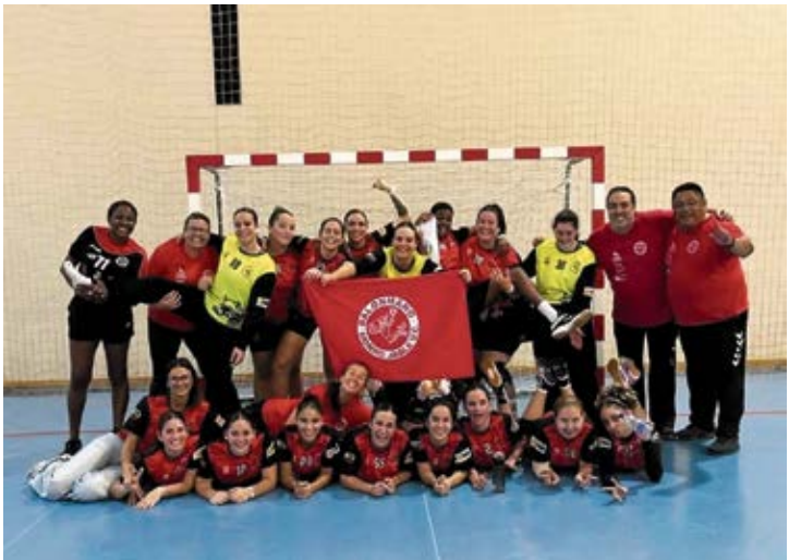
Morro Jable VC.