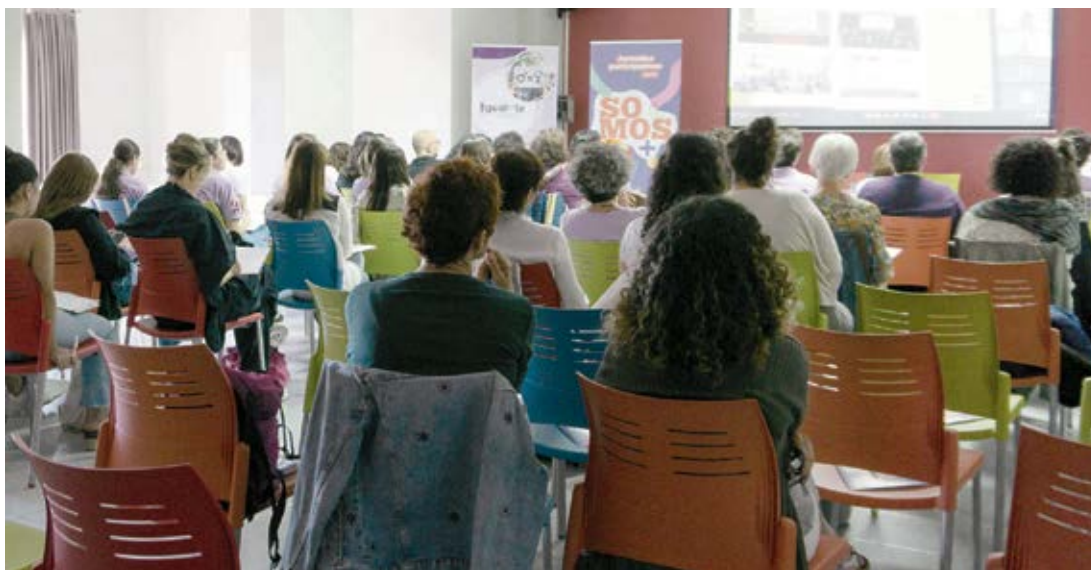
Profesionales de la Igualdad durante las Jornadas ‘Somos+’.