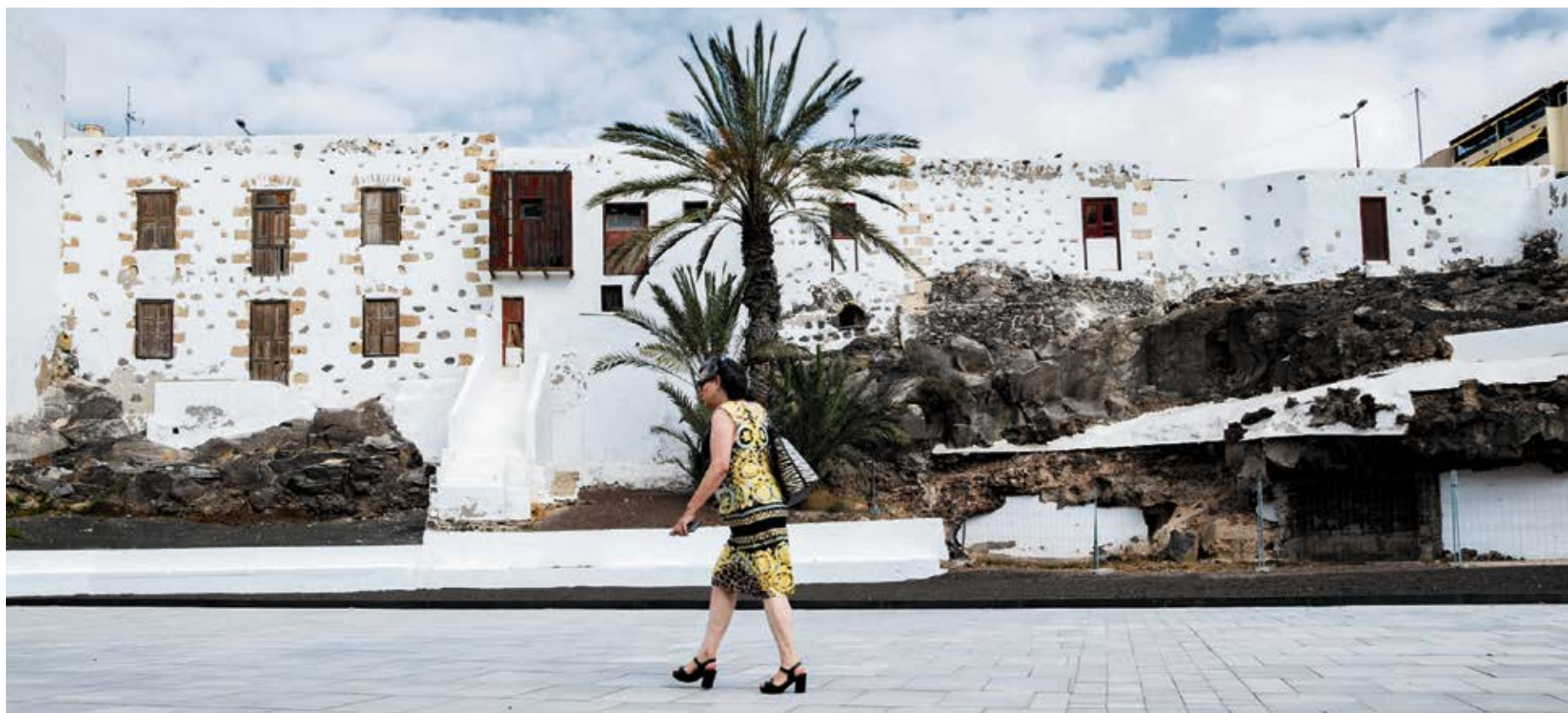
Casas de La Cornisa.