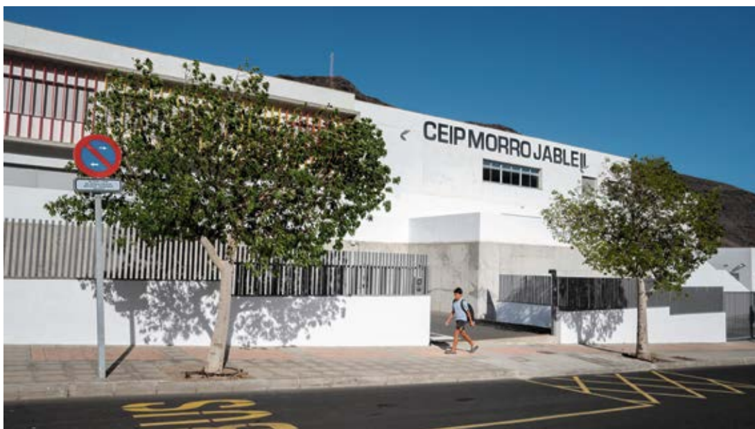
Fachada del CEIP Morro Jable II, el más grande de Canarias.

pietarios. Hemos tenido llevar el asunto a los juzgados”, explica el alcalde. Ahora será la Justicia la que resuelva quién es el dueño.