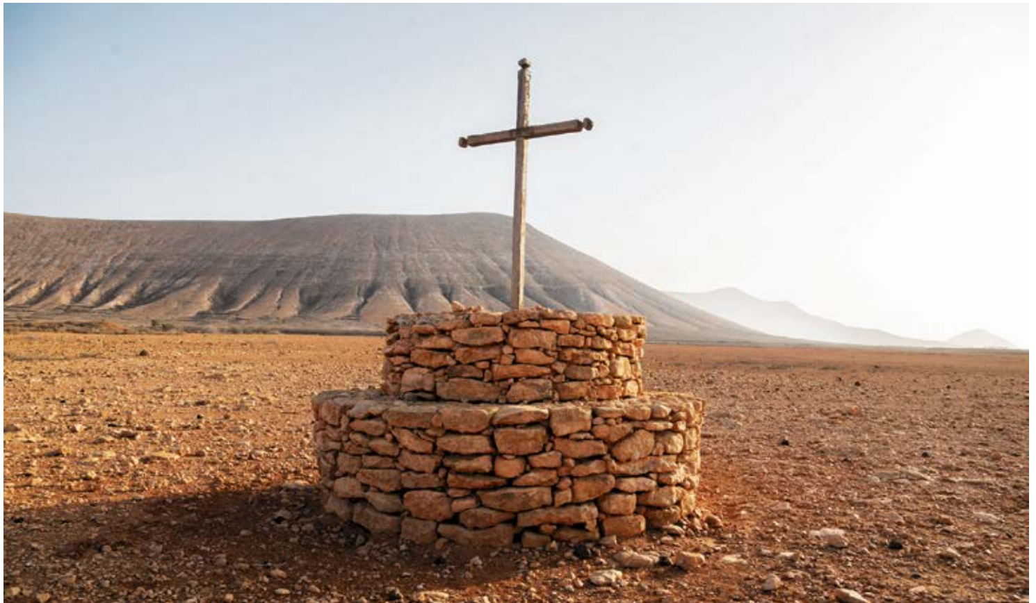
La cruz de Fimbapaire se alza en medio de un llano que impresiona.

El historiador Pedro Carreño también recoge otro suceso que se produjo a mediados del siglo XVII en Vallebrón y que hace referencia a la invasión de ratas que sufrió el pueblo. Los roedores se mostraron tan voraces que terminaban con todo, desde