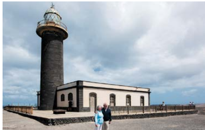
Faro de Jandía.

ro de Puerto del Rosario o faro de Punta Gavioto, que es de los más nuevos, ya que empezó su función en 1991. Un poco más abajo, en el municipio de Tuineje, está el faro de La Entallada, puesto en marcha en 1954, siendo de los últimos en ser construido pensando en albergar torreros, puesto que no mucho más tarde empezaron los primeros procesos de auto-