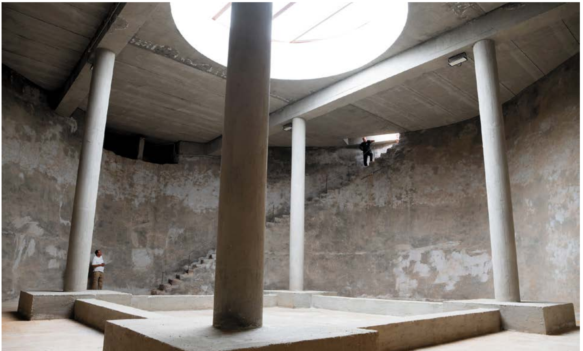
Imagen del interior del Aljibe Redondo, una catedral con columnas y anchos muros.