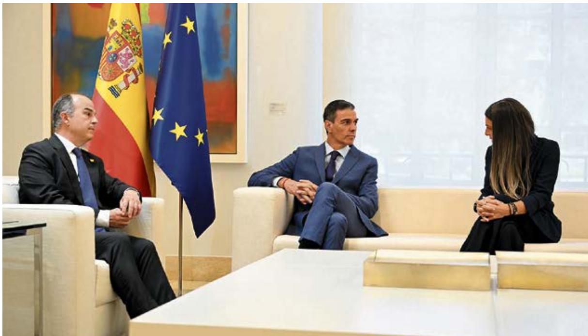
El presidente del Gobierno, Pedro Sánchez, durante su reunión con los representantes del Grupo Parlamentario Junts, Jordi Turull y Miriam Nogueras.

El presidente Sánchez, al que no considero un malvado, pero sí un político con una lectura muy particular de la realidad, debe entregar a la sociedad española esa decisión sobre su futuro, sea el que sea. Otra cosa sería si pudiera sacar adelante sus propuestas legislativas y aplicar las políticas por las que fue elegido por los pelos pese a perder las elecciones. Pero esas condiciones tan precarias ya no se dan y toca