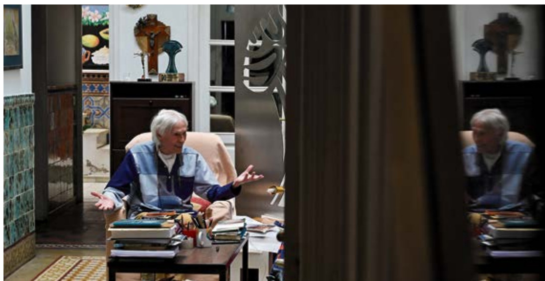
El artista, durante la entrevista con Diario de Fuerteventura.

-Y algo más allá. Yo digo siempre que el arte, si se es fiel, si se tiene voluntad y entrega, siempre paga al final. Creo en trabajar sin pensar en que va o que viene, trabajar solo con el compromiso de crear. Ese es mi legado también para los artistas que viven y que son (y no son) de Fuerteventura, de Canarias, de esta tierra.