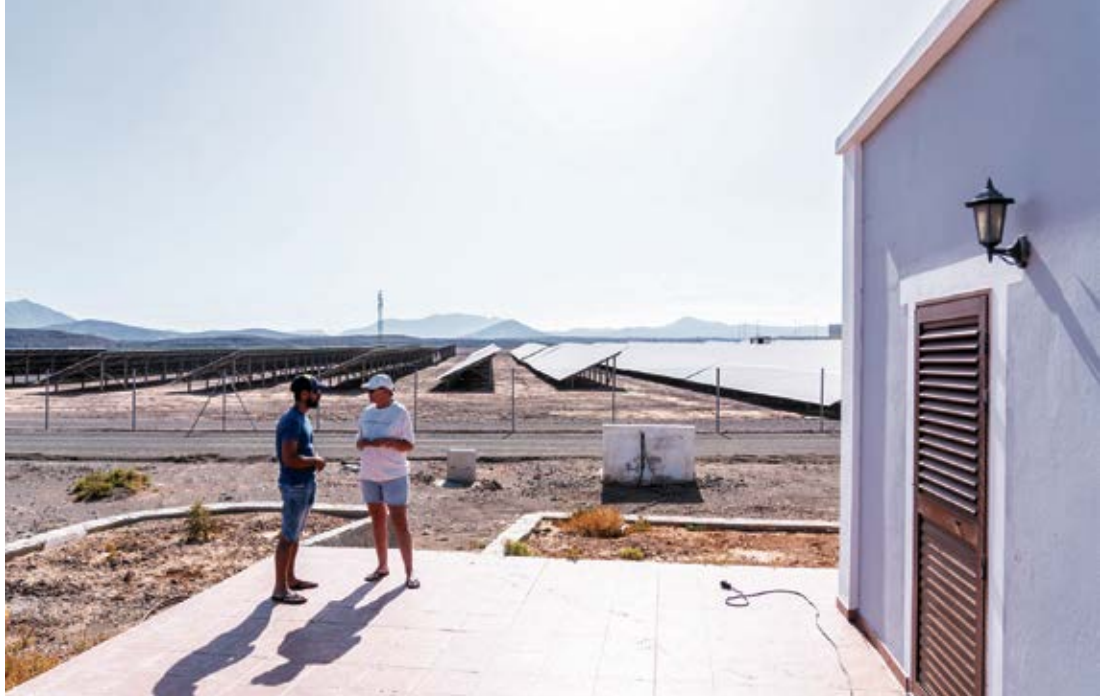
Viviendas en Llanos de La Higuera, a pocos metros del parque fotovoltaico.

Más contundente fue la Dirección General de Ordenación del Territorio y Aguas, al recordar que según la Ley del Suelo de Canarias no se permiten actuaciones que desfiguren el paisaje o limiten la visión de espacios abiertos. Son directrices generales de la Ley del Suelo