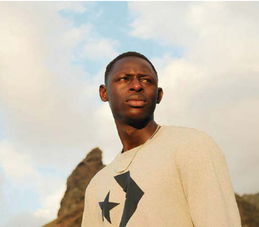
Elhadji es uno de los tres protagonistas de esta película.

livia, hasta terminar en Argentina: “Yo trabajaba, reunía 50 bolívares y los mandaba a mi familia”.