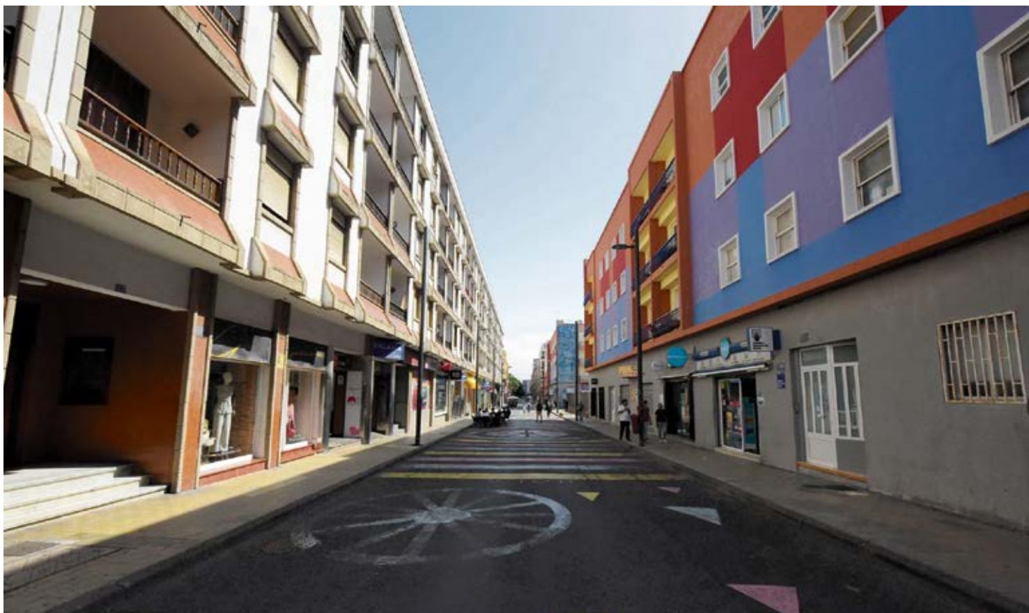
Zona de universitarios en La Laguna, en la calle Heraclio Sánchez.

En ciudades como San Cristóbal de La Laguna apenas se encuentran pisos y los que hay están a precios desorbitados