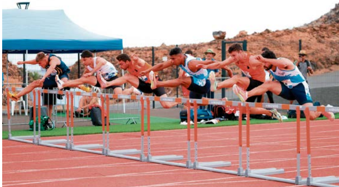
Prueba de carrera de vallas.

El Centro Insular de Atletismo acogió el Campeonato de España de Pruebas Combinadas