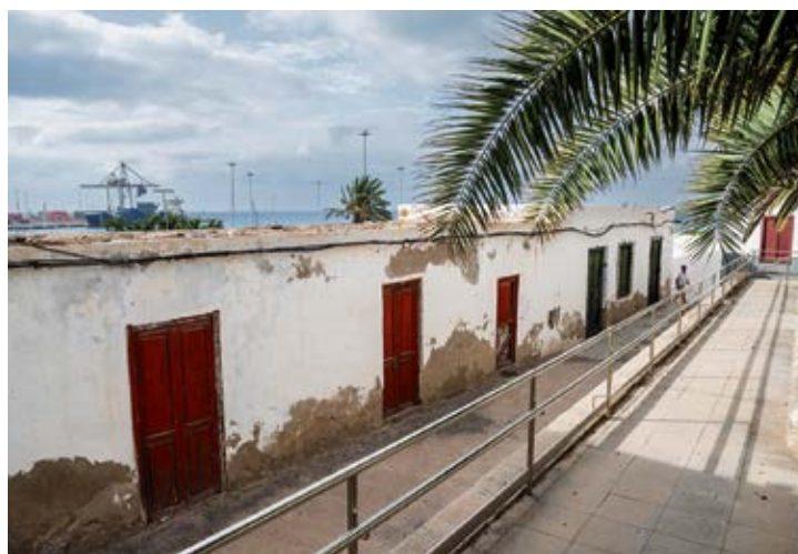
Viviendas de la calle Fernández Castañeyra.

“Aún estéticamente visual, naturaleza y patrimonio arquitectónico en armonía”