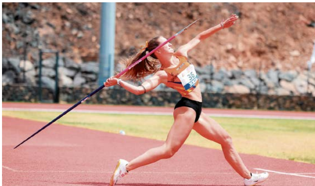
Lanzamiento de jabalina.