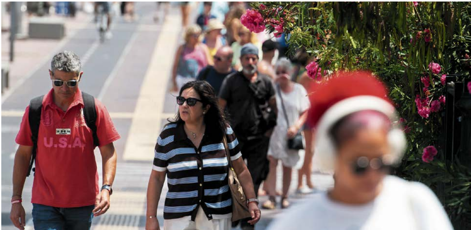
Residentes y turistas en la localidad de Corralejo.