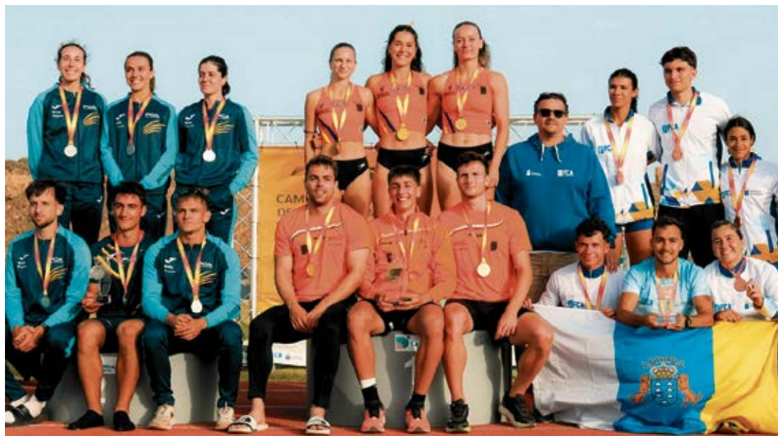
Pódium final de la competición.

de Atletismo de Fuerteventura, ubicado en la localidad de Corralejo, en el municipio de La Oliva. Una instalación muy demandada por los cuatro clubes de atletismo de la Isla y que en la actualidad aglutinan más de 500 licencias federativas. Unos números que demuestran el potencial del atletismo mayorero, formando a jóvenes valores en este deporte.