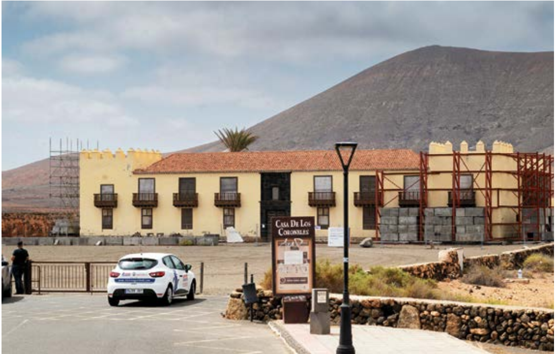
Situación actual de la Casa de los Coroneles, en La Oliva.

-Lo decimos también en el proyecto. En la casa se hicieron muchas cosas erróneas: un teja-