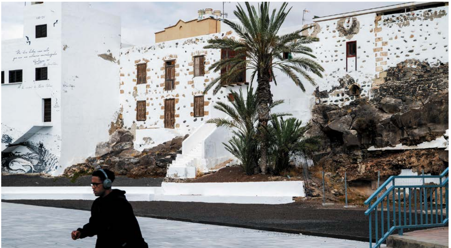
Zona de La Cornisa desde la avenida marítima.