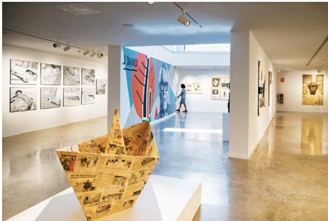
Pieza de barco de papel, perteneciente a la instalación 'Tragedias Atlánticas'.

Junto a Héroes muertos , completan las aportaciones de la se-