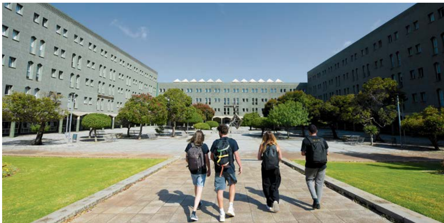
Estudiantes en el Campus de Guajara de La Laguna.

Decenas de majoreros cruzarán el próximo curso el estrecho