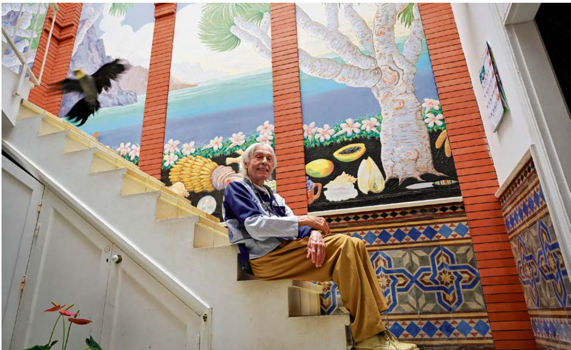
El artista, en su casa de La Isleta (Gran Canaria).