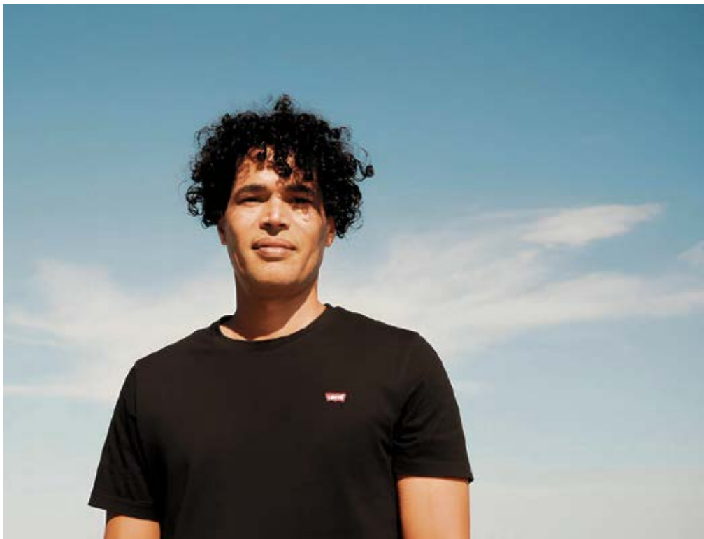
Lamhir, en un pasaje del documental.