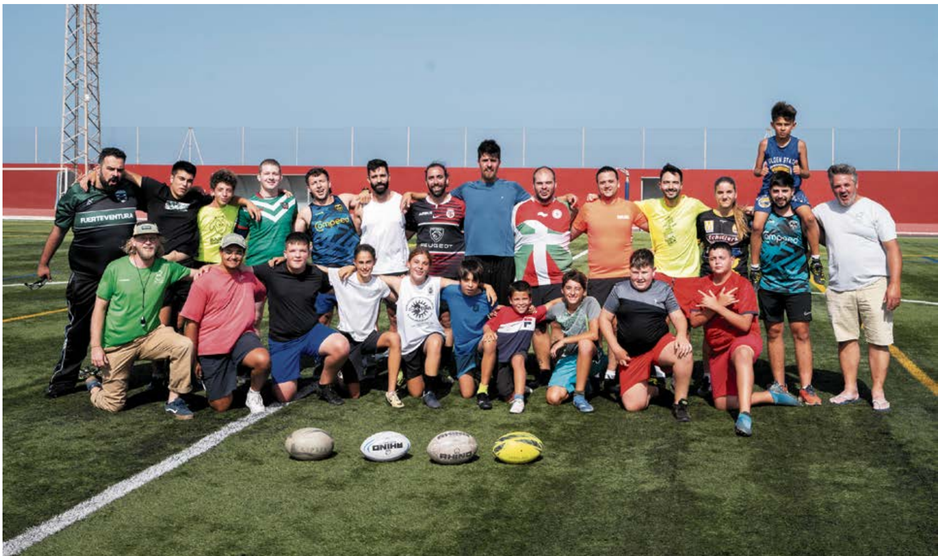
Club de Rugby Mahoh, campeón de Canarias.