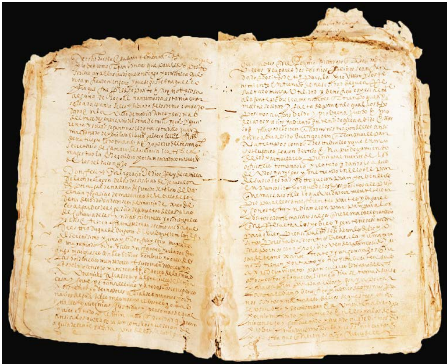
Libro de cuentas de El Pósito.

El fondo Betancuria custodia los documentos más antiguos de la Isla, entre ellos un libro de cuentas de El Pósito de 1599