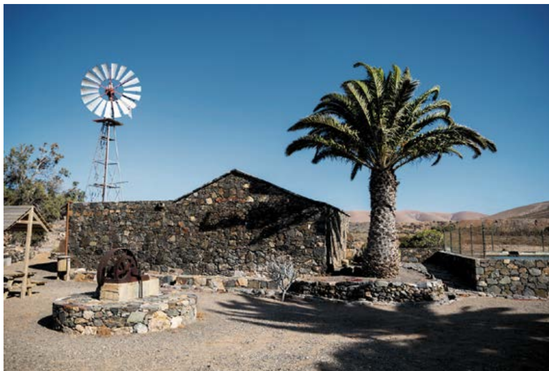
Tenería de Mesque.