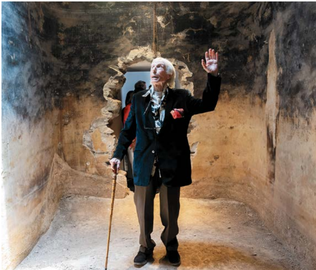
El artista, en la aljibe del centro.

El Espacio de las Artes Pepe Dámaso reúne en una colección permanente la mirada de una de las voces clave de la vanguardia y contemporaneidad canaria