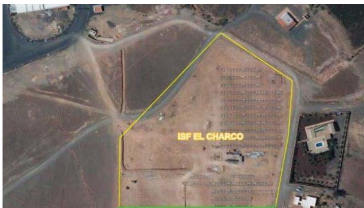
Parque Solar El Charco, muy cerca de las viviendas.

Mientras tanto, como le ha ocurrido a los vecinos de los Llanos de La Higuera -que ya se están planteando acciones legales-, y seguramente le ocurra a más residentes, la proliferación o no de este tipo de proyectos seguirá en manos de las compañías, y de políticos y técnicos que, sin unos criterios unitarios, decidan darles cobertura.