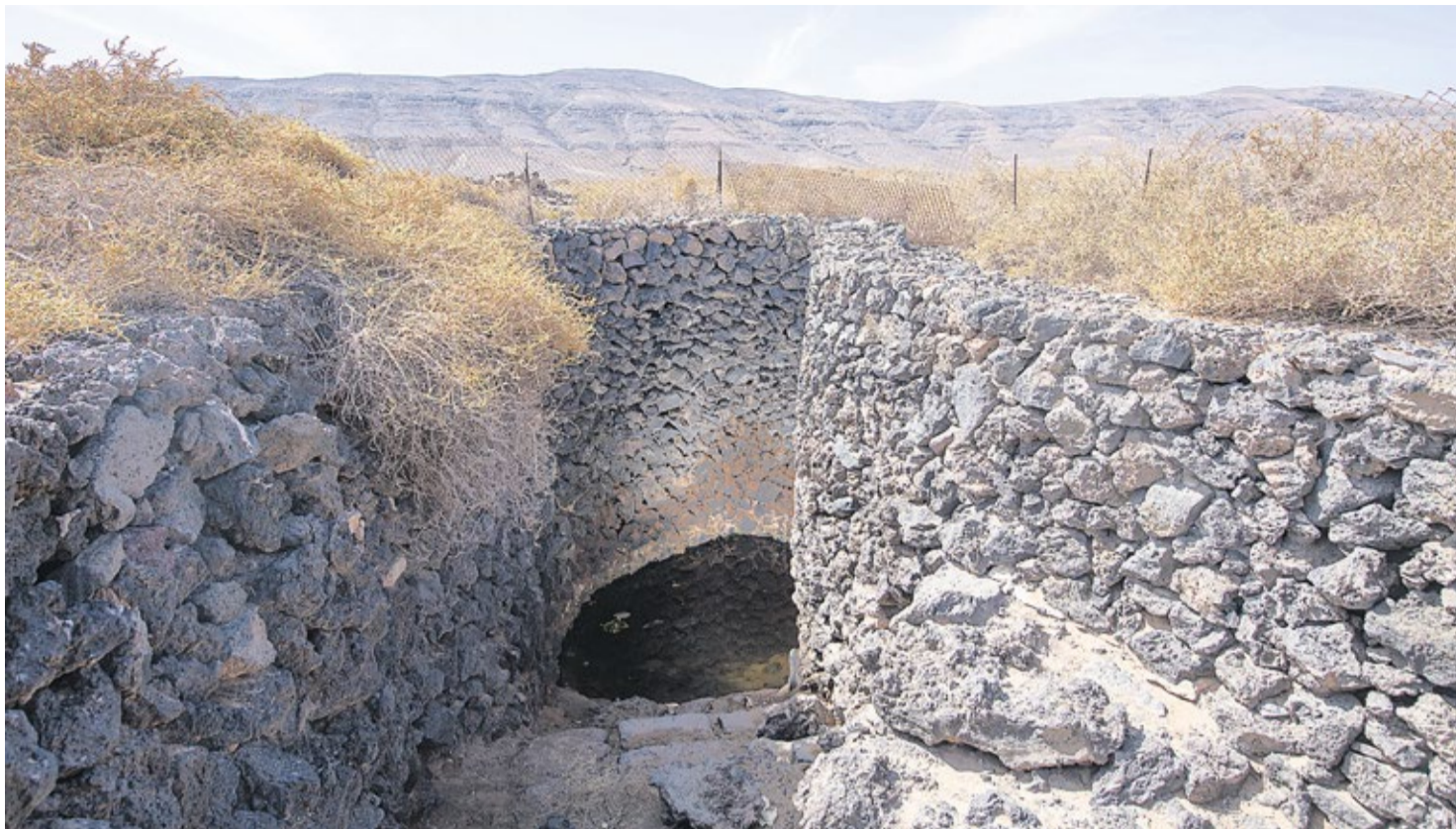
Pozo con escalera, identificado como el que podría dar nombre a la localidad de Pozo Negro.

Al lado de las ruinas del convento, continúa en pie la iglesia conventual. En los últimos años, se han ido sumando voces que piden a gritos una actuación urgente que garantice la conservación del edificio. Hace un tiempo, la Diócesis de Canarias y el Cabildo de Fuerteventura llegaron a un acuerdo