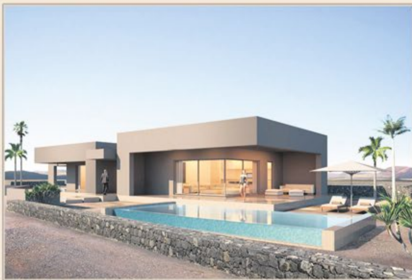
LAJARES - VILLA 2