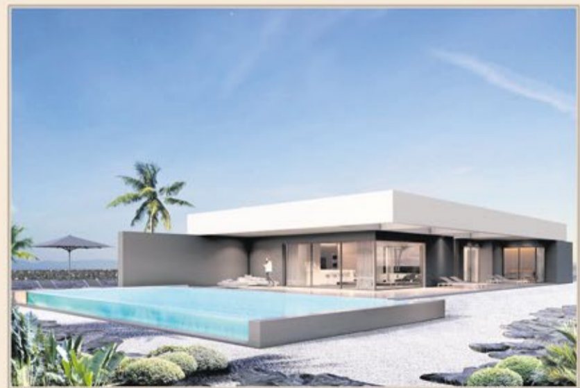
LAJARES - VILLA 3