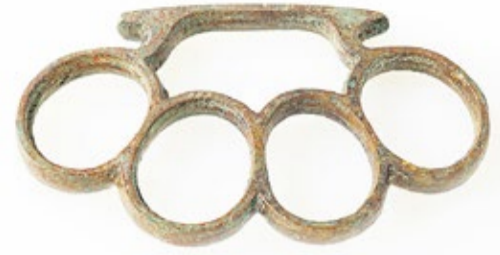
Restos metálicos encontrados en el yacimiento de Rosita del Vicario y depositados en el Museo Arqueológico de Fuerteventura.

hermanos Serra Rafols “gracias a la existencia de unos documentos de la Inquisición fechados en 1505. Los textos indican que ya en esa fecha hay un comercio muy fluido en Pozo Negro. En la documentación, también se cita la fuente”.