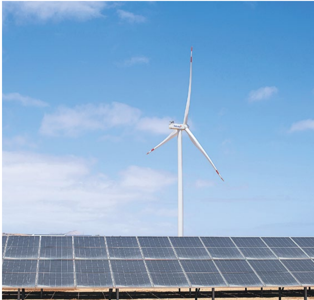
Una planta fotovoltaica instalada en el municipio de Puerto del Rosario.

Batería de imposiciones. El 5 de junio, el Cabildo recibe la orden que declaraba el interés general del proyecto de planta fotovoltaica denominada Llanos del Dinero II, de dos megavatios, en el municipio de Antigua. Tres días después llega otra orden del entonces consejero de Transición Ecológica del Gobierno de Canarias para lo mismo: declarar de interés general la planta de energía solar El Charco II, en el municipio de Tuineje, también de dos megavatios. El 15 de junio, entra en el Cabildo mayorero otra declaración de interés general, la de la planta fotovoltaica El Charco IV, en Tuineje, de un