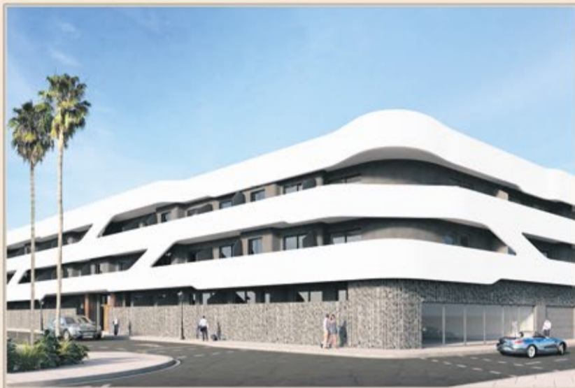
CORRALEJO - VIVIENDAS