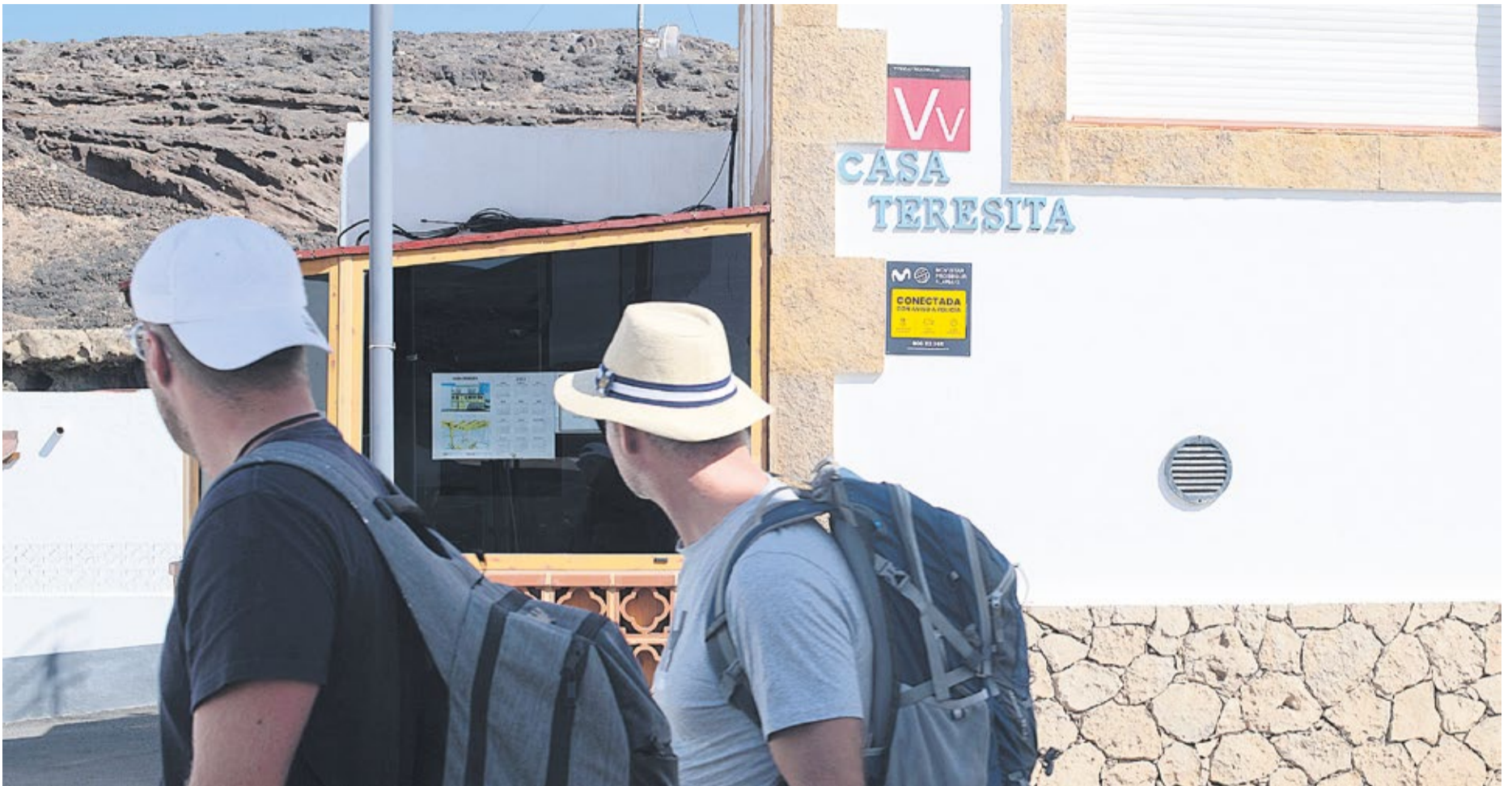
Unos turistas transitan ante una vivienda vacacional.