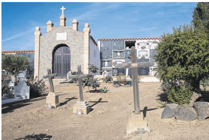
Cementerio de Betancuria.

El Puerto de Arrecife ha tenido varios cementerios. El actual, el de San Román, tiene poco más de 50 años, porque previamente tuvo otras localizaciones. El primero estuvo en la ermita de San Ginés, a la ribera de la gran laguna salada del mismo nombre, pero con la ley de Carlos III se pasa a extramuros, a un solar que viene a ser en el que desde hace más de 75 años se encuentra el Instituto de Enseñanza Secundaria Agustín Espinosa. No obstante, con el crecimiento que vive Arrecife esta nueva ubicación pronto queda intramuros de la joven ciudad, con lo cual se decide de nuevo cambiar la localización, dándole un aire más marino, como no podía ser de otra manera para un enclave de raigambre tan pesquera como la capital de Lanzarote en sus primeros siglos.