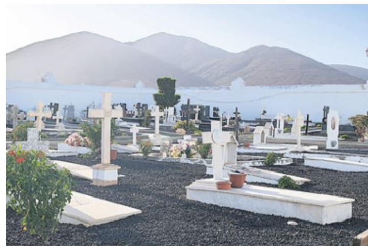
Cementerio de Tuineje.

Uno de las necrópolis de estampa más romántica, en cuanto a exaltación de la naturaleza y el exotismo, es el de Cofete. Esta localidad tiene una historia bastante singular puesto que fue un núcleo con cierta relevancia durante el siglo XIX pero luego entró en una decadencia que casi le hizo desaparecer. Dada su le-