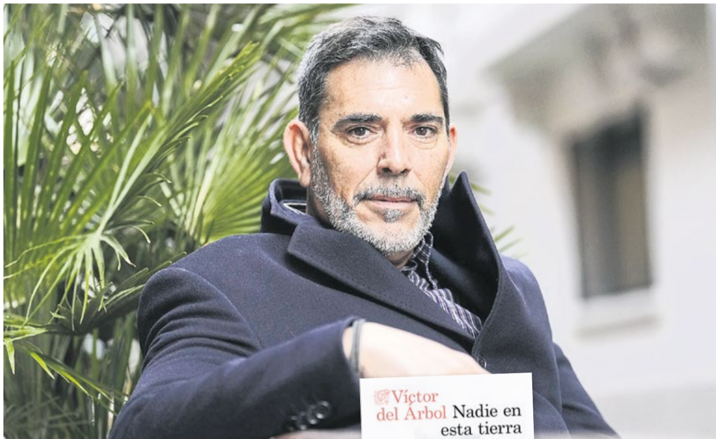
Víctor del Árbol estará en la Feria del Libro.

estos psicópatas americanos que es muy gris e inteligente y que va matando gente porque está enfermo. Él, por el contrario, es una persona que asume su condición, esa rigidez y crueldad y, poco a poco, vemos como en la novela se van matizando. Creo que las categorías absolutas no existen. Esas categorías del bien y del mal absoluto tienen más que ver con las ideas que con la realidad. Al final acabamos viendo a un hombre que en cierto sentido es la otra cara de la luna de Julián Leal, es como su antagonista pero al mismo tiempo es un reflejo.