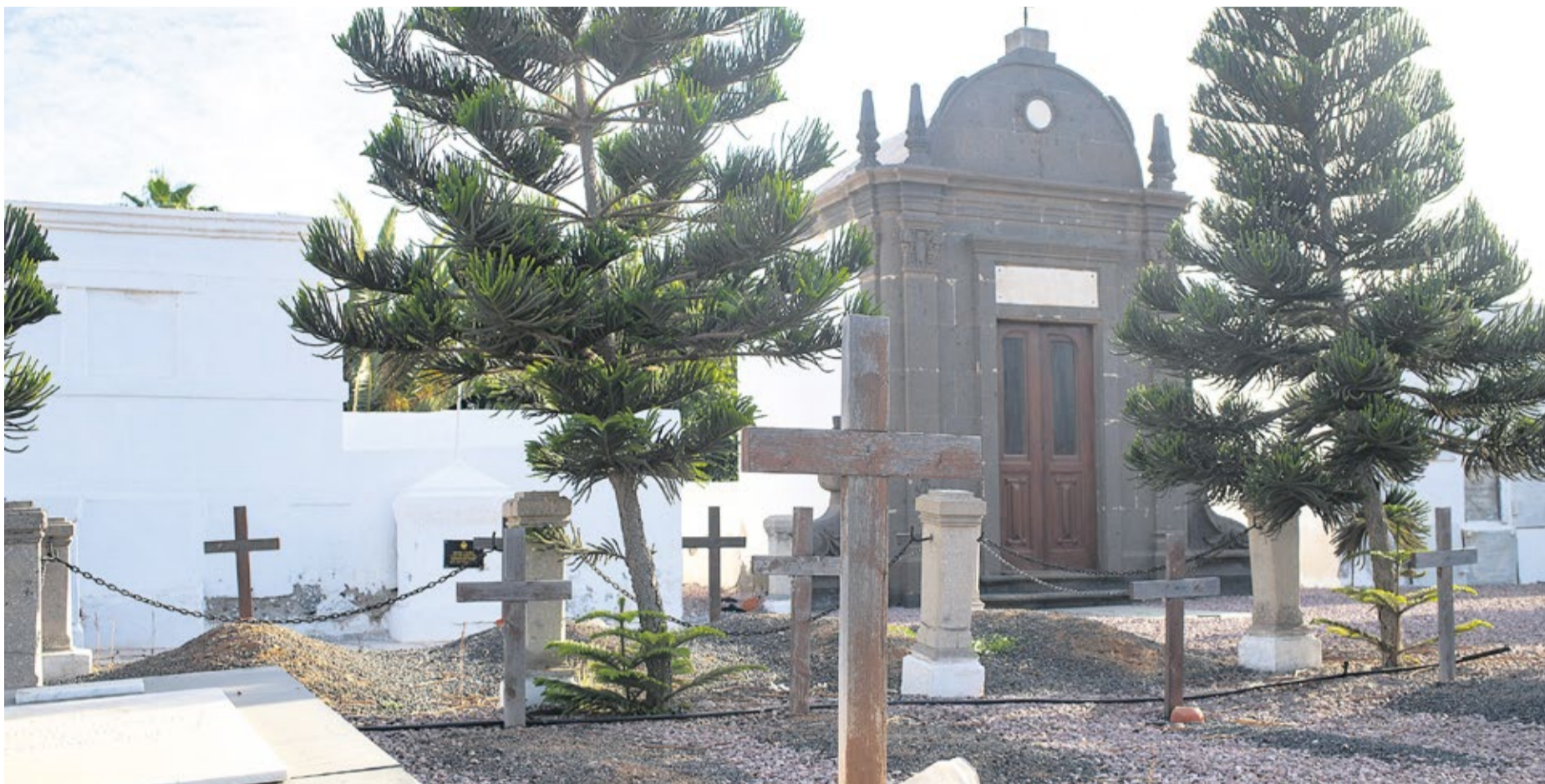
Cementerio viejo de Puerto del Rosario.