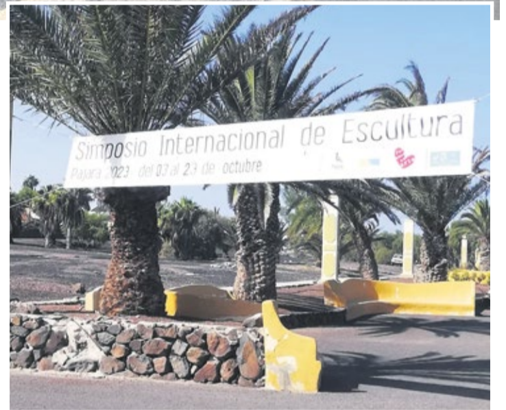
Cartel del Simposio de escultura en una zona deteriorada.

“Desde el gobierno de Pájara se ha puesto sobre la mesa la necesidad de aprovechar nuestro sector turístico para vincularlo a la cultura, la economía, la historia y la escultura, embelleciendo nuestros entornos gracias a las obras de este simposio”, afirmó el alcalde en la presentación. La respuesta del colectivo vecinal es rotunda: “Nos oponemos firmemente al despilfarro de dinero público y exigimos que se prioricen los derechos básicos de los ciudadanos”. La asociación ha aprovechado para exigir a los repre-