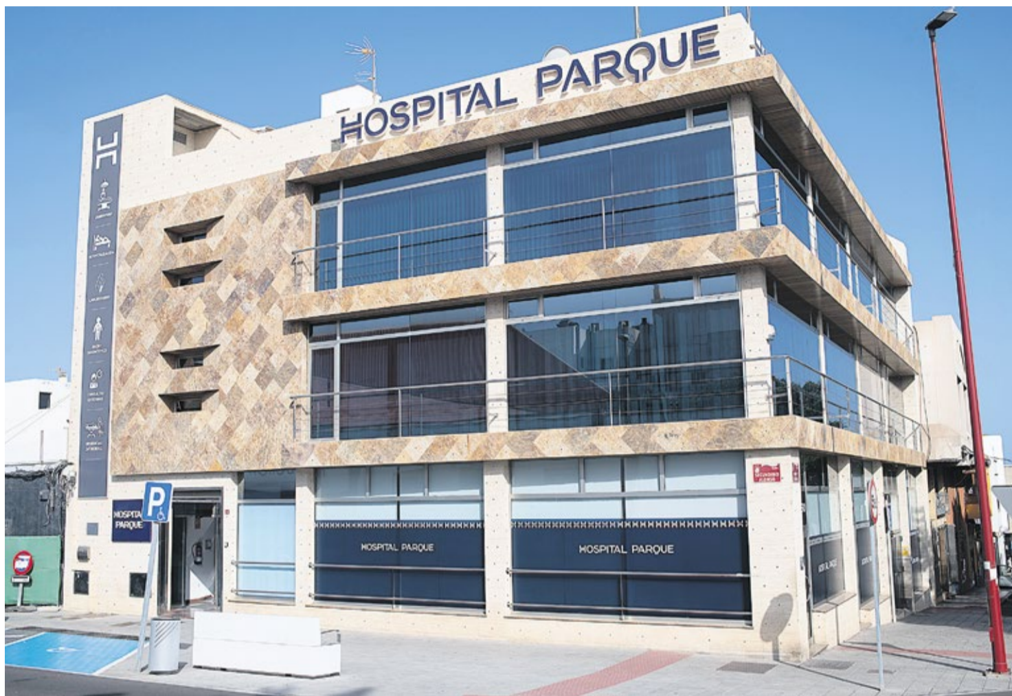
Fachada de Hospital Parque Fuerteventura en Puerto del Rosario.

Por su parte, la prueba de electromiograma se solicita en pacientes que presentan adormecimiento en extremidades superiores o inferiores, dolor en zona cervical o lumbosacra, en relación a patologías en nervio periférico o en columna vertebral por parte de los especialistas de traumatología, neurocirugía, unidad del dolor, anestesiología, cirugía vascular, medicina interna, medicina intensiva, neurología, medicina