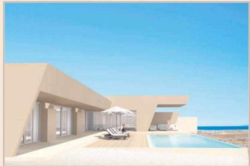
CORRALEJO - VILLA 1