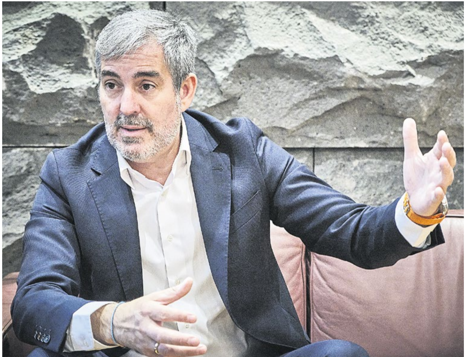
El presidente del Gobierno, durante la entrevista con Diario de Lanzarote y Diario de Fuerteventura.

-¿Cuánto dinero del Presupuesto estatal de 2023 no ha sido transferido por el Gobierno central a Canarias? Porque hay