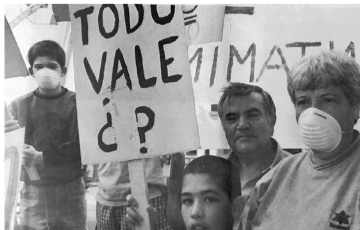
Protesta contra la cantera de basalto.

acuerdo, el burro dio una coz, los tunos salieron volando por el suelo, ya no se podían vender y nos hartamos, comí más tunos que en toda mi vida”, relata Consuelo. “Si había higos, moras o granadas era una fiesta en