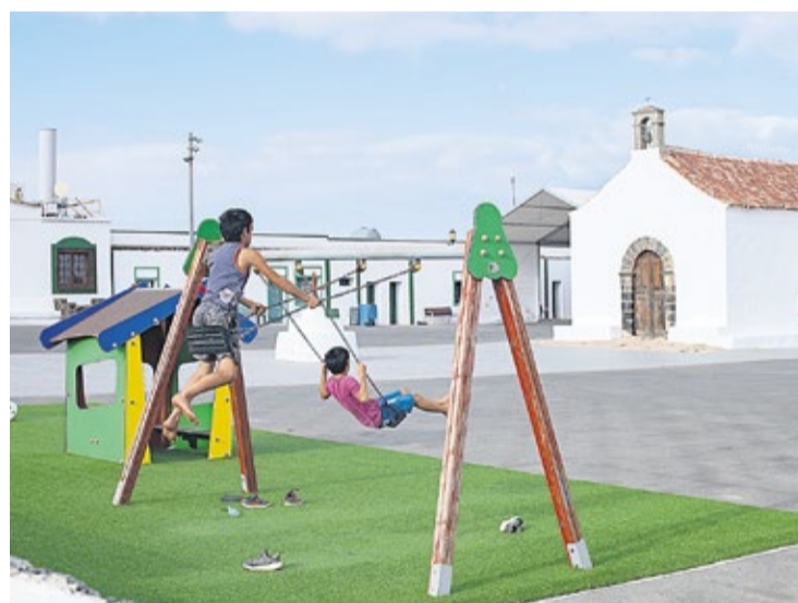
Infraestructuras de recreo en la localidad, donde los vecinos piden mejoras.