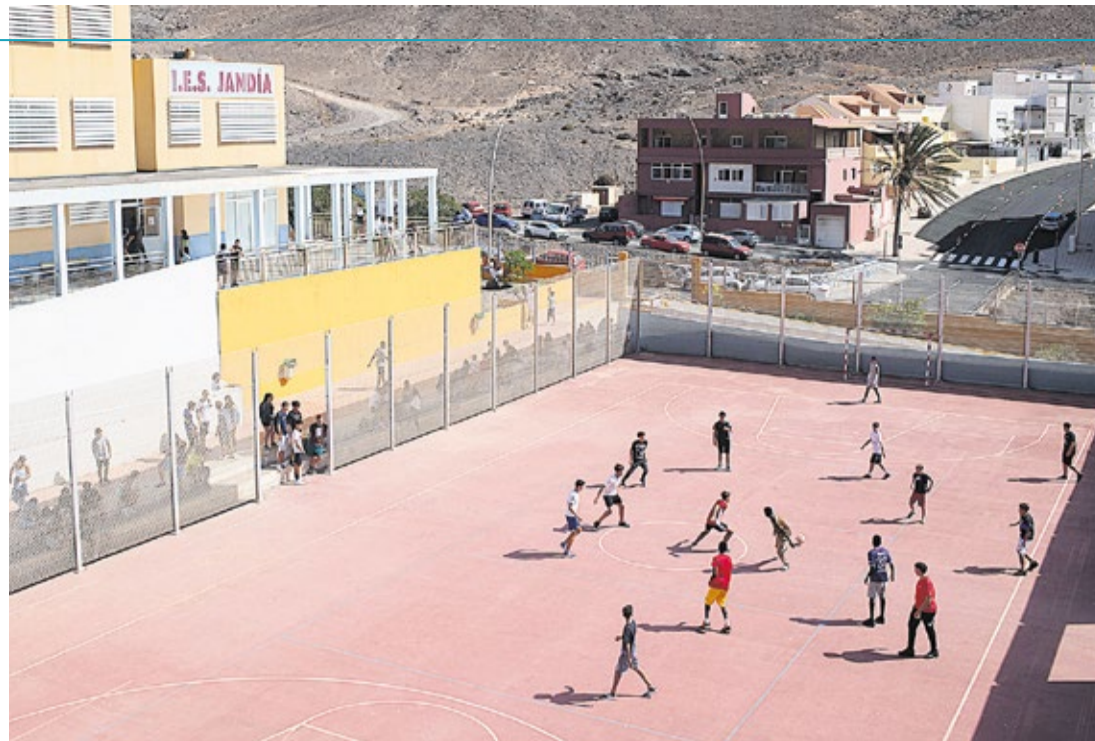
Alumnos en la cancha deportiva del IES Jandía.

Los padres describen que la localidad de Morro Jable tiene connotaciones especiales, no goza de bibliotecas ni locales culturales como cualquier otra ciudad, por lo que los centros educativos se convierten en espacios esenciales. “De momento hemos conseguido que se abra el centro por las tardes, ofrecer clases de apoyo, trabajar en la formación de padres, pro-