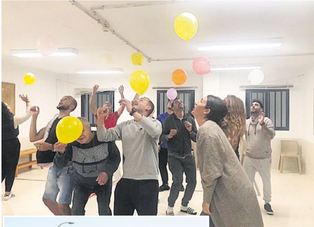
Un momento del taller en la cárcel.

Unos 150 internos del centro penitenciario de Tahíche, donde el 40% procede de Fuerteventura, asisten a un taller de risoterapia, una forma de tratar la salud mental