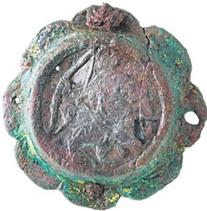
Hallazgo metálico encontrado en el yacimiento de Rosita del Vicario.

para llevar a cabo un proyecto integral de consolidación, restauración, excavación y puesta en visita. Se realizaron algunas actuaciones, pero la mayor parte de las ideas quedaron sobre el papel.