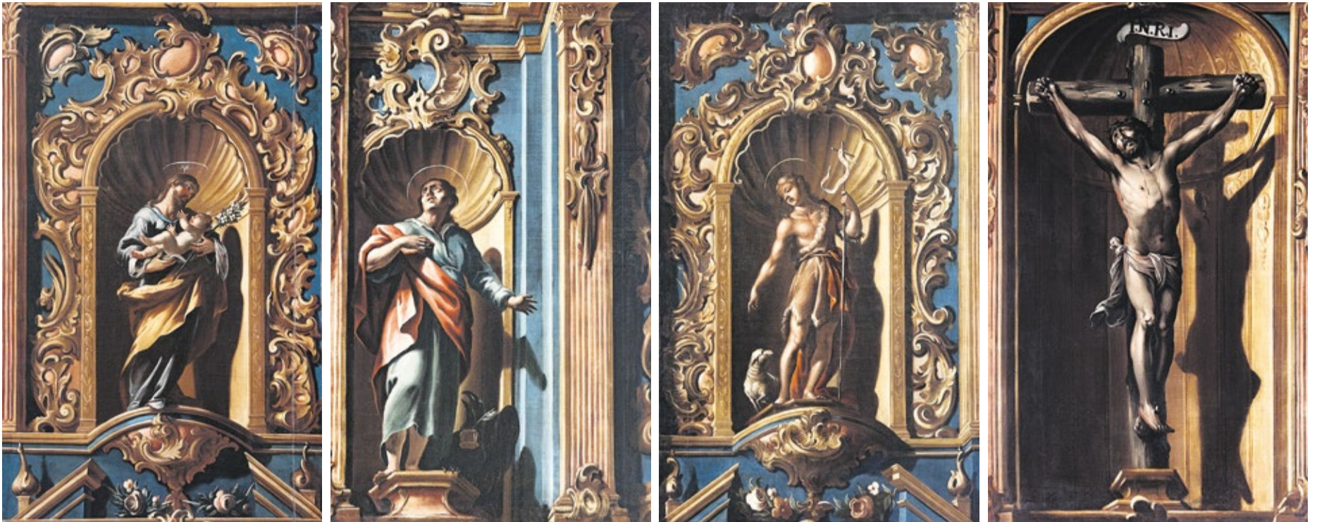
Detalles de San José y el niño, San Juan Evangelista, San Juan Bautista y Cristo Crucificado, en el políptico de Juan de Miranda de La Oliva.