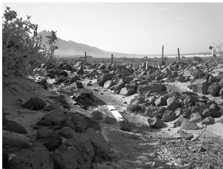
Fotografía de Günter Kunkel del cementerio de Cofete en 1964. Cedida por el Archivo de fotografía histórica de Canarias, Cabildo de Gran Canaria-Fedac.

Dada la pobreza de ambas islas, la arquitectura de los camposantos era muy modesta, además de que la escasez de población tampoco requería grandes instalaciones. En la mayoría de los casos se trataba de unos modestos muros de piedra y barro albeados y, si acaso, ornamentados con almenas o barbancas, que se remataban con una puerta de entrada un poco más destacada, que podía llevar algún frontón, arco, cruces cristianas o decoración geométrica. En el interior se podían colocar, o no,