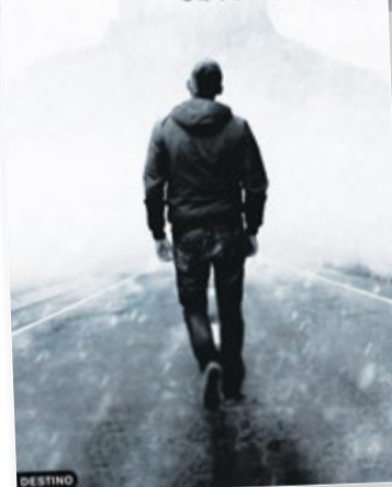
Portada de 'Nadie en esta tierra'.

iba un poco en esta línea porque últimamente además estaba entrando también en la novela más intimista, en la novela histórica. Era un tipo que tenía una cultura increíble, que no era la cultura del púlpito sino la cultura del autodidacta, de la gente de la calle que aprende a través de la experiencia. Conectábamos muy bien y además era una persona