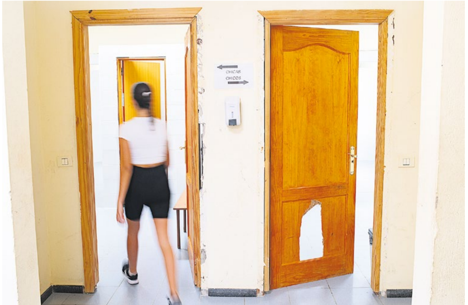
Puertas de acceso a los baños que muestran la precaria situación del centro.