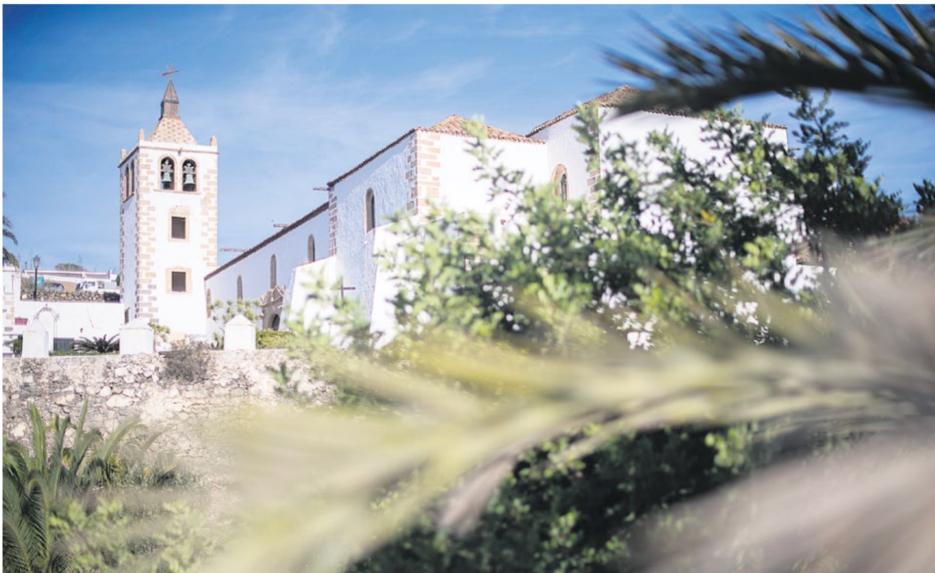
Iglesia de Santa María de Betancuría.