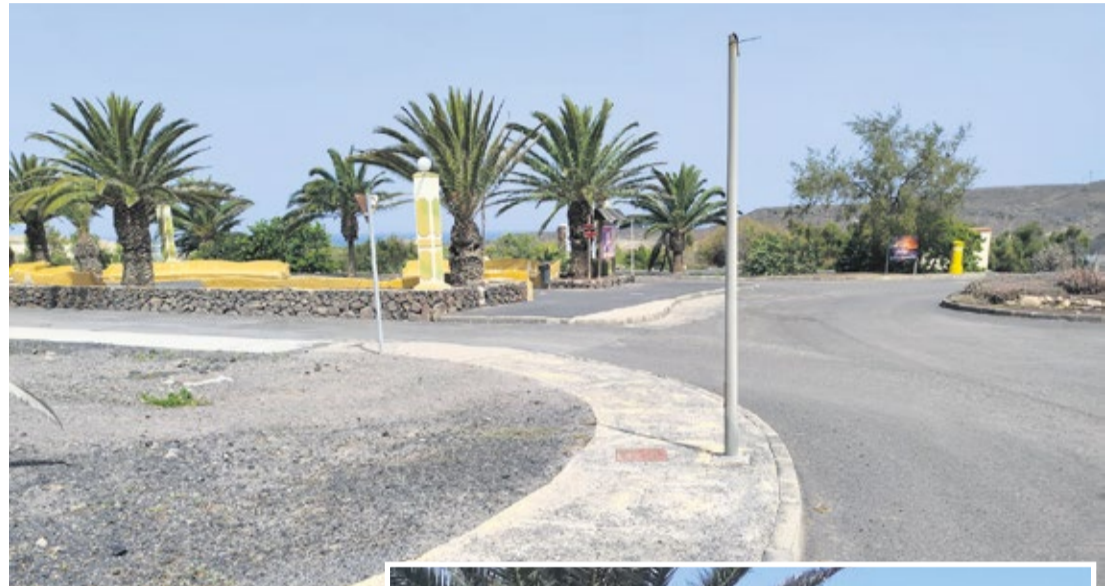
Estado de abandono de la urbanización.

Los residentes reclaman que “de manera urgente se les proporcionen los servicios básicos municipales, que son obligatorios”. “En La Pared no tenemos aceras, ni asfaltado en condiciones, ni farolas y las palmeras se están muriendo, pero ahora contamos con unas esculturas seguramente carísimas”, ironizan los vecinos. El dete-