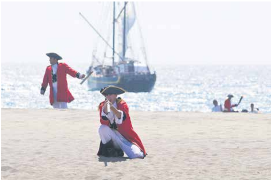
Recreación de la Batalla de Tamasite.