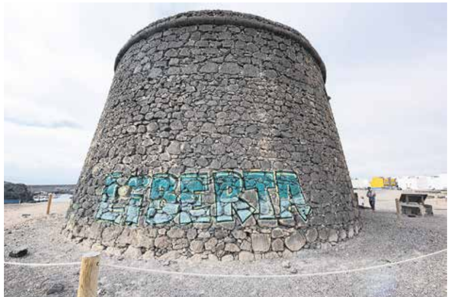
Torre del Tostón, en El Cotillo, que fue objeto de un acto vandálico recientemente.

da huella, como el que supuestamente tuvo en el siglo XIV Lanceloto Malocello, navegante italiano de cuyo nombre deriva el de Lanzarote. También hay sospechas de que en las zonas de Rubicón y Betancuria existieron pequeñas fortificaciones que fueron derribadas.