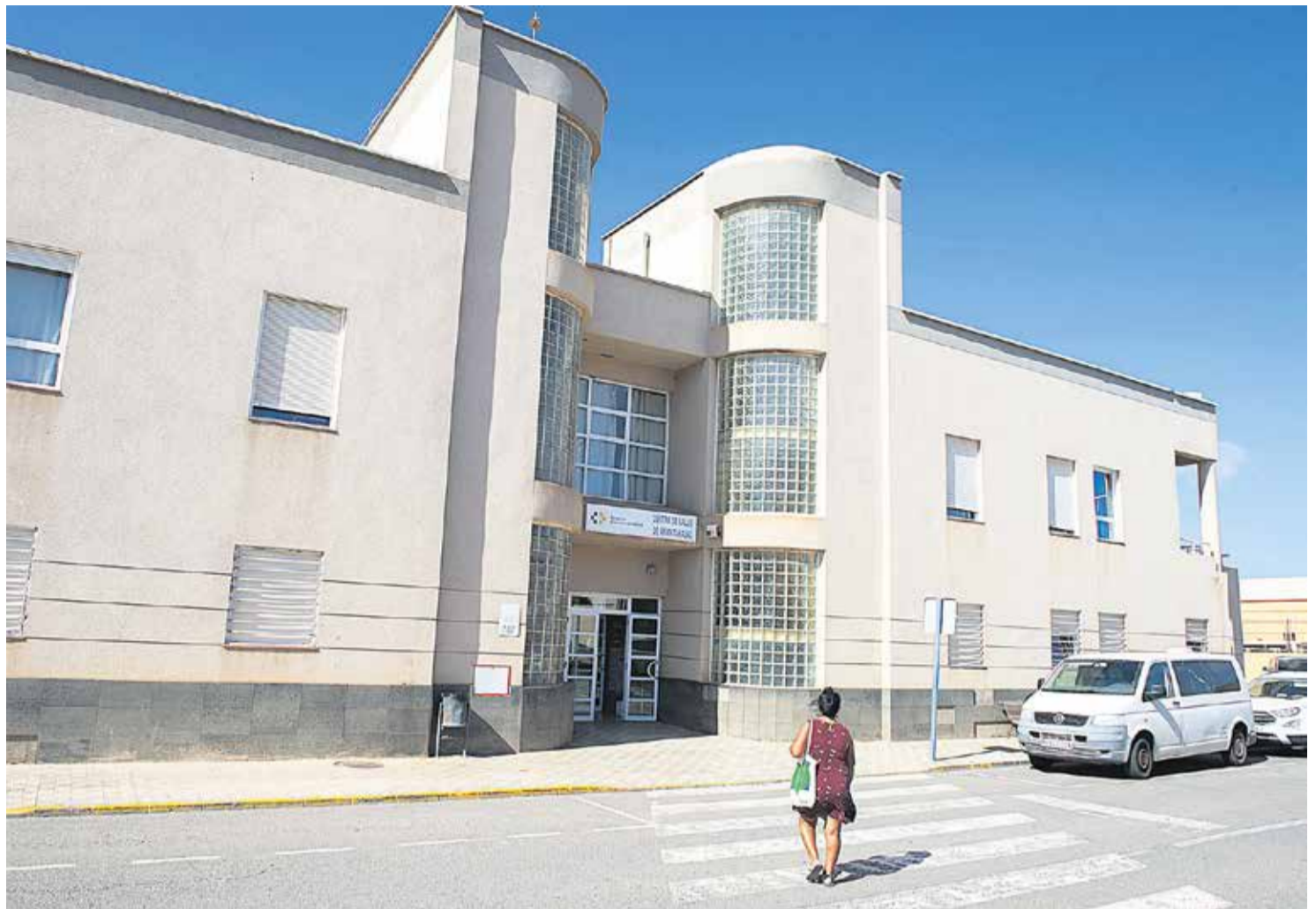
Centro de Salud de Gran Tarajal.

Estos planes, detalla el doctor Ramírez, están dirigidos a elevar la cantidad y calidad de los servicios para todos los usuarios, con la implantación de los servicios de radiografía, ecografía y analítica. La idea es que haya personal preparado y