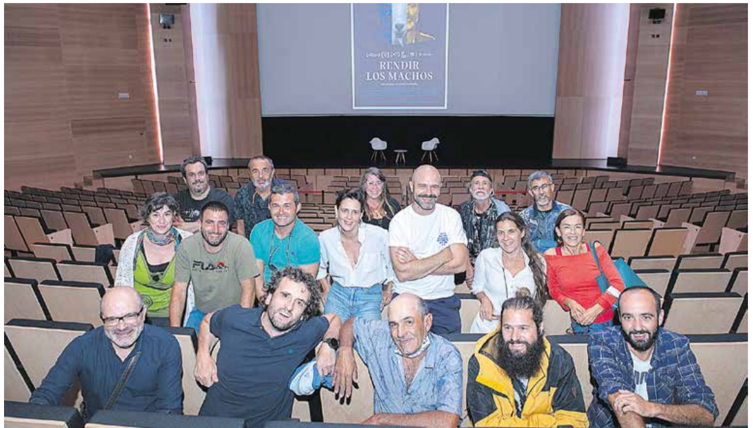
Pantaleón y parte del equipo participante en la película, durante el preestreno en Fuerteventura.

Entre los ingredientes que señala el director, el paisaje de la Isla, indica, permitía una mayor conexión con el concepto subyacente en toda la obra: “Unos