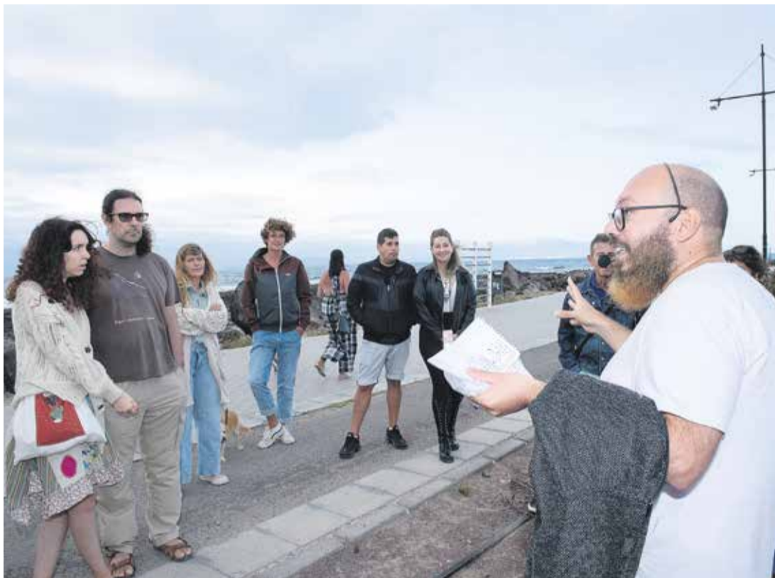
Ruta cultural de Diego Flores.

En sus rutas, Diego Flores relata la vida de las hechiceras en las Islas y revive los viajes del corsario Amaro Pargo