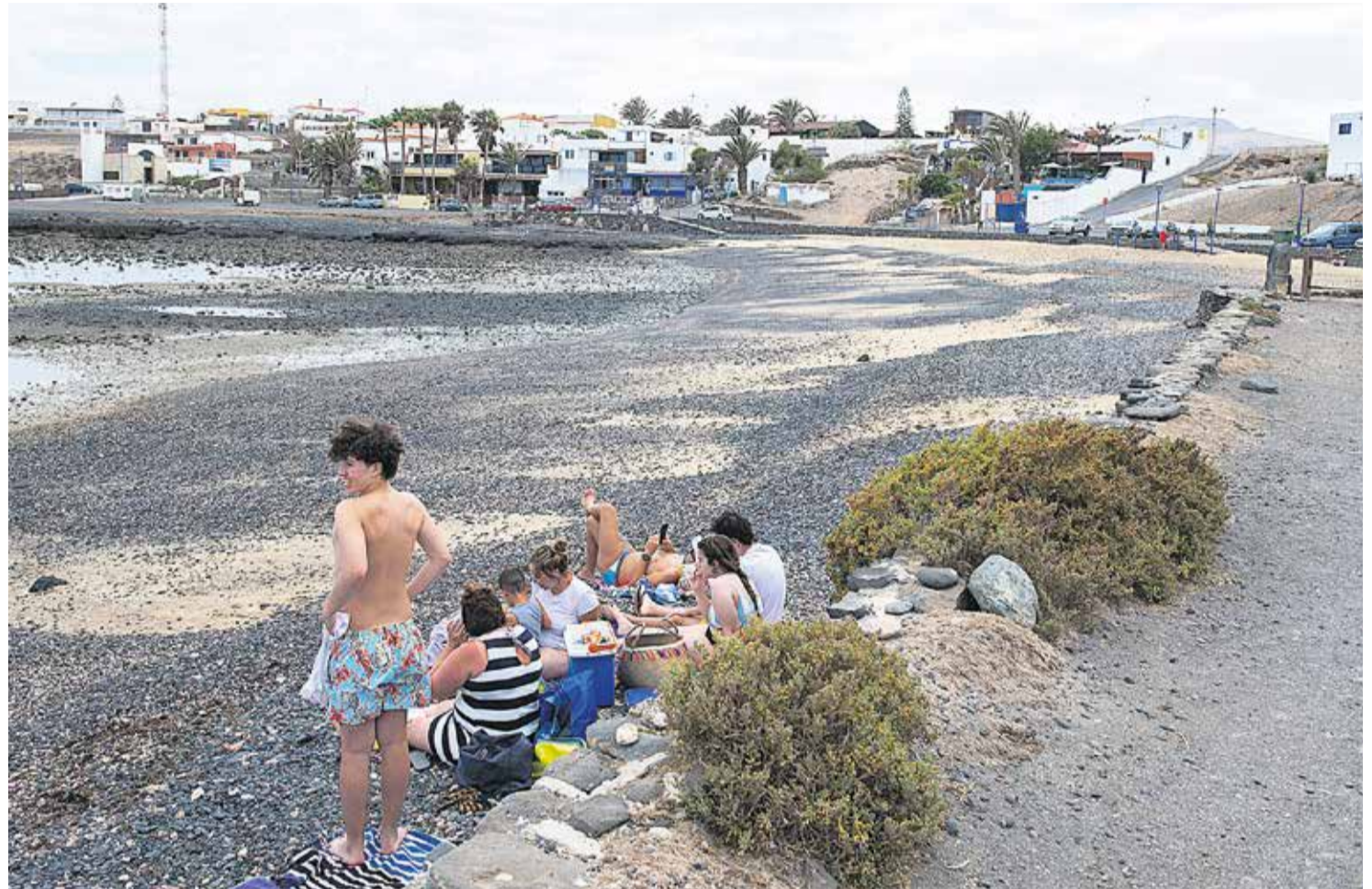
Estampa playera en Las Salinas del Carmen.

Los residentes denuncian el “abandono” de la localidad, que necesita reformas en las calles, una parada de guaguas y actividades para los pequeños