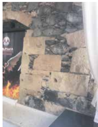
Imágenes del interior del inmueble histórico.