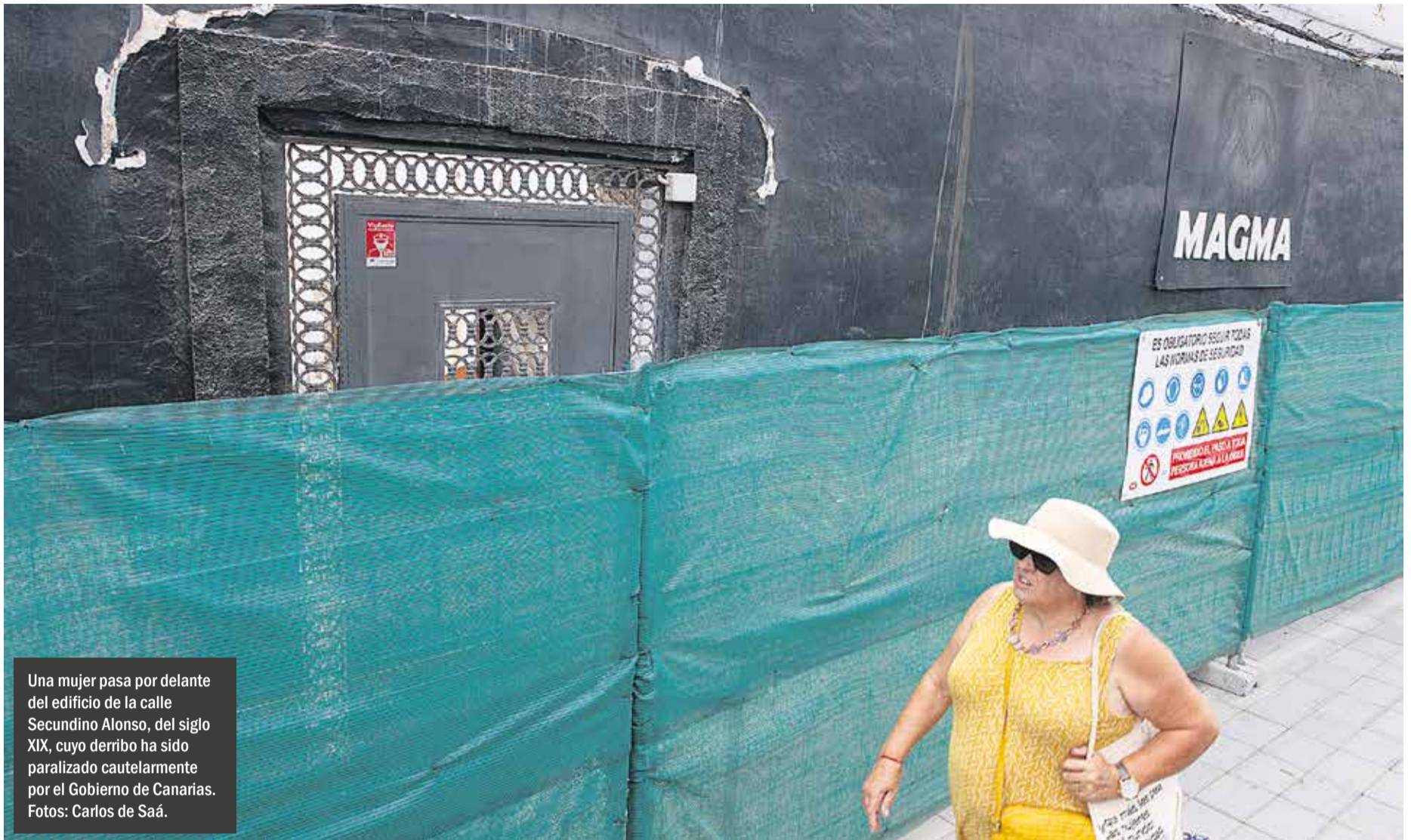
Una mujer pasa por delante del edificio de la calle Secundino Alonso, del siglo XIX, cuyo derribo ha sido paralizado cautelarmente por el Gobierno de Canarias.