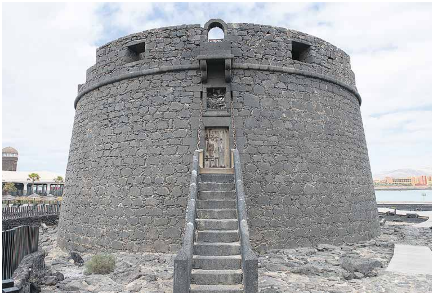
Torre de San Buenaventura, en Caleta de Fustes.

La costa era sinónimo de peligro, llegando a existir la profesión del atalaya o atalayero, un hombre diligente y de confian-