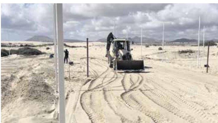
Pala mecánica en las Dunas de Corralejo.

En su demanda, la asociación alertaba de que la intervención junto al Hotel Oliva Beach, “en plena zona de dominio público marítimo terrestre”, suponía “la transformación del suelo, con riesgo para el hábitat de varias especies protegidas”. El Ayuntamiento sí que tuvo que entregar el expediente en el procedimiento judicial y pretendió que la causa no siguiera adelante al considerar que, a través del Juzgado, el colectivo ecologista ya había podido acceder a la información. Sin embargo, la magistrada rechazó esa pretensión, porque la reclamación “va más allá de la mera entrega de la información, pretende un reconocimiento de un derecho que le es negado por el propio Ayuntamiento”. En ese sentido, la magistrada censura que el Consistorio no contestase a la petición de la asociación, “a pesar de estarle reconocida” por ley, “obligándola a acudir a estos juzgados”. El colectivo también pedía se depurasen “las responsabilidades correspondientes a que haya lugar”, pero la responsable