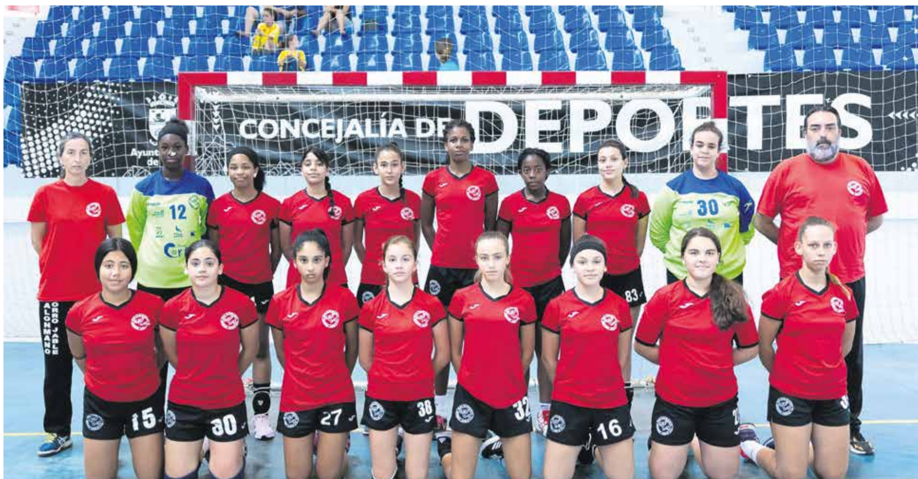
Alineación del club Balonmano Morro Jable y equipo técnico.