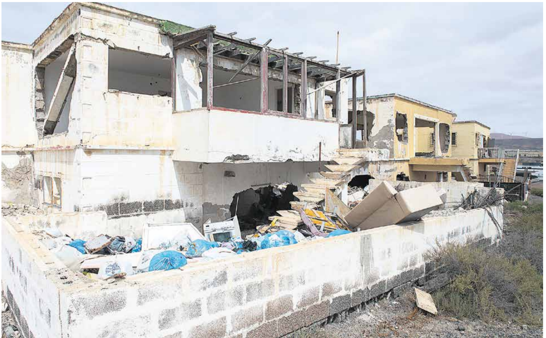
Aspecto de una edificación abandonada en Playa Blanca.