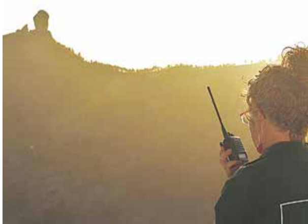
Cruz ante el Roque Nublo.