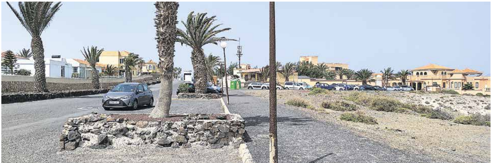
Los vecinos de La Pared se quejan del abandono de la urbanización.