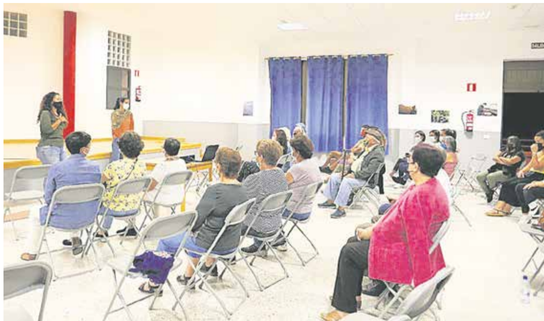
Encuentro en el marco del estudio.

El estudio proporciona una mirada diferente centrada en testimonios personales y un cortometraje documental impulsados por la Reserva de la Biosfera de Gran Canaria. Todo ello arroja luz sobre el papel esencial de las mujeres en los sectores forestal y ambiental,