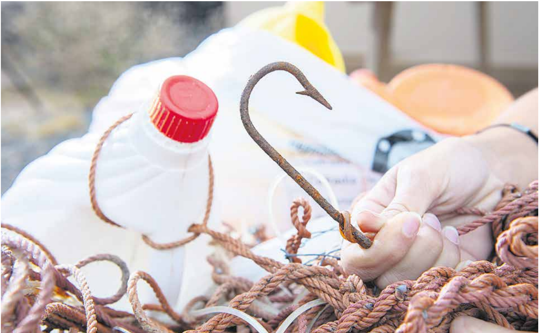
Un palangre recogido en aguas próximas a Fuerteventura.