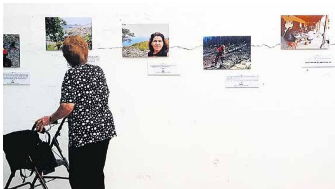
Una de las muestras organizadas en el marco del proyecto.

La Reserva de la Biosfera de Gran Canaria retira el manto de olvido sobre el papel de las mujeres para mantener el territorio y su singular modo de vida