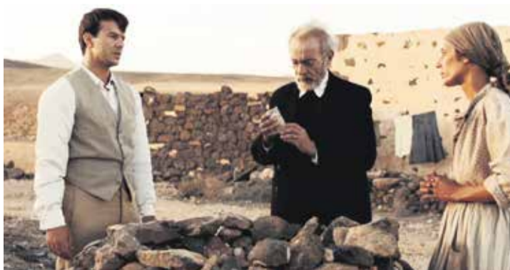
Fotograma de 'La isla del viento'.

-Si lo que va a aparecer son localizaciones urbanas que simulan ser Palestina, o México, como en Rambo , pues casi es mejor que no aparezca el nombre de la Isla en los títulos de crédito. Entiendo que se gane dinero, pero no veo el éxito de ser plató natural cuando haces pasar tu tierra por otro sitio. Hay algo insano en ello. Pero serían beneficiosas producciones donde se expusiera una historia local o una producción internacional con una historia que discurriera en parte en la Isla. Por eso me disgusta que no se cuide la producción local, que hace esto siempre.