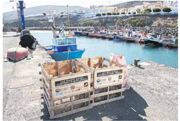
Contenedor de residuos en zona portuaria.

“Para que nosotros tengamos, por ejemplo, un buen stock de pesca necesitamos que los océanos estén limpios. Todo lo que entra en la cadena trófica también llega a nuestra mesa y eso conlleva ciertas enfermedades producidas por contaminantes que llevan muchísimo tiempo prohibidos en la Unión Europea, pero que aún se encuentran en el medio marino porque tienen una estructura química muy fuerte que impide que desaparezcan en un periodo