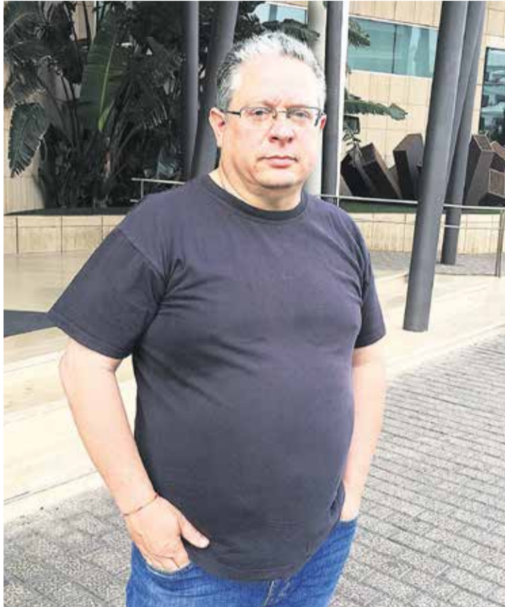
El productor, que ha rodado en Fuerteventura.

-La responsabilidad del productor es sacar un barco de un sitio y llevarlo a otro, en este caso terminar una obra. Y ese camino exige una labor de administración importante. Trabajamos con presupuestos muy acotados y hay que ejercer control sobre el gasto. Creo que lo que se dice de los productores, que si son agarrados, que si solo miran por el