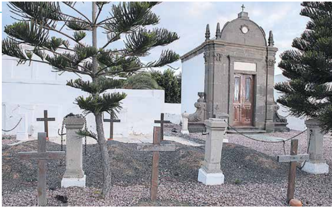
La capilla de los Pérez, en el antiguo cementerio de Puerto Cabras.

El 20 de febrero de 1934, el periódico Hoy publicaba en su