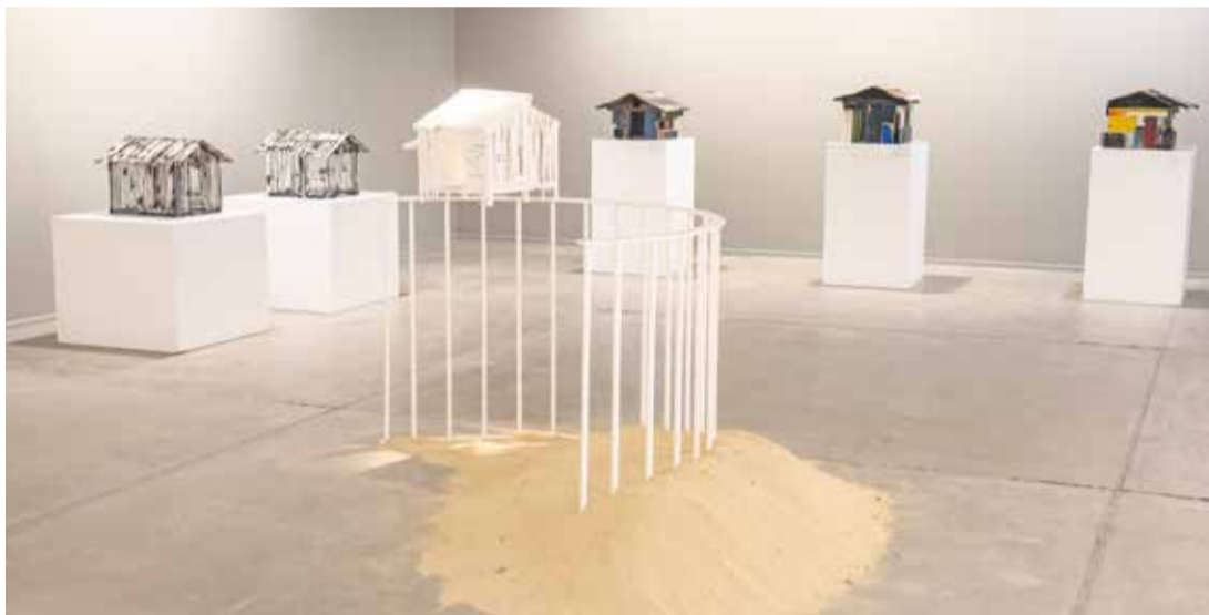
La pieza de instalación 'Duna', junto a la serie de cabañas (Sin título).

y por la variedad cromática, casi estridente. La serie más extensa, desplegada en una de las salas donde el artista, además, expone una de las series pictóricas, es, en sí misma, una alegoría a las orillas, pero también a la comprensión de la orilla como hogar.