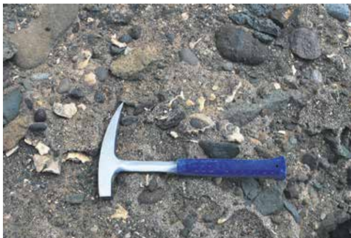
Lapas y ostras fósiles.

pecies de moluscos fósiles endémicos de Canarias presentes en Fuerteventura de los que tres son endémicos de la Isla mayorera. Se trata, apunta, de las Gibbulatindayaensis , Morulamionigra y Conusfuerteventurensis . Todos ellos identificados como caracoles marinos.