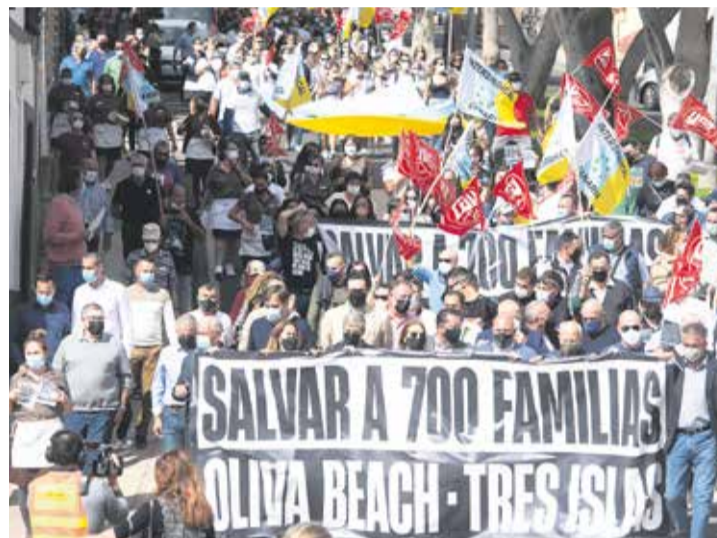
Manifestación impulsada por los trabajadores en febrero.

tiene, al incumplir de manera reiterada la normativa de Costas, pese a disfrutar de concesiones de uso del dominio público marítimo terrestre, que es patrimonio de todos los españoles”, sentencia el Ejecutivo.