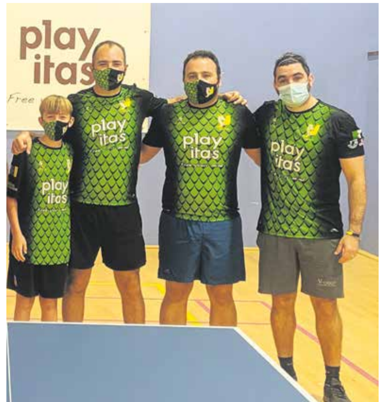
Los Dragones cuentan con miembros de todas las edades.