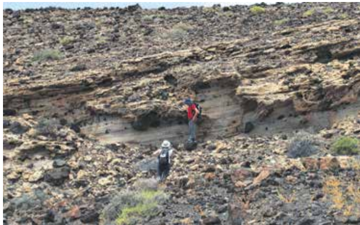
Barranco de Joros.