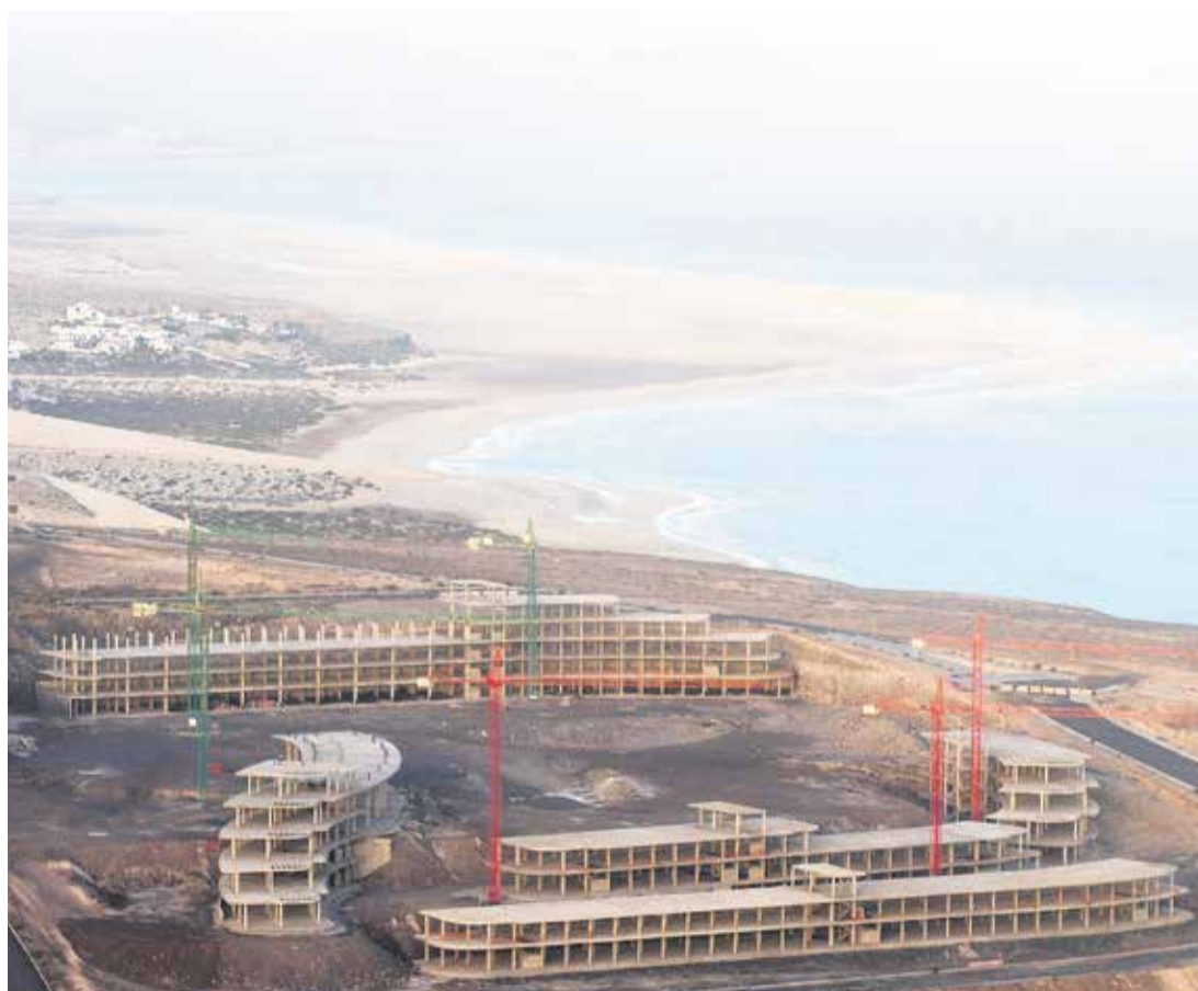
Hoteles en construcción, paralizados en el plan parcial Canalbién, en Pájara.

El sociólogo Mario Gaviria, uno de los primeros en ofrecer una visión crítica del desarrollismo español, describía esta situación en los setenta de forma muy descarnada en su famoso libro España a go-go : “Fuerteventura y Lanzarote reúnen unas características paracoloniales y desérticas, con muy baja densidad de población, sin agua, sin electricidad, sin infraestructura suficiente, por lo que los precios de los terrenos