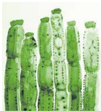
‘Familia Cardón’, 2407x3351px, 2010 - 2022. De la serie ‘Seres Vivientes’.

“Con la erupción hubo una respuesta desde un aspecto tribal muy positivo”