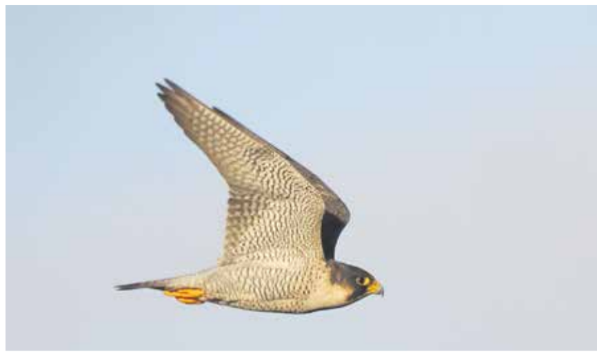
Halcón Tagarote, en pleno vuelo.

“Cuando una población es tan exigua, la pérdida de un solo individuo supone un terrible revés para la especie”, comenta el ornitólogo. Los tendidos eléctricos y las torretas, con apoyos