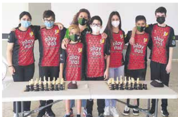
Secciones de ajedrez y voleibol.