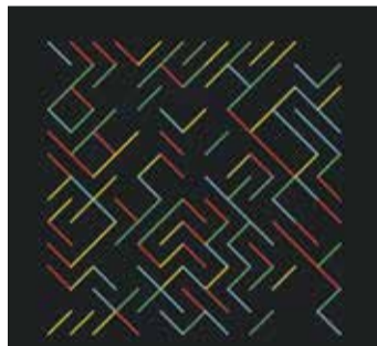
‘Labyrinth 005’, 1200x1200px, 2015. De la serie ‘Estructuras Binarias’.

“Con la erupción hubo una respuesta social muy potente en La Palma que está construida sobre las relaciones sociales. Ha sido como una familia y todo el mundo se implica de un modo u otro, desde un aspecto tribal que ha resultado muy positivo en este caso. Y no es casualidad. Esa cultura hay que trabajarla, no surge espontáneamente”, advierte.