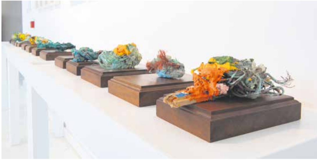
Detalles de la serie 'Souvenir Antropoceno'.

Los materiales son los grandes protagonistas de las dos series de instalación y de escultura de la exposición, que comparten con Souvenir Antropoceno un gusto estético por la simetría