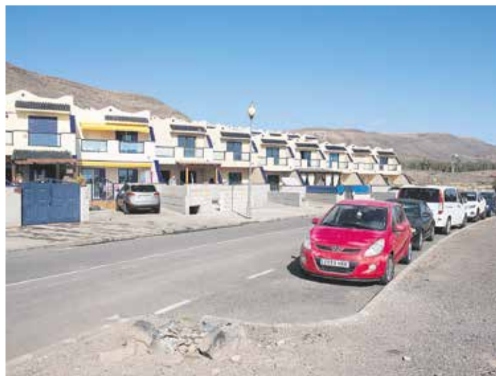
La urbanización Playa Las Águilas denuncia falta de iluminación y seguridad.

muchas instaladas, incluso, en el borde y centro de las calles, que son un peligro y que obliga a sortearlas para poder transitar. “Hay calles de tierra, otras están mal asfaltadas, no hay papeleras, faltan sombras, bancos y, por desgracia, creo que somos un ejemplo de cómo no se debe construir un pueblo”, critica el portavoz vecinal.