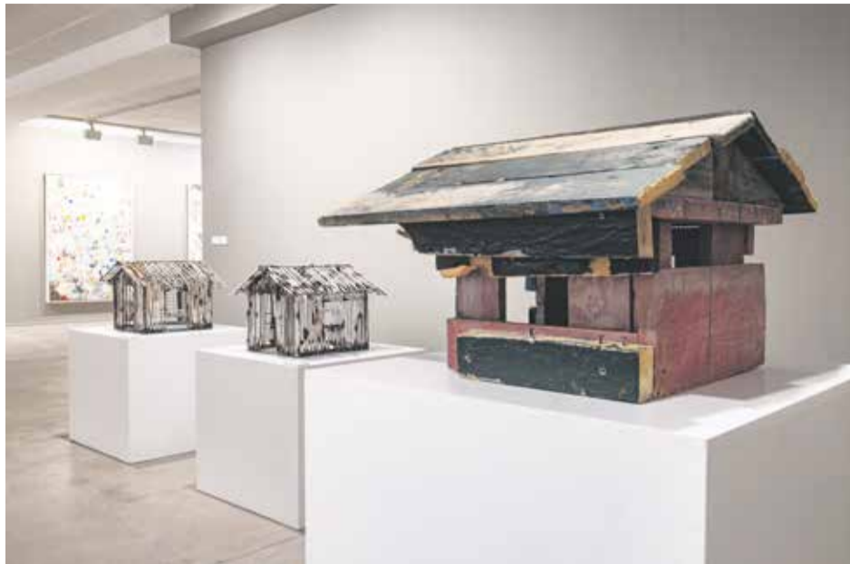
Detalle de cabañas (pieza Sin título).