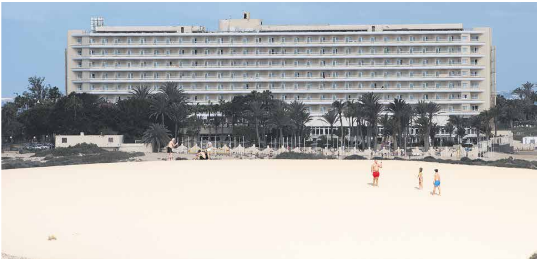
Hotel Oliva Beach, en las Dunas de Corralejo.