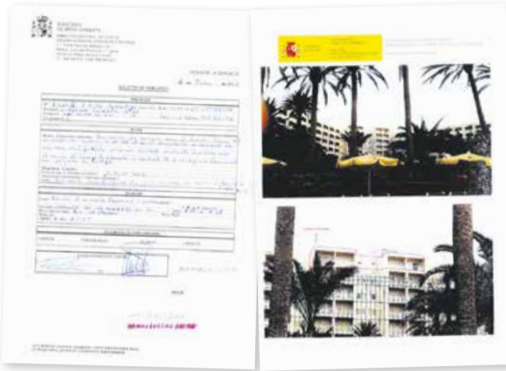
Denuncia por obras ilegales al Hotel Tres Islas en 2007 y acta de inspección.

Y cuando se acusa desde partidos de la oposición al Ministerio de Transición ecológica de la socialista Teresa Ribera de provocar el cierre de hoteles y se le pide que valore su impacto económico, el Gobierno dice que no le corresponde “hacer estimaciones sobre hechos hipotéticos, sino velar por el cumplimiento de la normativa”. “El Gobierno no promueve el cierre de ningún establecimiento hotelero en Fuerteventura”, asegura el Ejecutivo de Pedro Sánchez. “El Gobierno vela por que la cadena RIU, y todas las empresas y particulares que tienen títulos de ocupación del dominio público marítimo terrestre, cumplan la normativa de Costas para defender la integridad del patrimonio de todos” los ciudadanos, resalta el Gobierno central. También insiste en que “corresponde a la empresa cumplir con la legalidad” y asegura que “tiene todo el compromiso, la disposición y la sensibilidad con las familias de Fuerteventura y de toda España”. “Parece ser la empresa responsable de estos establecimientos hoteleros la que no la