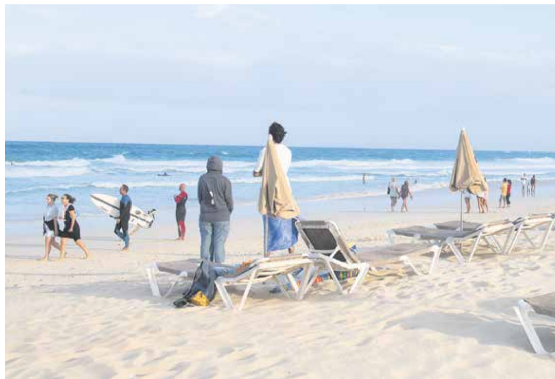
Turistas en una playa de Corralejo.

Fuerteventura recibió 969.772 turistas en el último año, la mitad que el ejercicio previo a la pandemia, y trata de identificar sus debilidades y amenazas