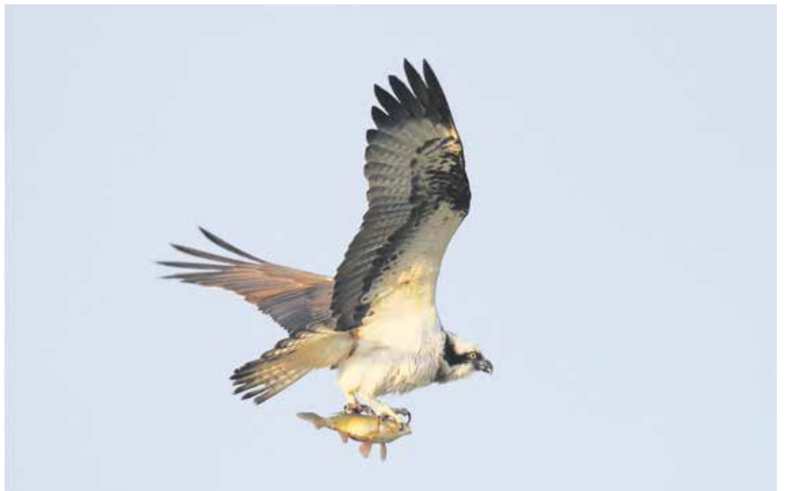
El guincho es conocido como el águila pescadora.

Gracias a la labor de campo que realizan se puede obtener