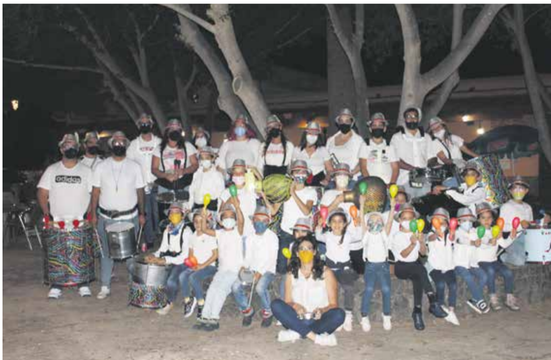
Nuevo Grupo Ilusión.