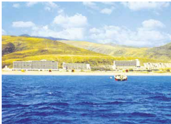
Vista de Morro Jable, desde el mar.

de corrupción. Vender y comprar parcelas había sido un gran negocio durante mucho tiempo, pero recalificar terrenos y dar licencias de construcción de forma fraudulenta desde la administración no se había quedado atrás.