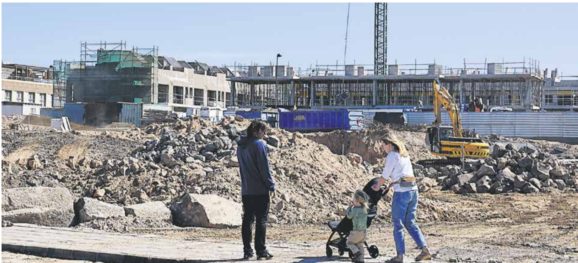
Una familia pasea junto a una parcela en construcción, en primera línea de El Cotillo.