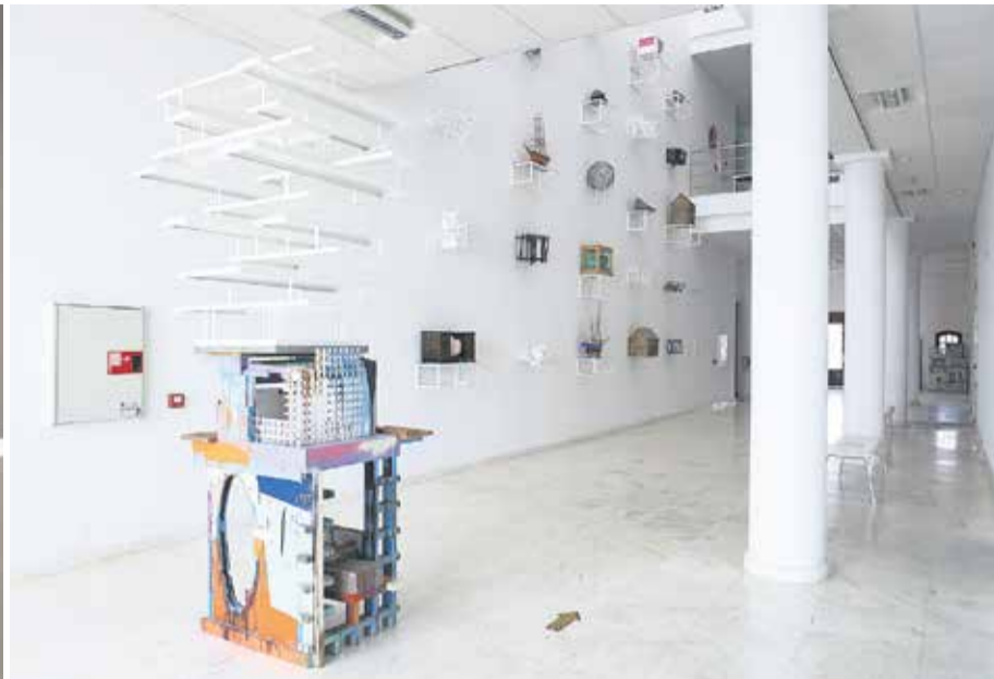
Serie de instalación 'Isla taller', basada en 'A la sombra del mar' (Manuel Padorno).

do en torno a ellos. A lo largo del tiempo, queda patente que es un artista que vive en su tiempo y está comprometido con él”, señala la comisaria.