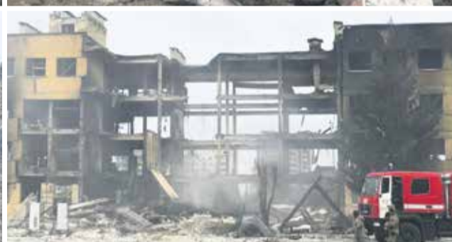
Imágenes de la invasión de Rusia en Ucrania.

de caos e incapacidad para distinguir entre destrucción y autodestrucción, porque en este mundo ya no hay necesidad de legitimar tus acciones. La violencia se ha liberado de la ideología”. Y en esas estamos, porque si en el siglo anterior la barbarie era canalizada a través de la radicalización ideológica, ahora asistimos a una especie de nihilismo tenebroso. No es casual que Rusia haya elegido la palabra ‘nazis’ para definir a los ucranianos. Las palabras han perdido todo su significado y es innecesario explicar a la propia parroquia los fundamentos del mal. Esto es algo que ya hemos visto con el desafío islamista y vuelve ahora canalizado a través de los delirios del inquilino del Kremlin.