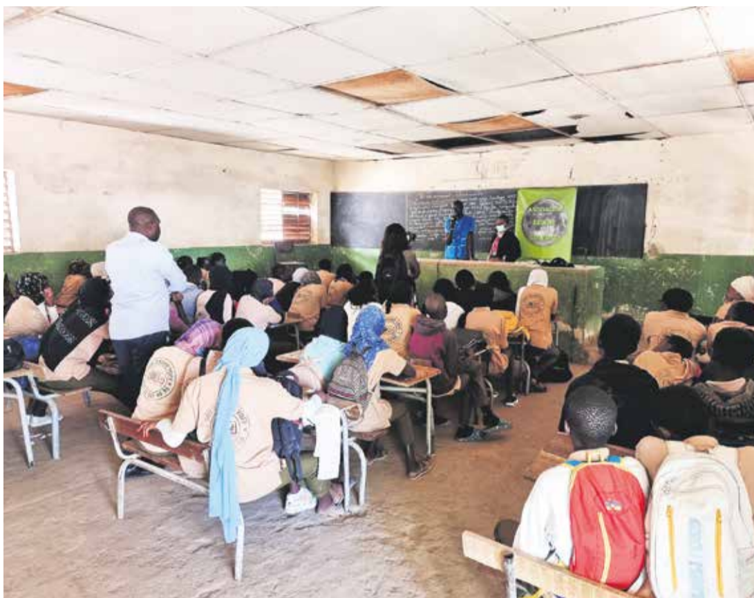
Imagen de una de las charlas, en un instituto de Senegal.

El mensaje que Cathy traía desde Europa es que no arriesgaran la vida, “es muy valiosa para hacer un viaje así”, y los animaba a formarse hasta alcanzar un bagaje educativo para “luego viajar legalmente a Europa”. Desde los pupitres la escuchaban grupos de alumnos, en ocasiones hasta 70, des-