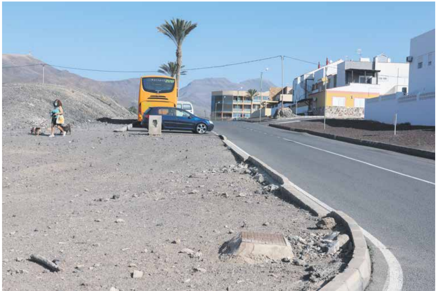
La Lajita demanda aceras y mobiliario urbano, carencias que se aprecian en la imagen.

En un pequeño paseo por La Lajita llaman la atención las numerosas deficiencias y precarias instalaciones públicas que presenta la localidad y, de forma especial, las aceras rellenas de picón, intransitables para las familias con carros de bebé o personas con movilidad reducida. Farolas colocadas sin orden, algunas sin conectar, y