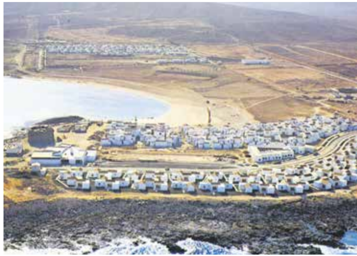
El Castillo, en el municipio de Antigua.

Esta etapa no solo reveló lo frágil del crecimiento económico de las últimas décadas, sino que también coincidió con la resolución de numerosos casos judiciales que mostraron lo más crudo de los que algunos han llamado 'urbanismo criminal'. Multitud de empresarios, alcaldes, jefes de oficinas técnicas, secretarios, promotores o cargos políticos eran declarados culpables en extensas tramas