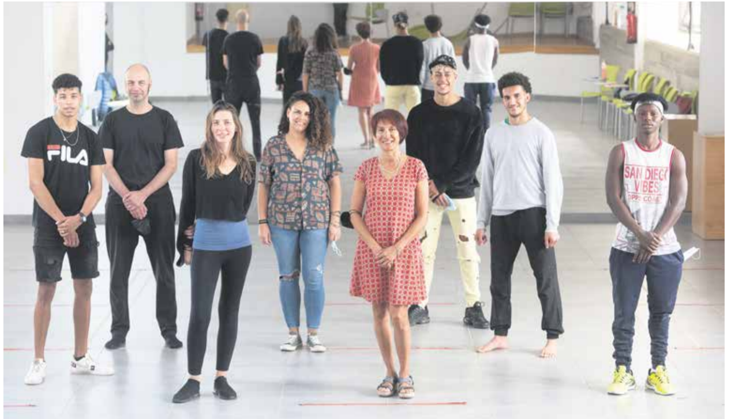
Miembros del proyecto ‘Latitudes encontradas’.

Las sesiones iniciales del proyecto, subvencionado por el área de Cultura del Cabildo de Fuerteventura y que cuenta con el apoyo de la Fundación Main (que acoge a los jóvenes), son una toma de contacto con las