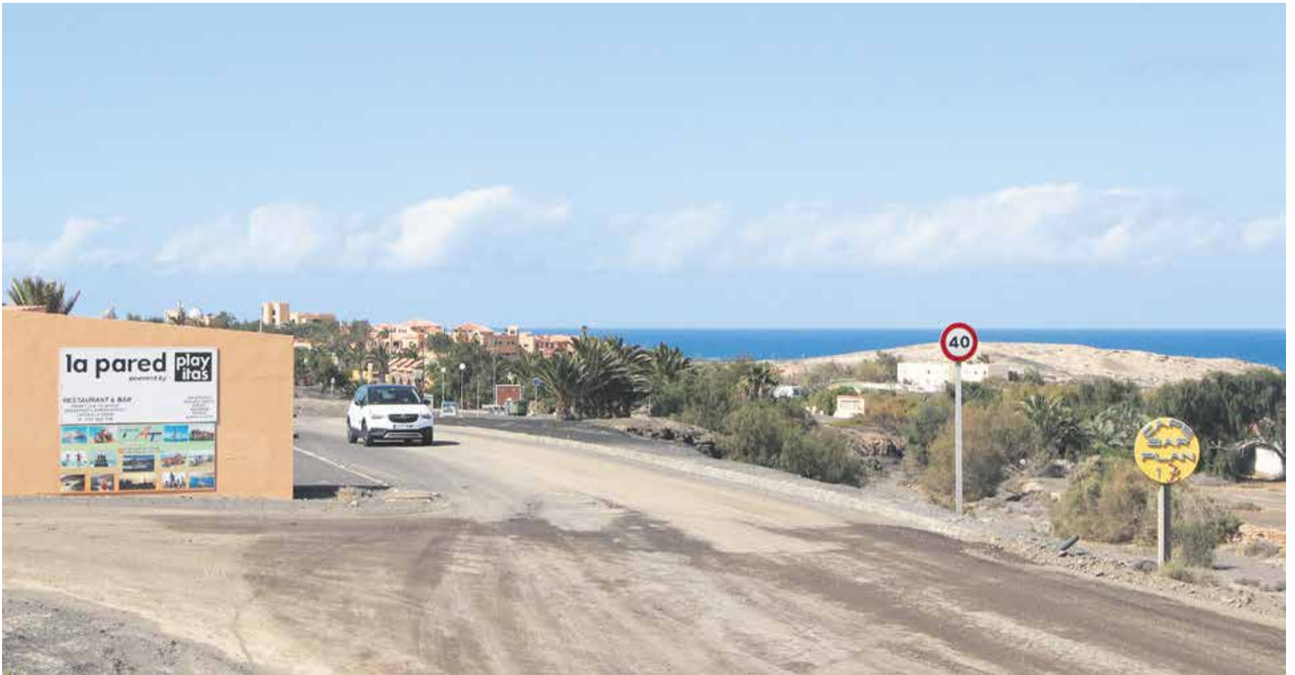
Entrada a la urbanización de La Pared, en el municipio de Pájara.