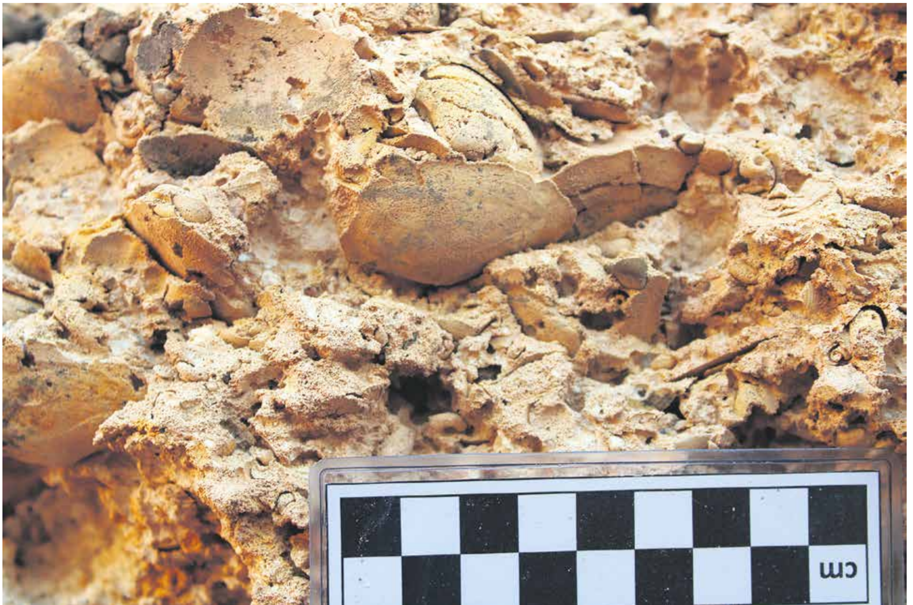
Moldes de conchas fósiles.