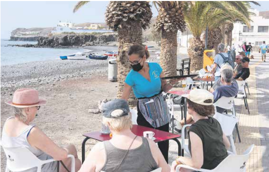
Bar restaurante Ramón, en el paseo marítimo del pueblo.

viendas fueron ocupadas. Por eso, algunas edificaciones están tapiadas con bloques y los residentes solicitan batidas de limpieza de los alrededores, mejora de la iluminación y servicios, porque se han quedado como una “urbanización fantasma”, eso sí, con unas vistas espectaculares al mar.