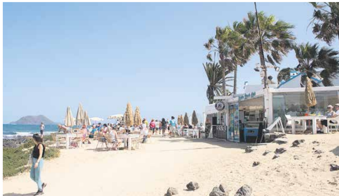
Mesas y sillas sobre la Playa de La Goleta, en una imagen reciente.

No atendió la orden de retirada y precinto pese a estar presente cuando se efectuó