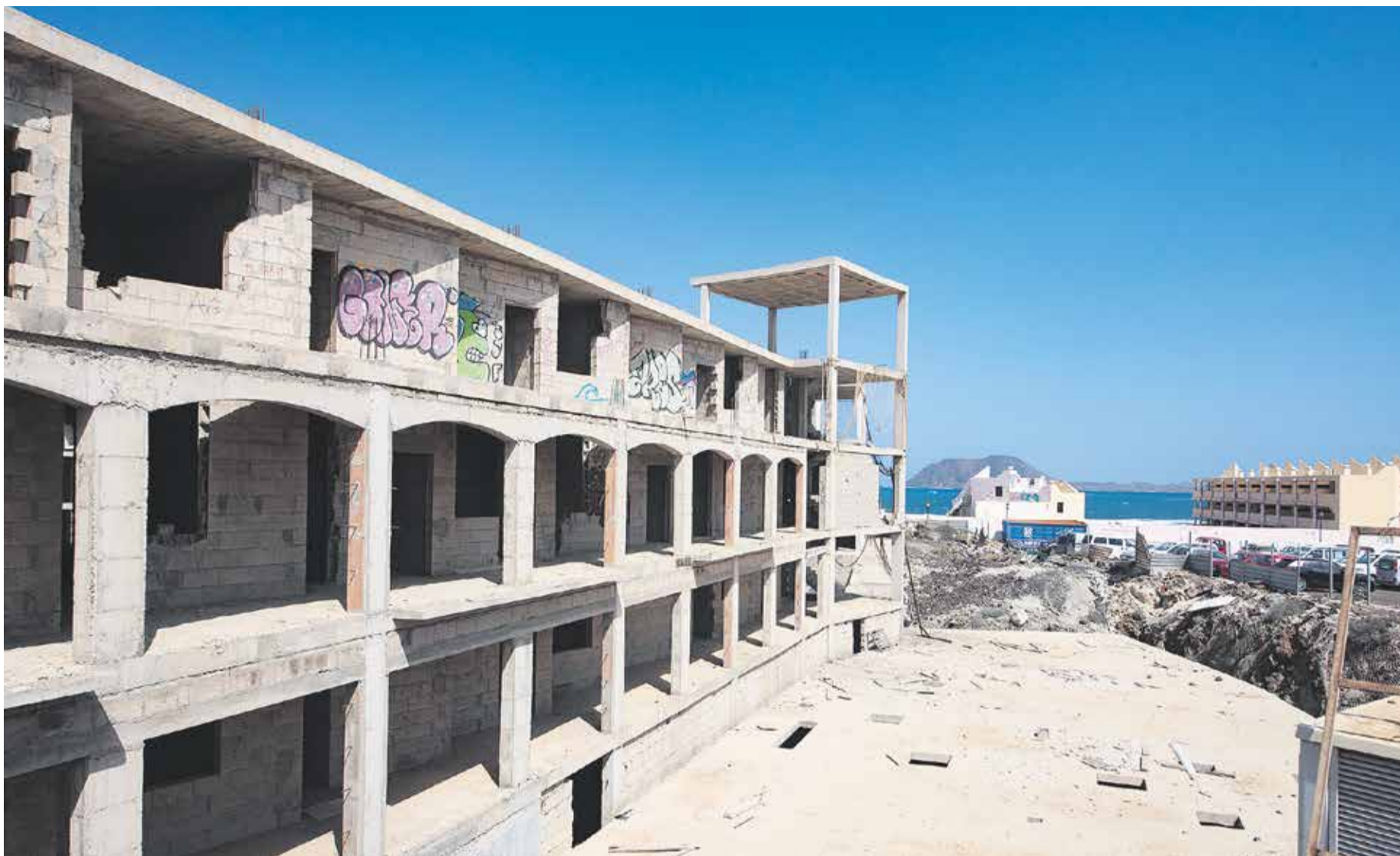
Imagen actual de un hotel paralizado en la localidad de Corralejo.