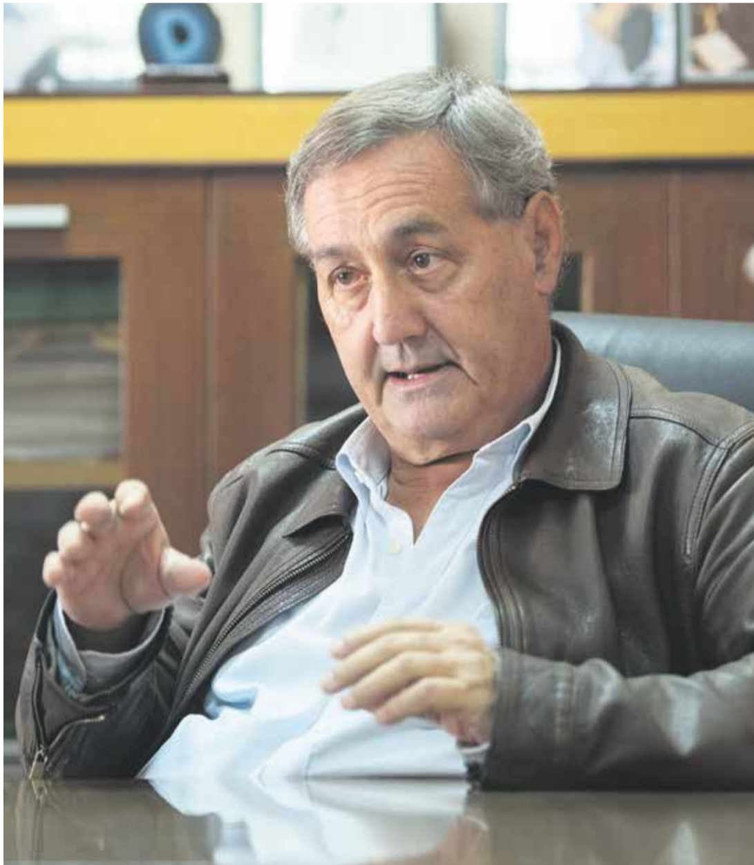
El concejal de la oposición, durante la entrevista.

-Reconozco que no estaba en el grupo de gobierno por lo que estaban otros, como, por ejemplo, el sueldo, ya que yo ni cobraba. Mire, yo me quedo si estoy a gusto, y cuando digo una cosa, me comprometo. No admito que, cuando hay una palabra dada, se la salten por cuestiones mundanas. En ese momento, conmigo se produjo una situa-