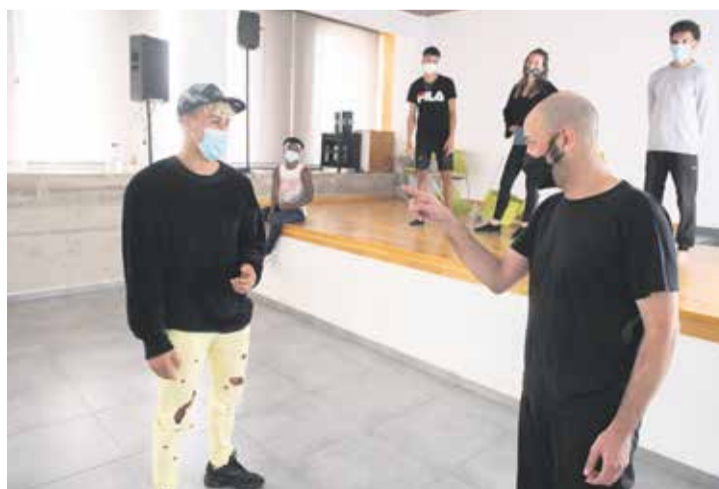
Ensayo en el Centro Polivalente de El Charco.

La cuarta pared es la única frontera del teatro; a veces el público puede sentir, realmente, ganas de rasgarla.