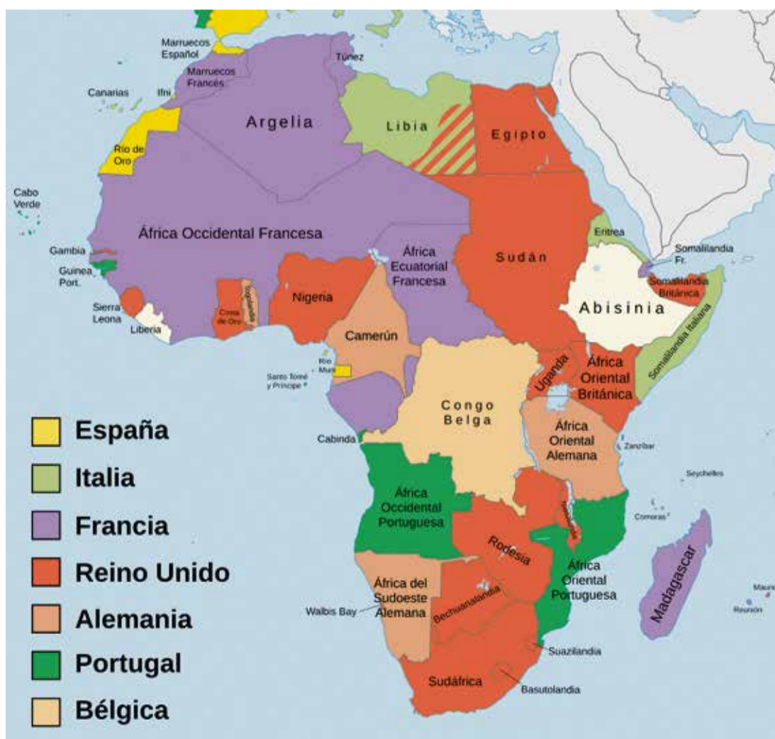
Mapa colonial de África en 1914. Los territorios en color amarillo correspondían a las posesiones de España en África.

La relación del Archipiélago con el continente vecino ha vivido profundos altibajos, aunque casi siempre ha tenido a Fuerteventura y Lanzarote como punta de lanza