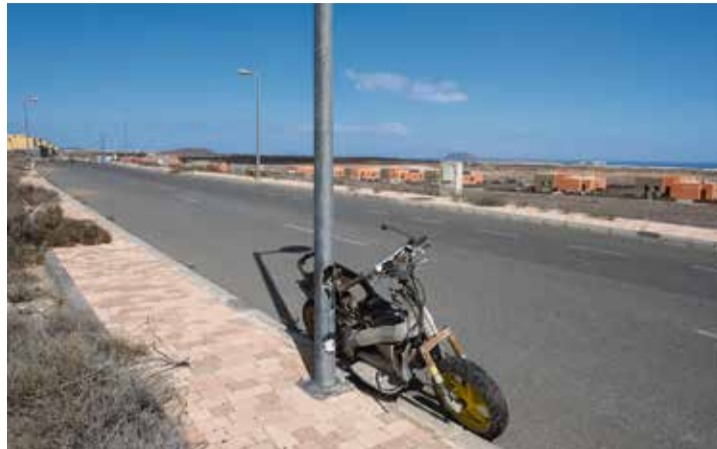
Estado de abandono de la urbanización.

En los últimos tiempos, también temen que se produzca algún problema sanitario derivado de la depuración de aguas. Del Pozo explica que la urbanización tiene todas las instalaciones, servicios e infraestructuras terminadas, pero no se han llegado a poner en uso. La urbanización tiene una estación depuradora, ubicada en la parte más