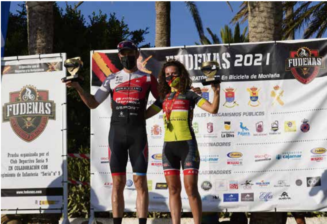
Ganadores de 2021.