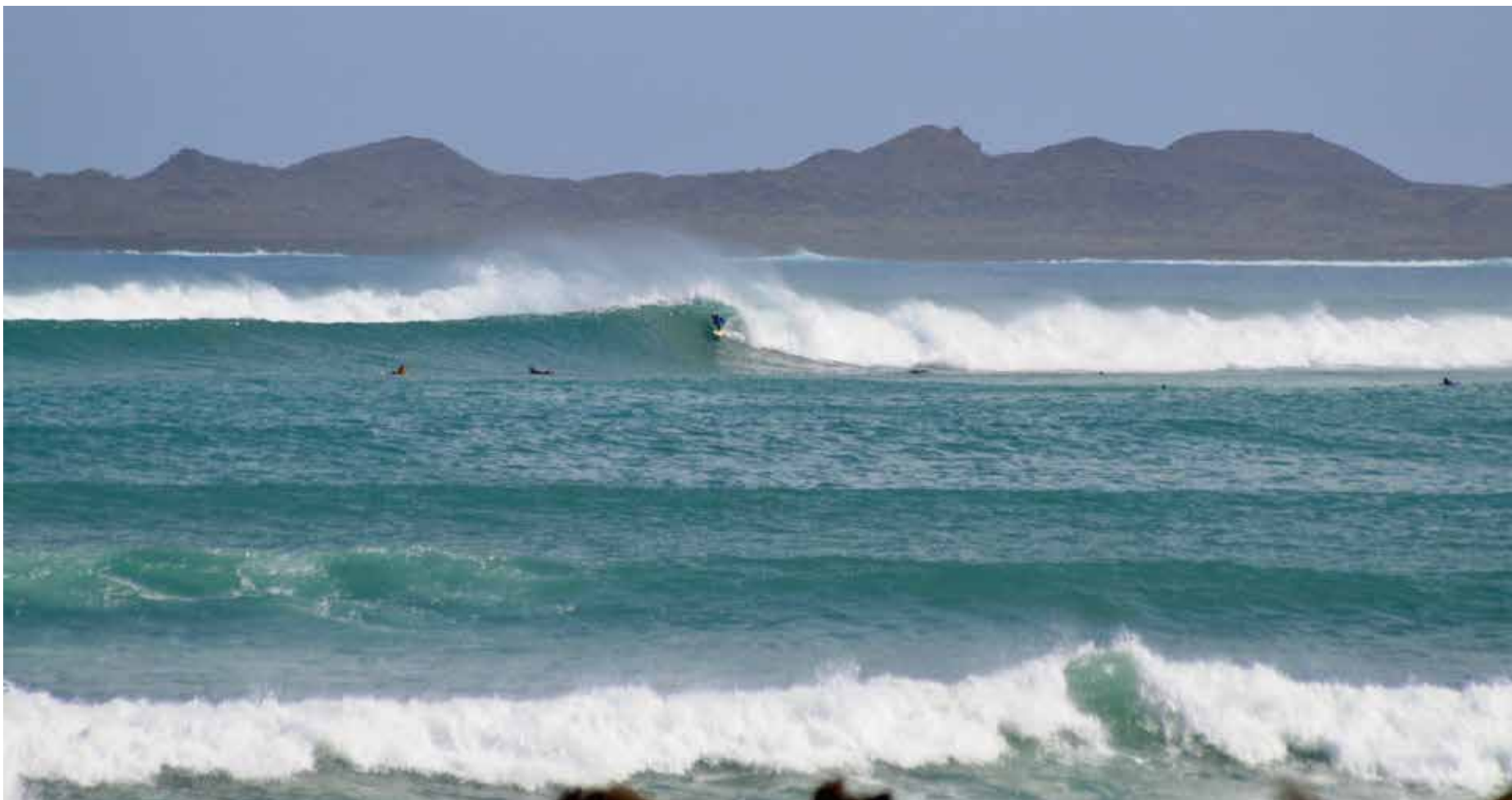
Imagen de la ola denominada Baja del Medio, que rompe en Corralejo.