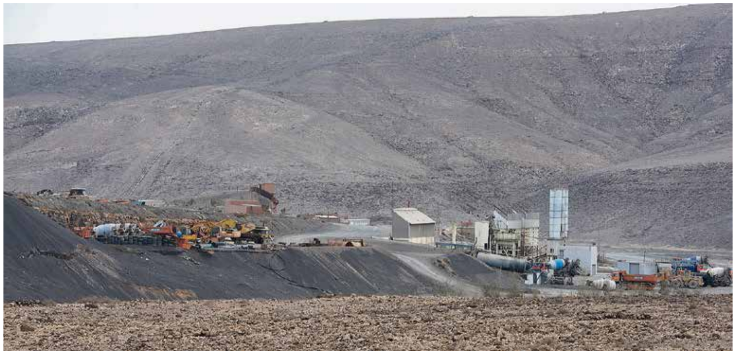
Complejo minero e industrial del Barranco de la Torre.

La Fiscalía acusa de delitos contra la ordenación del territorio y el medio ambiente a Transportes Pablo de León por sus instalaciones en el Barranco de la Torre