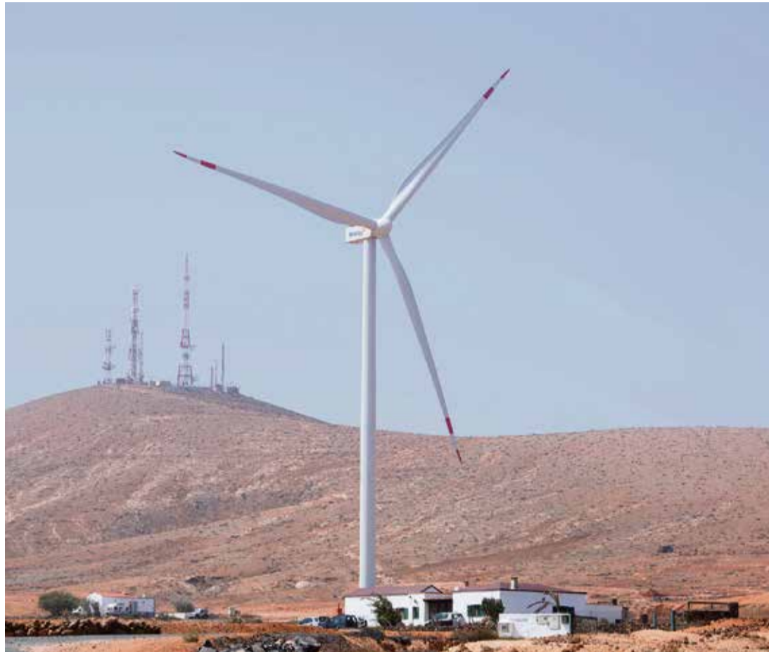
Aerogenerador junto a una vivienda en El Time.

Ahora, ni más ni menos que los partidos del Pacto de las Flores, los que llegaron al poder nutriéndose de votos esperanzados en que las cosas cambiaran en la política canaria, han apro-