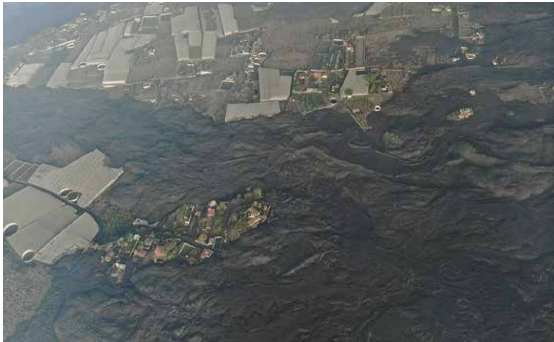
La erupción del Cumbre Vieja ha ocasionado más perjuicio a La Palma que la pandemia de Covid.

La unidad política parece un requisito esencial para abordar todo lo que viene. Se ha dicho por activa y por pasiva y, mal que bien, hasta ahora el mensaje dominante es el de concordia ante la erupción volcánica. Es normal. Los propósitos bienintencionados no durarán siempre, y tampoco es imprescindible. La gestión de la catástrofe será otro cantar, aunque sería