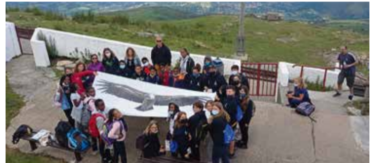
Imágenes de la visita de los alumnos a Bayona (Francia).

ñala. “Unos 40 escolares de la Isla pudieron viajar a Francia y nadie se contagió, porque había muchos controles sanitarios y se respetaron las medidas de seguridad”, apostilla el docente.