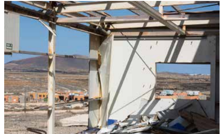
Algunas viviendas han sido expropiadas.