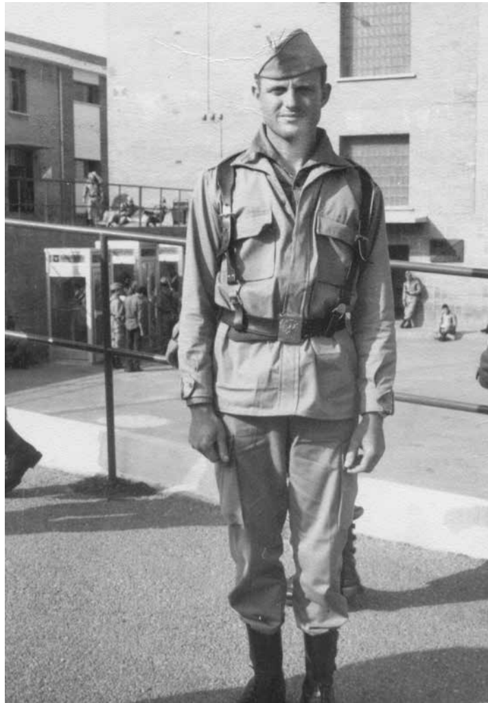
Legionario en el acuartelamiento de Puerto del Rosario en los años setenta.

España era una potencia europea menor en el siglo XIX, alejada de un desarrollo industrial fuerte y con problemas para mantener sus últimas provincias de Cuba, Puerto Rico y Filipinas. Esto no fue óbice para intentar poner en marcha un espacio marítimo-colonial en el noroeste de África, logrando que se le reconocieran territorios en la zona de Marruecos, Sahara y Mauritania, al tiempo que consolidaba sus posiciones en el golfo de Guinea (Fernando Poo, Río Muni, etcétera).