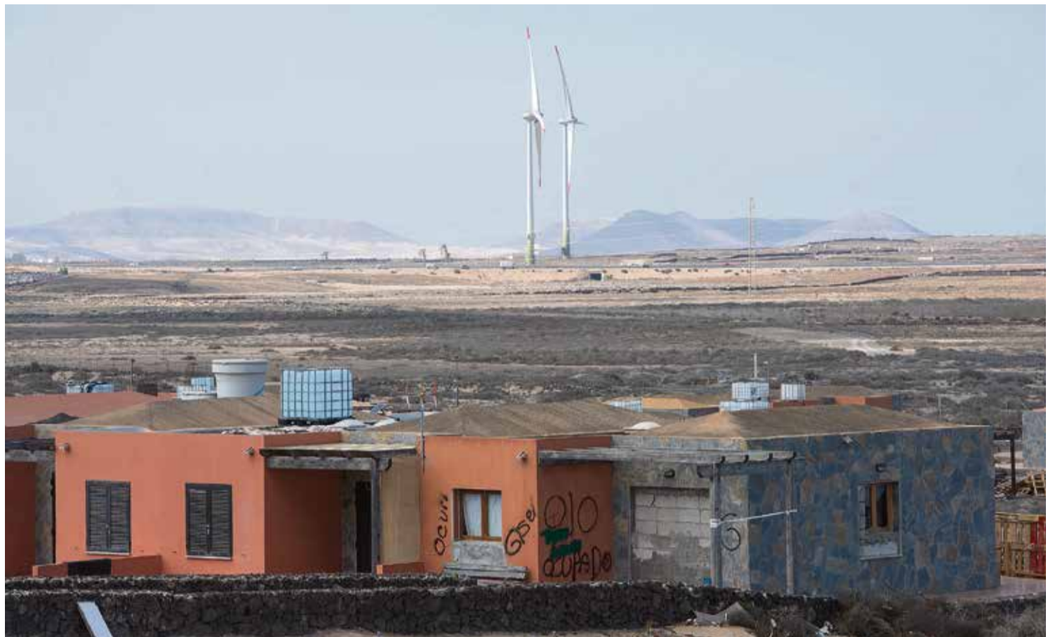
Urbanización Atalaya Dorada, en el municipio de La Oliva.

La urbanización, proyectada por la constructora Martinsa-Fadesa, se encuentra abandonada, sin servicios y tomada por la okupación ilegal