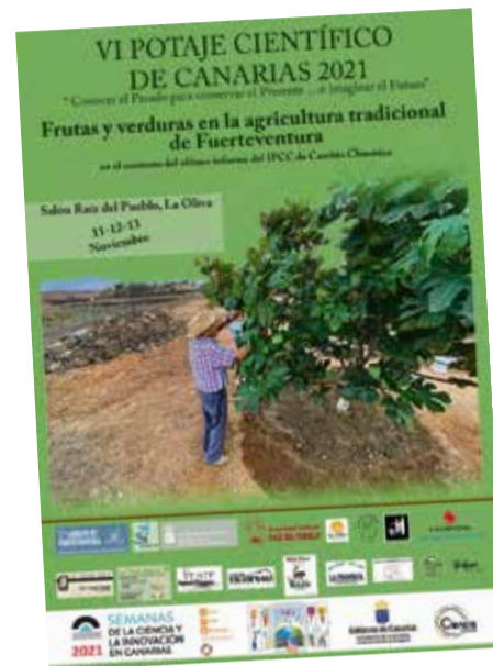
Cartel del Potaje Científico.