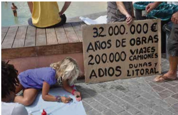
Los residentes, durante una protesta.