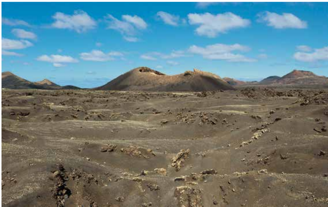
Timanfaya, en Lanzarote.