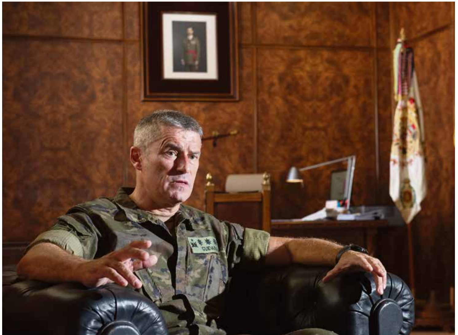
El coronel durante la entrevista en su despacho del cuartel de Puerto del Rosario.

-Entre los meses de marzo y junio del año pasado, el Regimiento participó en la denominada operación Balmis, que fue la contribución del Ministerio de Defensa a la lucha contra la pandemia, y nos desplegamos tanto en Fuerteventura como en Lanzarote, que no cuenta con guarnición militar. En ese periodo realizamos básicamente tres acciones: patrullas de presencia, patrullas de colaboración con fuerzas de seguridad del Estado y acciones de descontaminación. El principal reto fue no conocer el enemigo contra el que estábamos luchando. Sin embargo, esto mismo fue una gran lección para la unidad, dado que nos enseñó que debemos estar preparados para todo, hasta para lo que desconocemos. Tras la operación Balmis llegó la operación Baluarte, en la que hemos contribuido con rastreadores, hasta un máximo de 15 en la Isla, entre Puerto del Rosario y Corralejo. Ahora, el esfuerzo de la unidad está en terminar un plan de preparación muy intenso, generando además