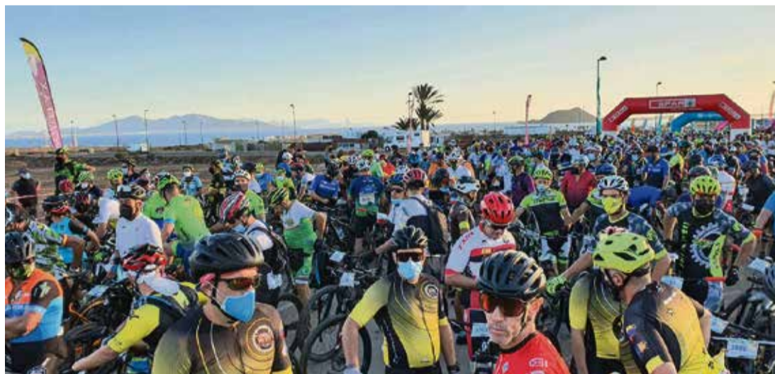
Numerosos deportistas se dan cita en la prueba mayorera.