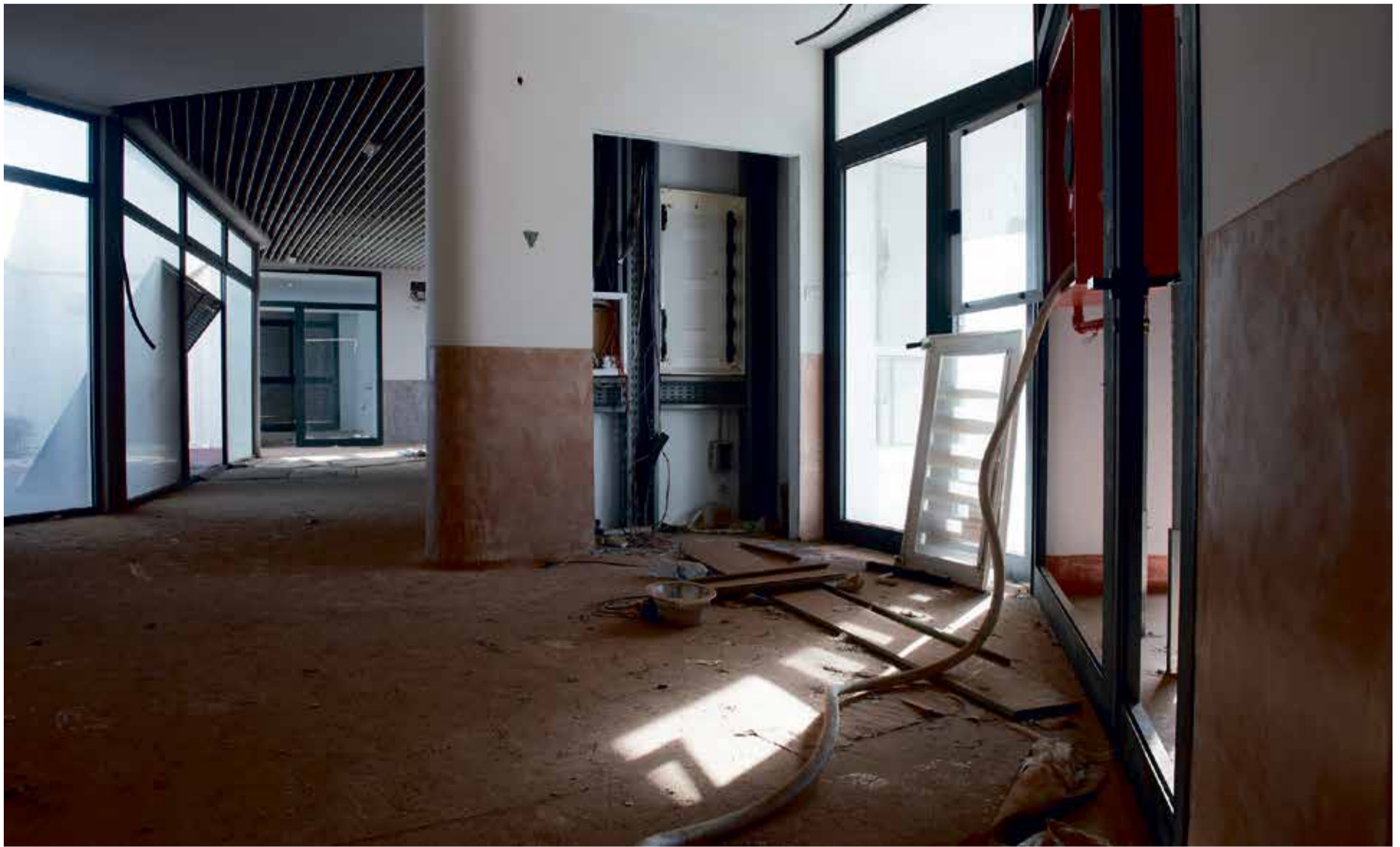
Interior de la abandonada escuela infantil de Antigua.