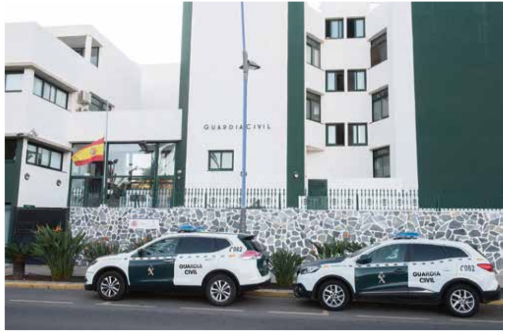
Equipos de la Policía Local de Puerto del Rosario, de la Guardia Civil y de la Policía Nacional.