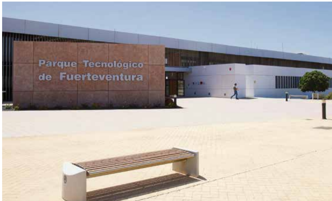
El Parque Tecnológico es la sede de Geo Training Center.

Estas formaciones de alta cualificación van dirigidas a personas entre 16 y 56 años y serán de carácter gratuito, con una pequeña cuota de inscripción. Desde el Parque Tecnológico de Fuerteventura se ha subrayado la “enorme oportunidad” que supone esta oferta. El objetivo es “generar, a nivel insular y regional, nuevos y suficientes empleos de valor añadido, así como retener talento local y atraer nuevos perfiles, para posibilitar el éxito del despliegue de los proyectos previstos en CGIP2030, iniciativas que “requieren de formación técnica específica que hasta ahora no se