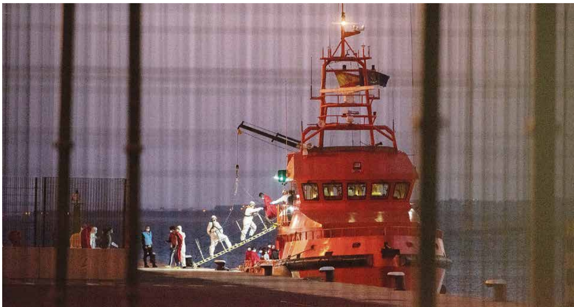
Llegada de migrantes rescatados en las costas mayoreras.