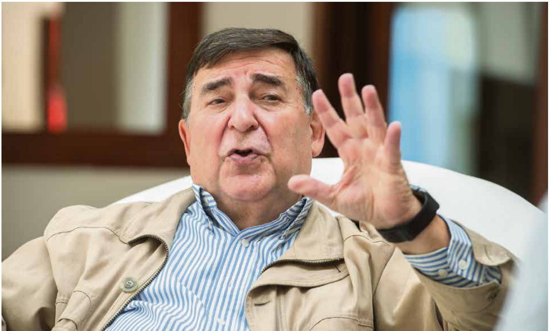
El profesor durante la entrevista.