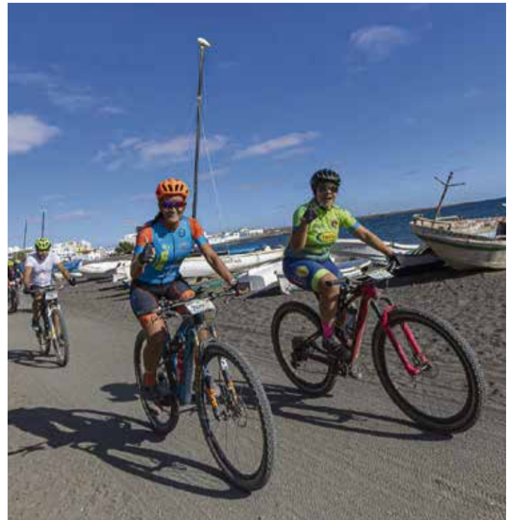
Participantes en la prueba.