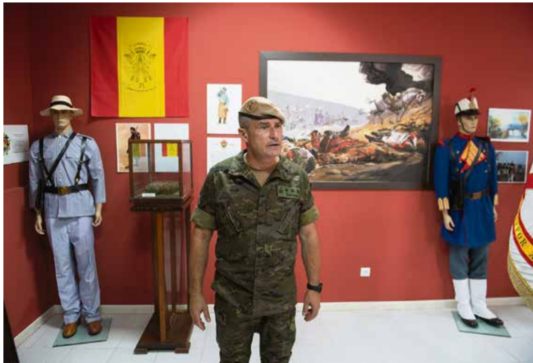
Sala que recoge la historia del Regimiento Soria 9 a lo largo de los siglos.

-Tendría que responder en primera persona. Cuando llego a una isla que no conozco, pequeña, tenía muchas dudas sobre cómo fomentar esa implicación en la sociedad, pero tuve una visión muy positiva. Fuerteventura es un espacio tan reducido, pero próximo, que es muy fácil tratar con todos los actores sociales. Siempre cuento una anécdota muy curiosa: al poco de llegar aquí tuve una conversación con el presidente del Cabildo en la cola del supermercado. Esto te permite tender puentes muy rápidos y es fácil solucionar cualquier problema. Después de estos dos años mi impresión es extraordinaria. Una vez finalizado el confinamiento, reforcé un plan de acción institucional. Realizamos una exposición en la Casa de la Cultura del Ayuntamiento de Puerto de Rosario sobre la operación Balmis. También otra sobre el Regimiento en un centro comercial, con un grado de afluencia y resultados fantásticos, y teleconferencias en centros de enseñanza de la Isla explicando la misión de las Fuerzas Armadas, que alcanzó a 300 alumnos. Asimismo, hemos ofrecido conferencias y dos cursos de liderazgo, con la participación de alcaldes y del director del aeropuerto. Estamos a la espera de editar el libro sobre el Plan de Defensa de Fuerteventura de 1943, un episodio histó-