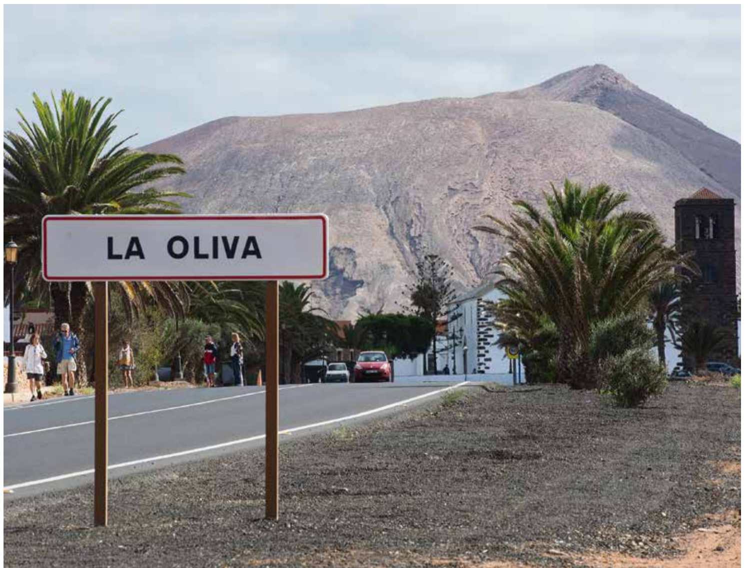
Entrada al pueblo de La Oliva.