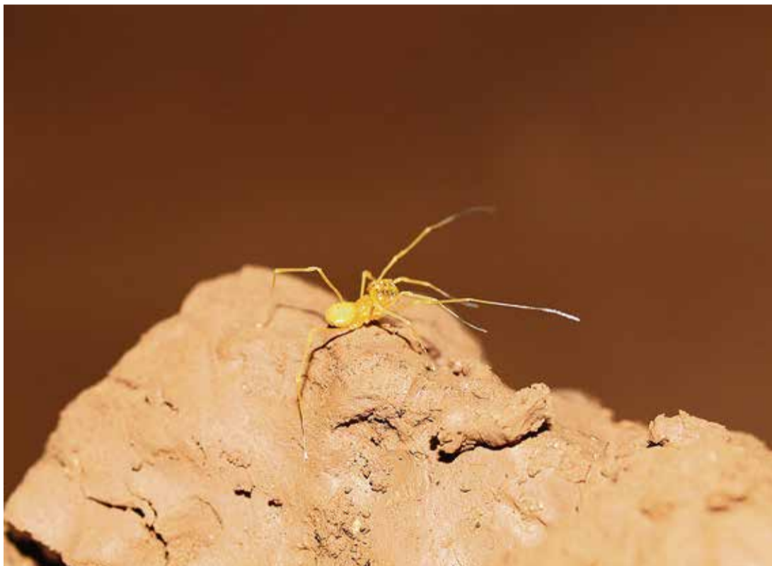
El Estado incluye al opilión en el Catálogo Español de Especies Amenazadas en 2011.

El arácnido que encontraron los estudiantes en noviembre