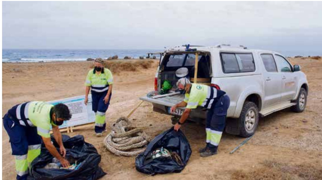
Imágenes de la campaña de recogida de limpieza.

Las redes y artes de pesca fantasma se han convertido en una de las principales amenazas a las que se enfrentan los cetáceos y las tortugas marinas. Hasta la costa mayorera también