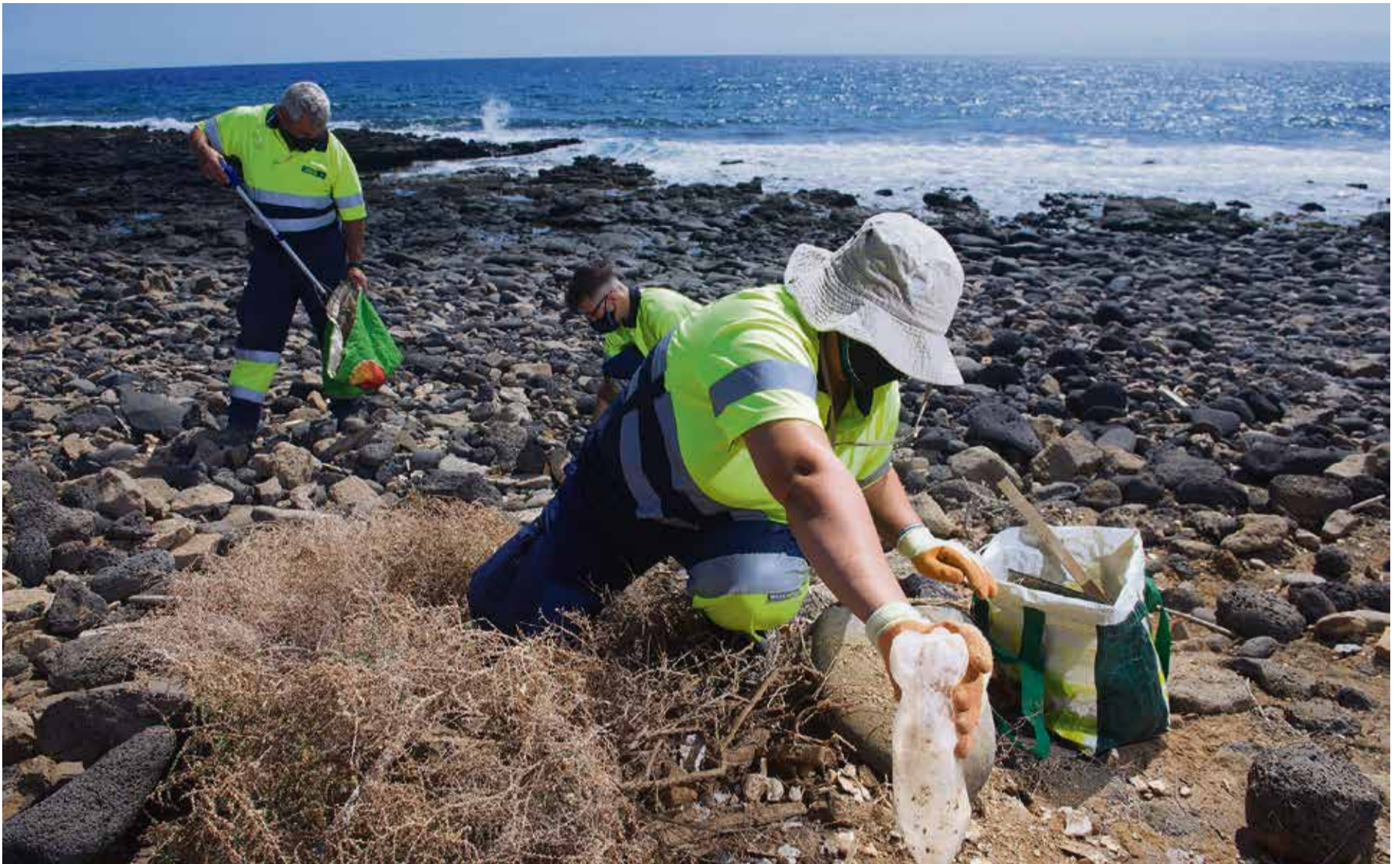
Recogida de residuos en la costa junto al aeropuerto.