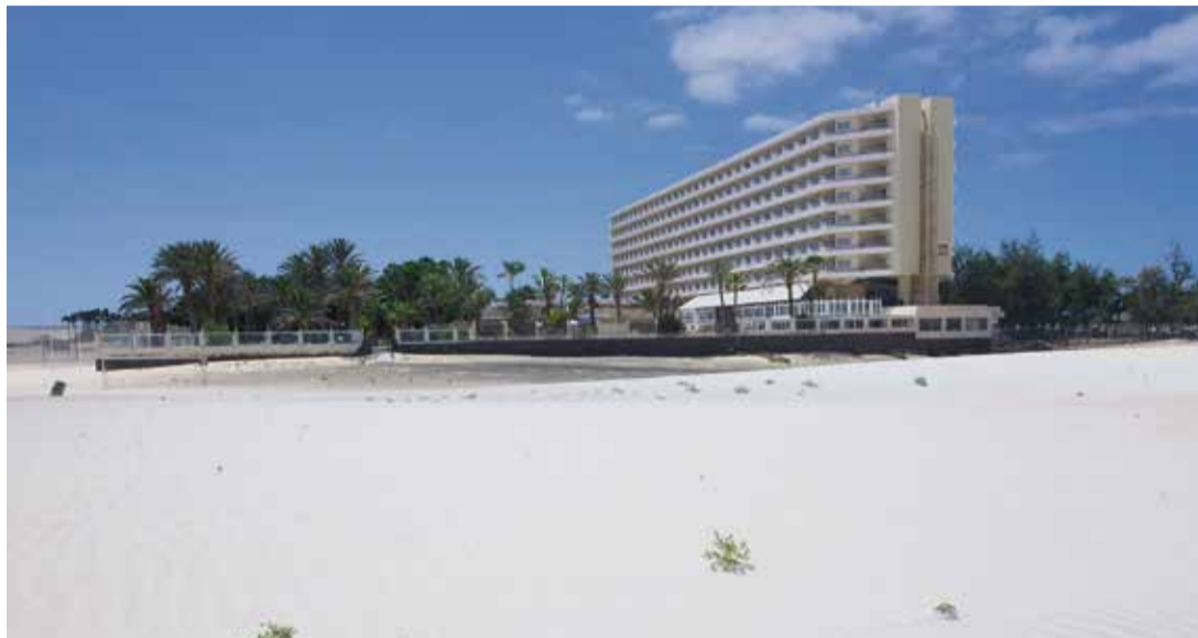
Hotel Oliva Beach.

En estos momentos se está librando una batalla político-cultural en España. Es un duelo de enjundia que puede determinar el futuro del país. Su primer epi-