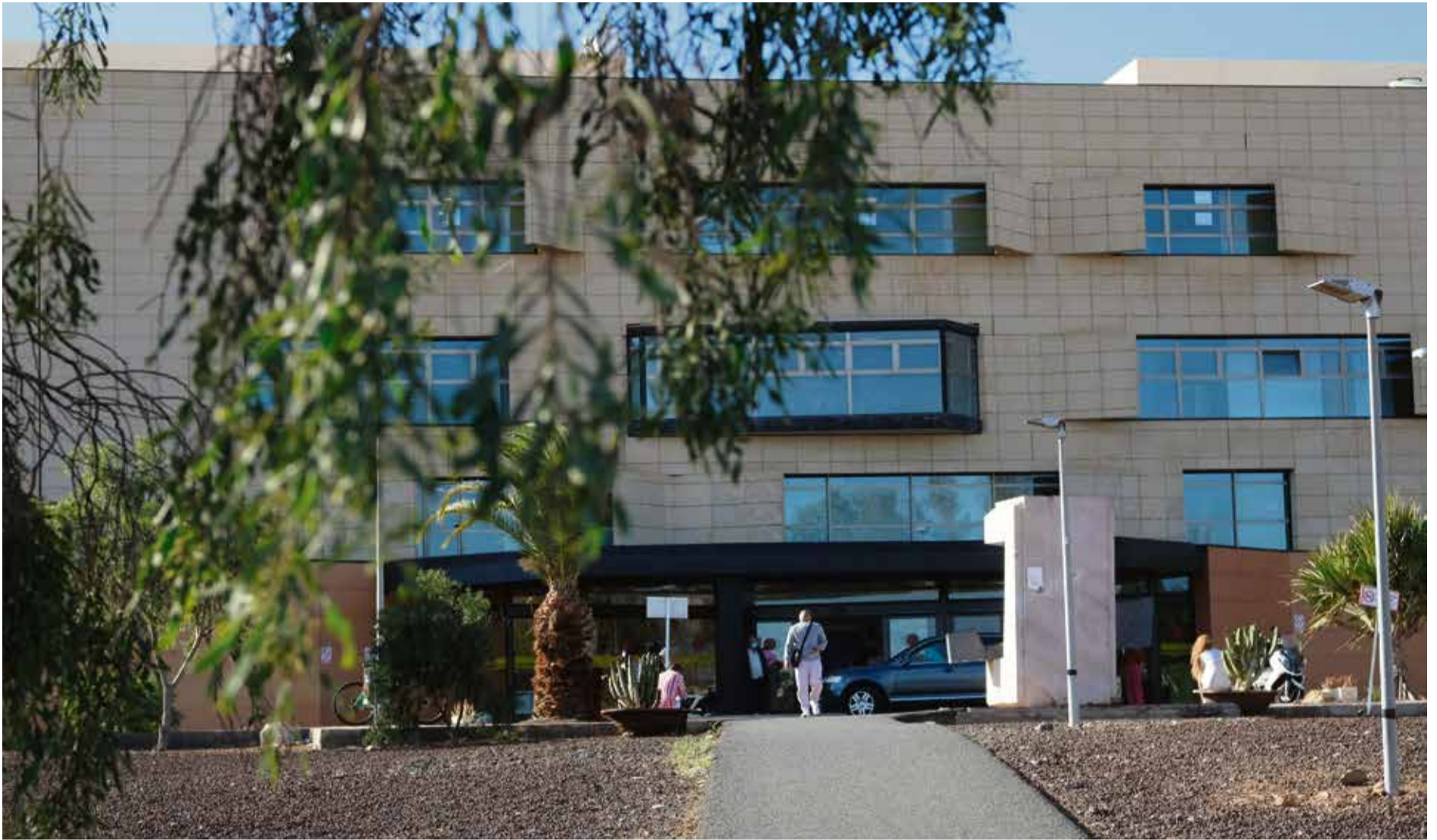
Entrada al Hospital General de Fuerteventura.