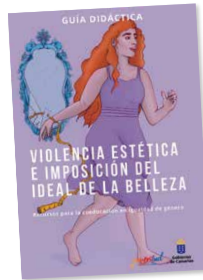
Portada de la guía.

Todo esto ha dado pie a lo que algunos psicólogos y cirujanos han venido a llamar la dismorfia de Snapchat, un término que hace referencia a las personas que se quieren operar para parecerse a su propia imagen retocada con los filtros de algunas aplicaciones. Nadia asegura que cada vez hay más personas que