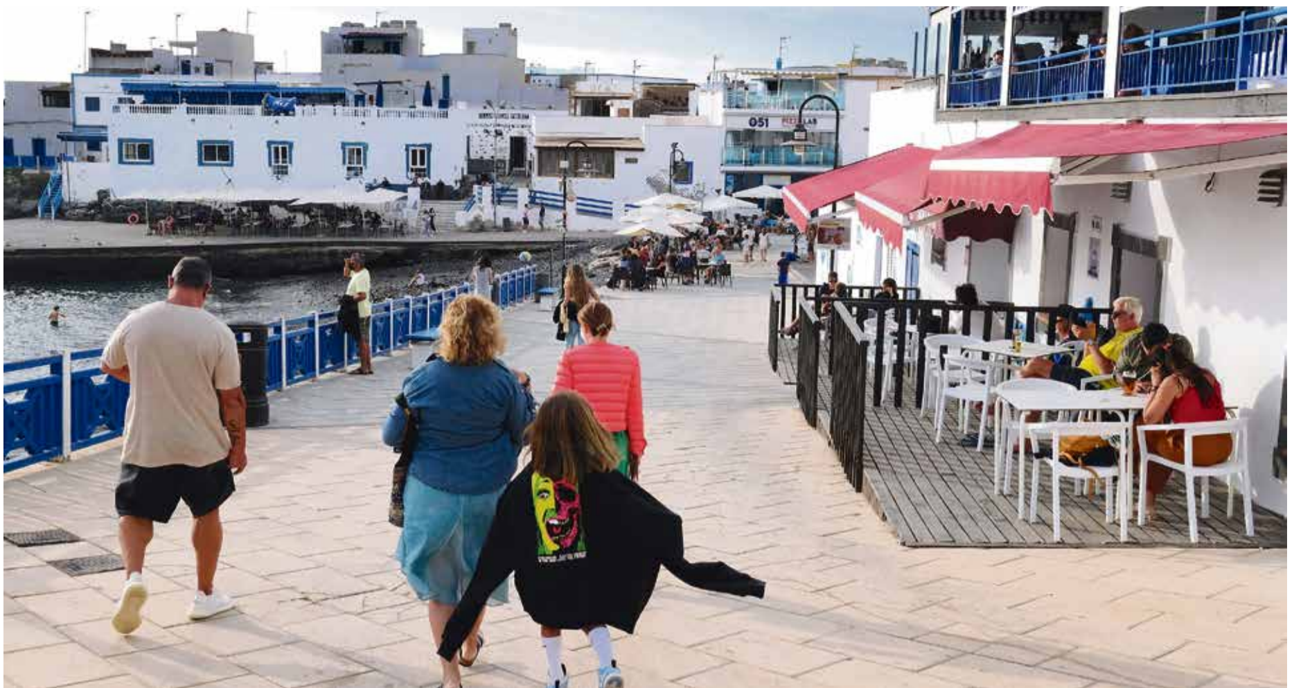
Turistas en El Cotillo.