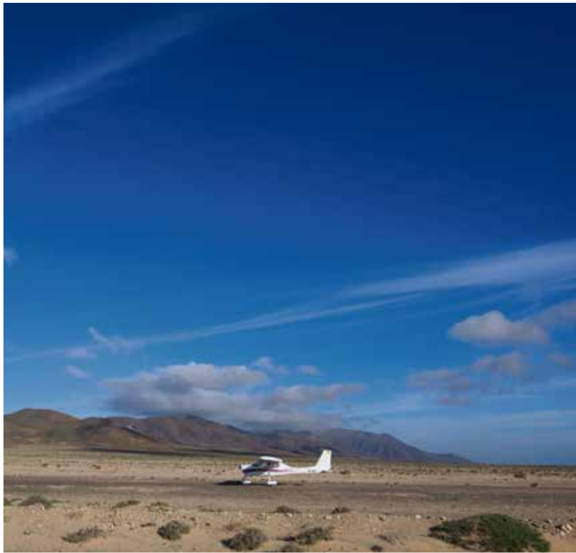
Pista de aterrizaje en Jandía.