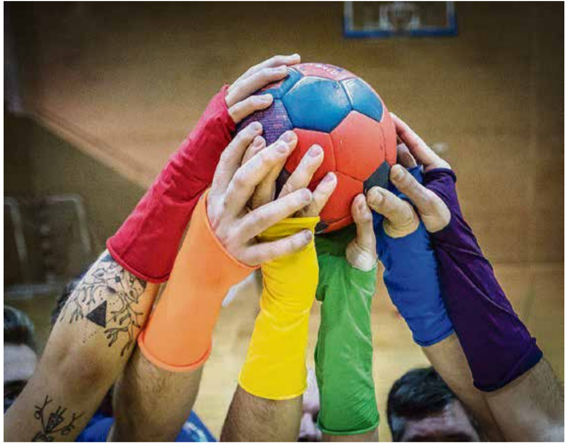
Abajo, integrantes del primer equipo LGTBI de balonmano de España, GMadrid, junto a Umpiérrez.

“El objetivo no es solo turístico sino apoyar la causa de los derechos civiles”