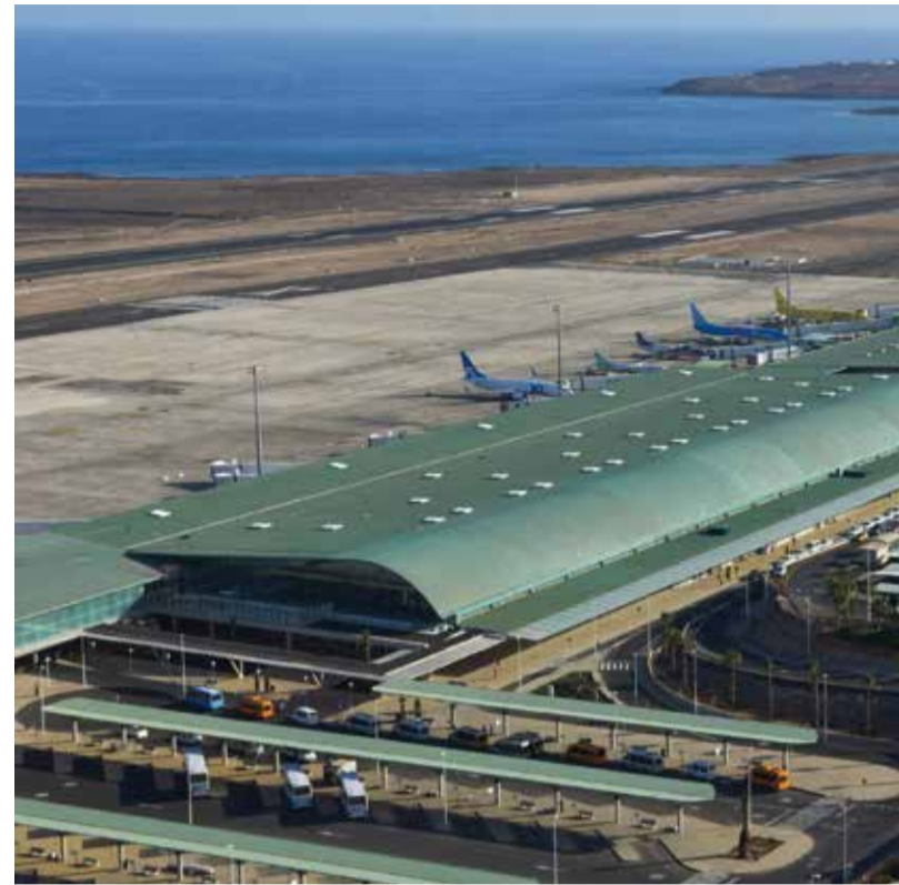
Terminal del antiguo aeródromo en Los Estancos e instalaciones del actual aeropuerto de Fuerteventura, en El Matorral.