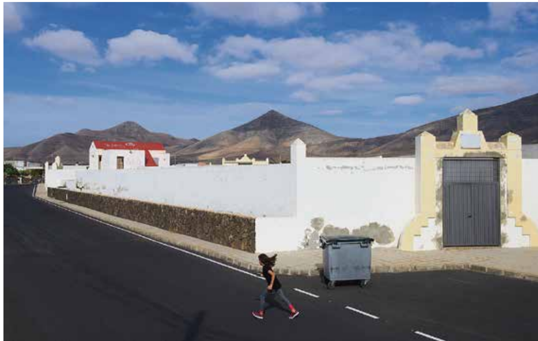
Una niña cruza la calle frente al polideportivo.

Los niños y no tan niños que quieren hacer deporte en el pueblo tienen todo el cercado para hacerlo, pero no unas infraestructuras deportivas acordes al siglo XXI. En pie continúa el polideportivo, pero con la puerta cerrada. La última vez que recuerdan con vida el recinto fue con la visita del payaso Miliki hace más de veinte años. Hace un tiempo, pintaron un campo