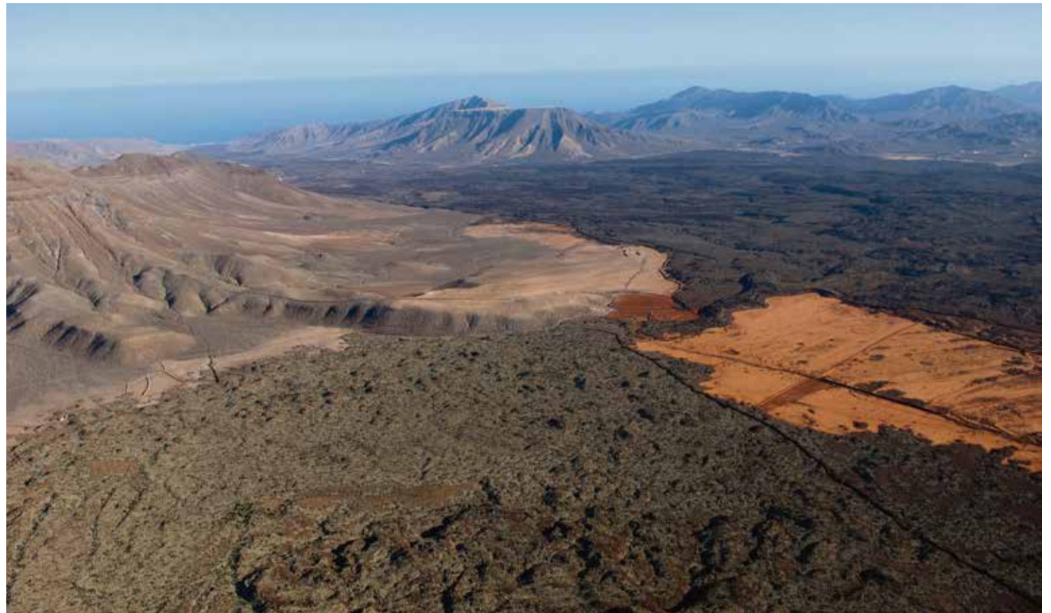
Malpaís de Pozo Negro.

Los cálculos iniciales estiman que puede recibir cada año tres hectómetros de agua de lluvia y que el coste para extraerla podría ser de unos cuatro millones de euros