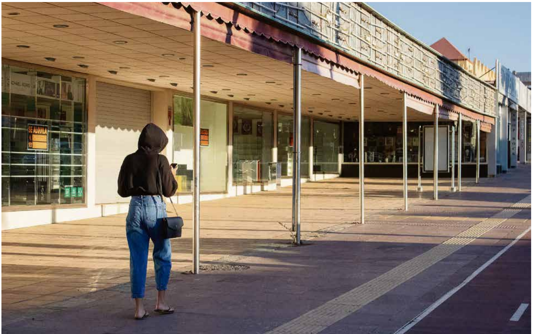
Negocios cerrados en la localidad de Corralejo.