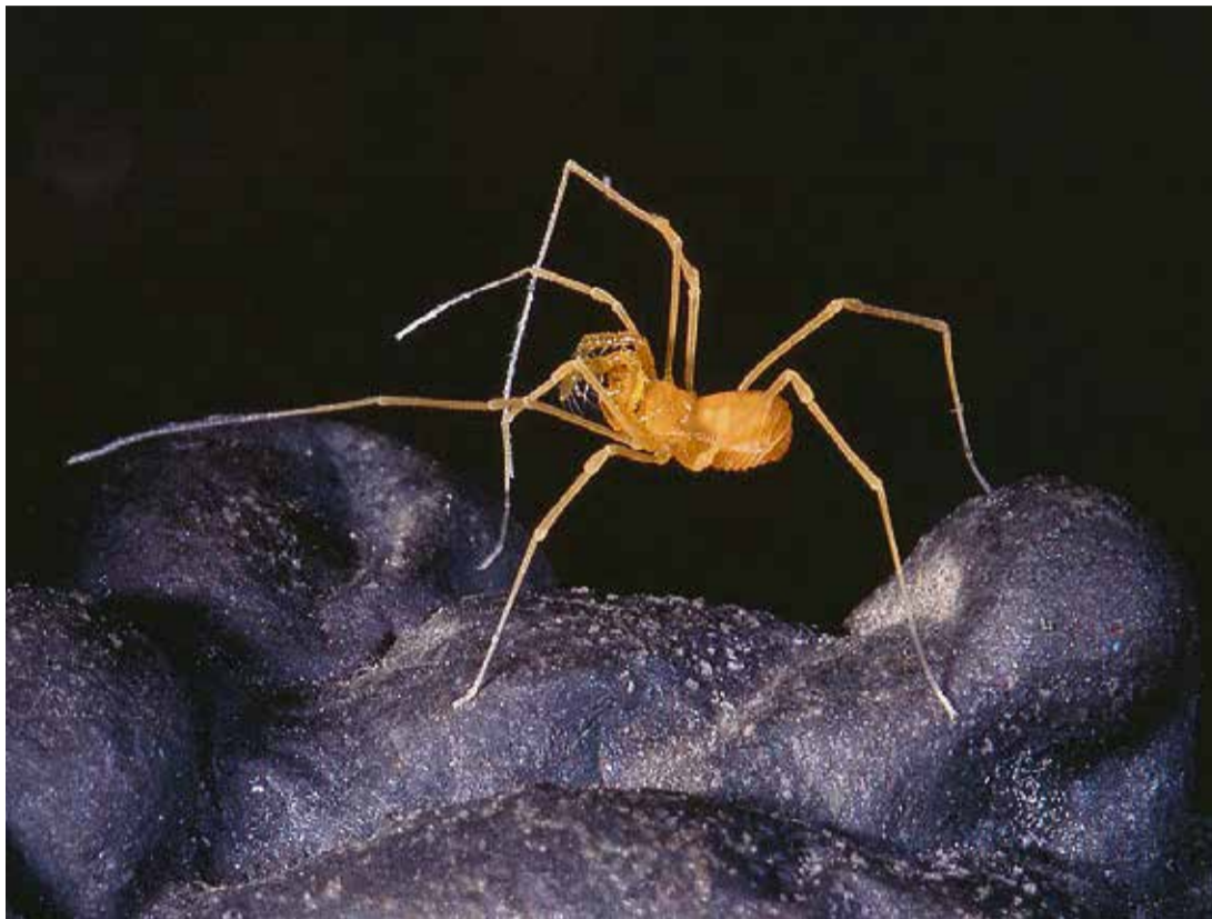
El opilión majorero, un animal clave para estudiar cómo evolucionan y se adaptan los seres vivos.

Mide poco más de dos milímetros y es un arácnido único en el mundo, que sólo se ha hallado en la Cueva del Llano. Su existencia revela información esencial sobre la adaptación y la evolución de los seres vivos. Amenazado por operaciones urbanísticas que han vulnerado las leyes que protegen la biodiversidad, el Gobierno de Canarias dice que quiere garantizar su supervivencia.