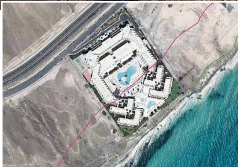
Sobre estas líneas, el Hotel Royal Palm, con 329 habitaciones. A la izquierda, parte del complejo en servidumbre de protección de Costas.

ra del procedimiento abreviado, previa al juicio oral, la magistrada María Isabel Quintero resume cinco irregularidades de la “extensa” prueba documental que forma parte de la causa. Una de ellas es que “la servidumbre de protección” de Costas, que en esa zona de Butihondo es de 100 metros, “afectaría de lleno al hotel”.