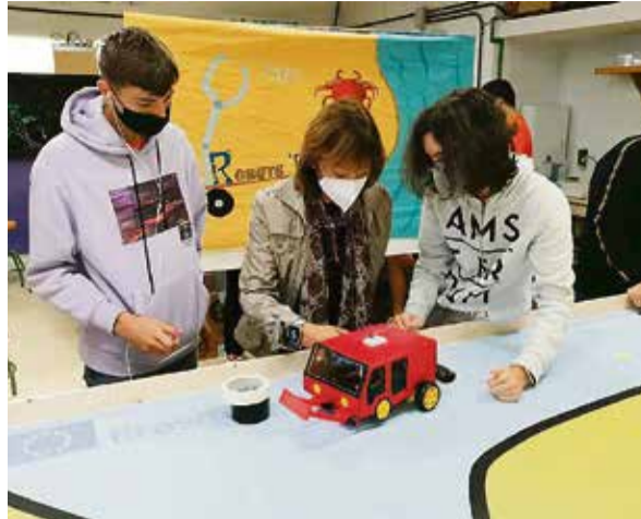
Programa Erasmus de Robótica del IES Puerto del Rosario.

Para el profesor, “este ha sido un curso complicado, con las clases de Bachillerato trasladadas a la tarde, muchos programas extraescolares suspendidos y demasiadas normas nuevas para los alumnos. Sin embargo, han respondido muy bien, no se quejan de la mascarilla, la usan siempre, y se portan fenomenal”. Del Baño cree, incluso, que los estudiantes de Bachillerato han trabajado más y mejor en el horario de tarde, más silencioso: “Les he visto muy centrados, a pesar de la repen-