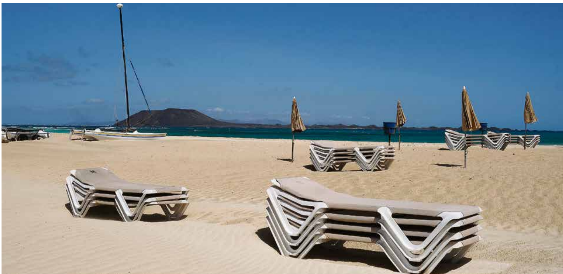
Playa de Corralejo completamente vacía.