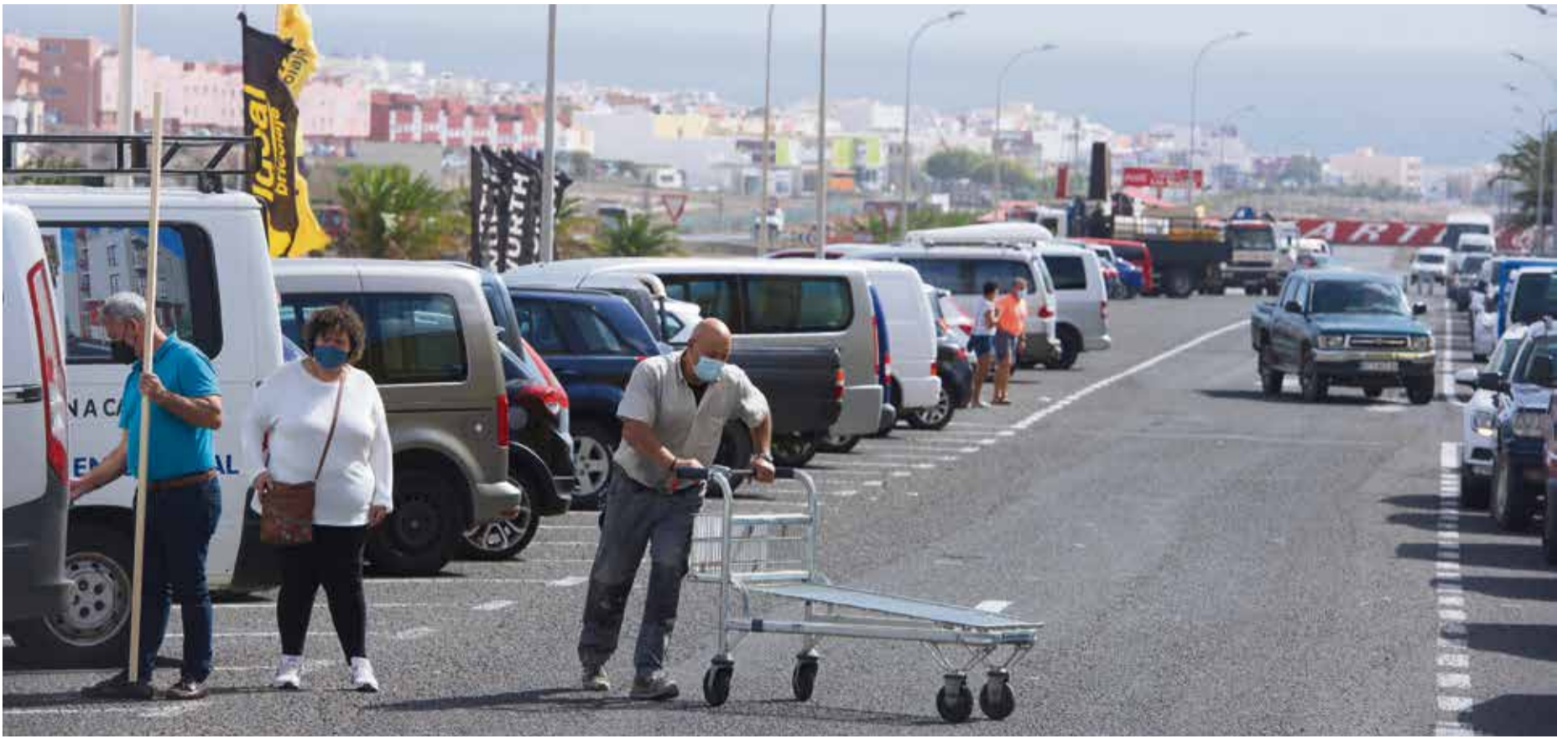
Polígono industrial Risco Prieto.