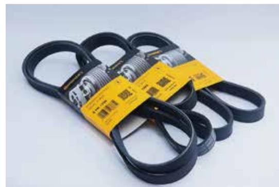
Autorecambios Gil apuesta por la calidad en su amplio catálogo de repuestos para el automóvil.