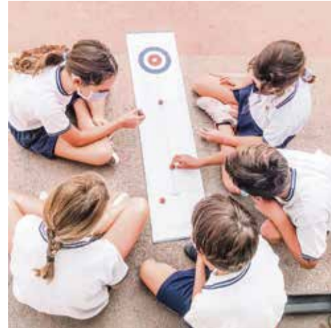
Alumnos del CEIP Lajares.