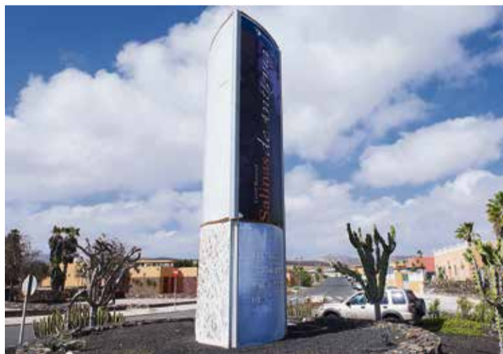
Un cochambroso obelisco da la bienvenida al resort.

Los vecinos de la urbanización en Caleta de Fuste, creada como resort del campo de golf y aún sin finalizar, se unen en la lucha para que el residencial pueda salir del abandono