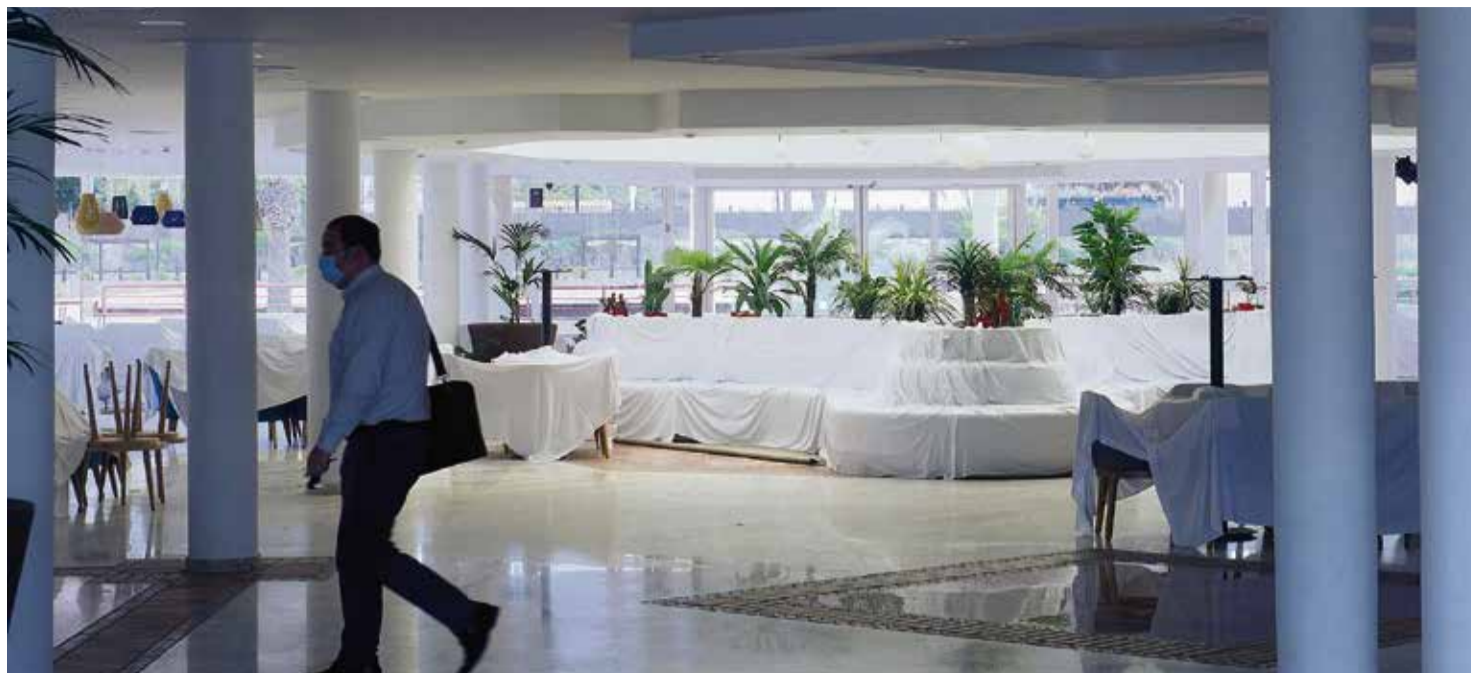
Interior del hotel Barceló Corralejo Bay.

reservas, pero actualmente no se está materializando. Las ventas están abiertas, pero las reservas llegan a cuantagotas. En estos momentos, el número de reservas para la temporada de verano en estos dos hoteles oscila entre el 18 y el 20 por ciento, aunque desde los Princess son conscientes de que habrá muchas cancelaciones de última hora.