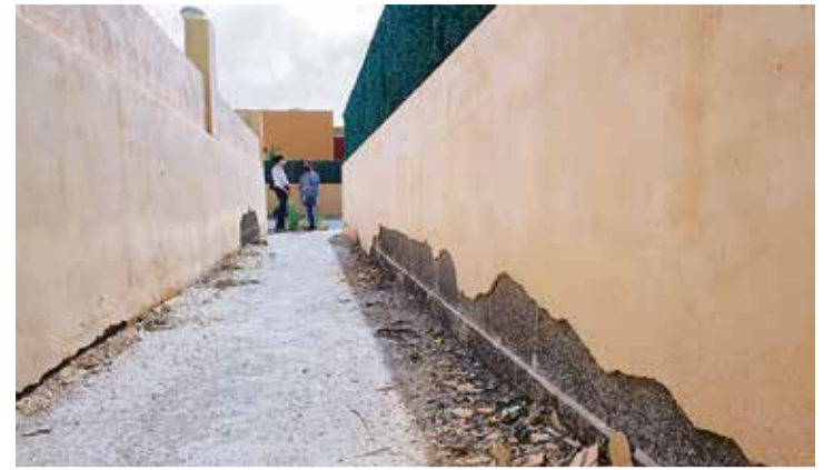
Un callejón que ni los gatos desean.