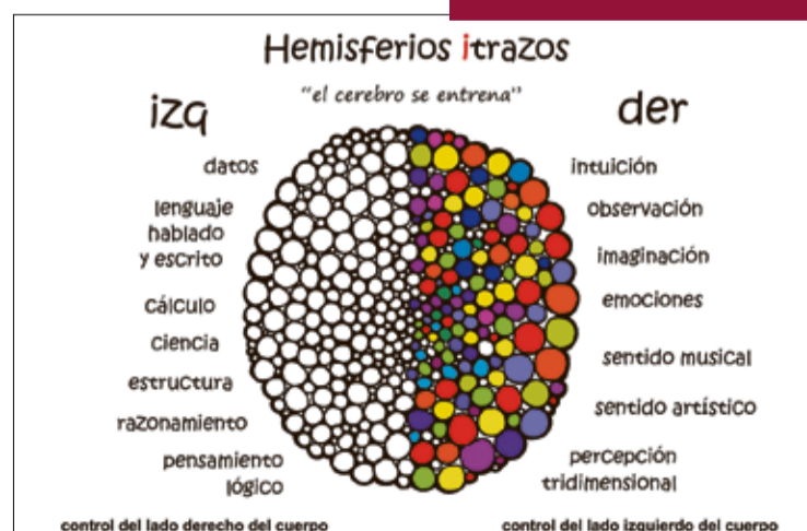
Funciones de cada uno de los hemisferios cerebrales.

Las actividades se desarrollan a través del método de fichas, “utilizando una de las formas que nos da el arte para expresarnos y crear: la línea de trazo”, señala Dori Alessio. Lo que propone con su programa de arteterapia es trabajar el lado “no habitual” del cuerpo.