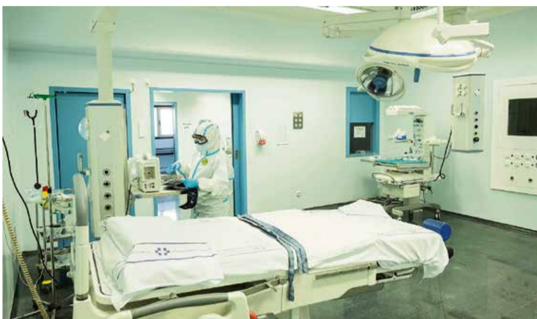
La matrona tiene que trabajar sola en quirófano, salvo que se complique el parto.

un nacimiento de un bebé con malformación que fallece horas o días más tarde”, expone la matrona, y agrega que esos son sólo algunos de los numerosos casos que se pueden dar. “Muchas mujeres se van a casa con el dolor, lo sufren en silencio e, incluso, se esconde este dolor en la sociedad; por eso tenemos que darle visibilidad y enseñar que se debe tratar”, insiste la matrona. La consulta supone un avance en el Hospital de Fuerteventura, que ha logrado sacarla adelante con la voluntad y esfuerzo de las profesionales sanitarias.