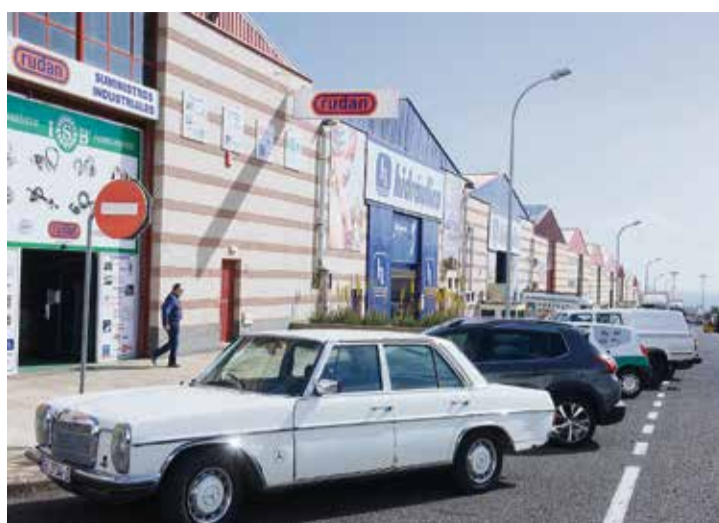
Una de las calles principales del polígono.

“Otro propósito”, explica, “es que las naves que se han quedado fuera del polígono, tanto en la parte alta como en los alrededores, se incluyan en el Ente ur-