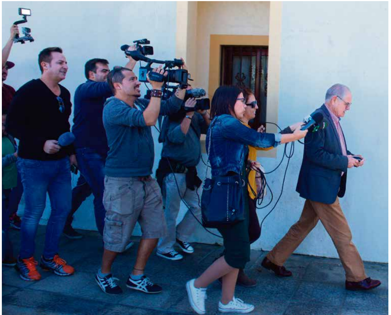
Domingo Gonzalez Arroyo, en su última etapa en la alcaldía de La Oliva.

El modus operandi descrito por la Fiscalía les permitió omitir, “con evidente perjuicio” para la Hacienda pública estatal, los ingresos que realmente tendría que haber efectuado la empresa: 218.924 euros en el año 2009 y 188.696 euros en el año 2010. Por el presunto fraude del último ejercicio está también acusada la propia sociedad, Calaofu SL, al entrar en vigor ese año la reforma del Código Penal que estableció que las mercantiles también podían ser responsables de delitos.