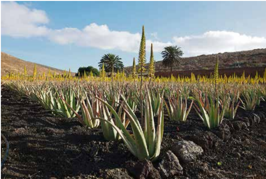
El cultivo de aloe vera en la Isla ha descendido, mientras proliferan las tiendas de 'falso' aloe canario.