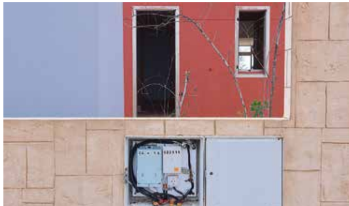
Una ventana al vandalismo.