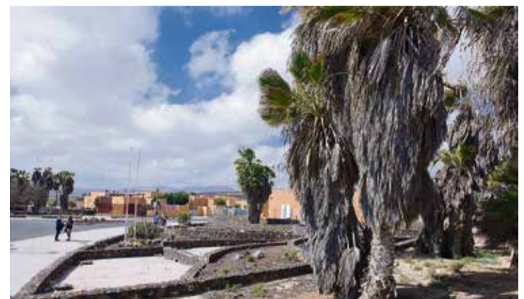
Palmeras enfermas por los años sin mantenimiento.

sus filas. Animan a los residentes a incorporarse a la propuesta, “sin coste y sin esfuerzo”. Serán los representantes de este nuevo colectivo quienes asu-