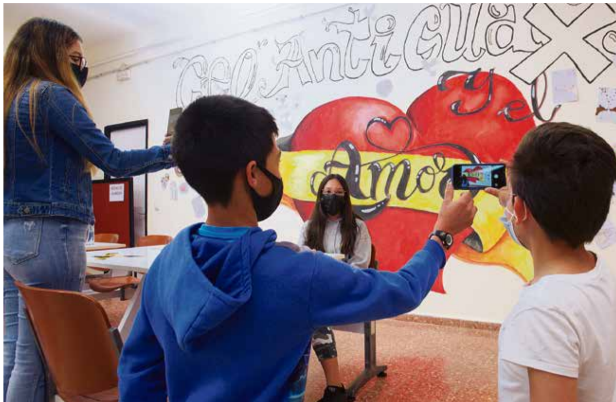
Alumnado participante del proyecto ‘Aprendiendo en un click’, durante la actividad.

El CEO Antigua pone en marcha este curso ‘Aprendiendo en un click’, iniciativa que promueve el uso de la fotografía