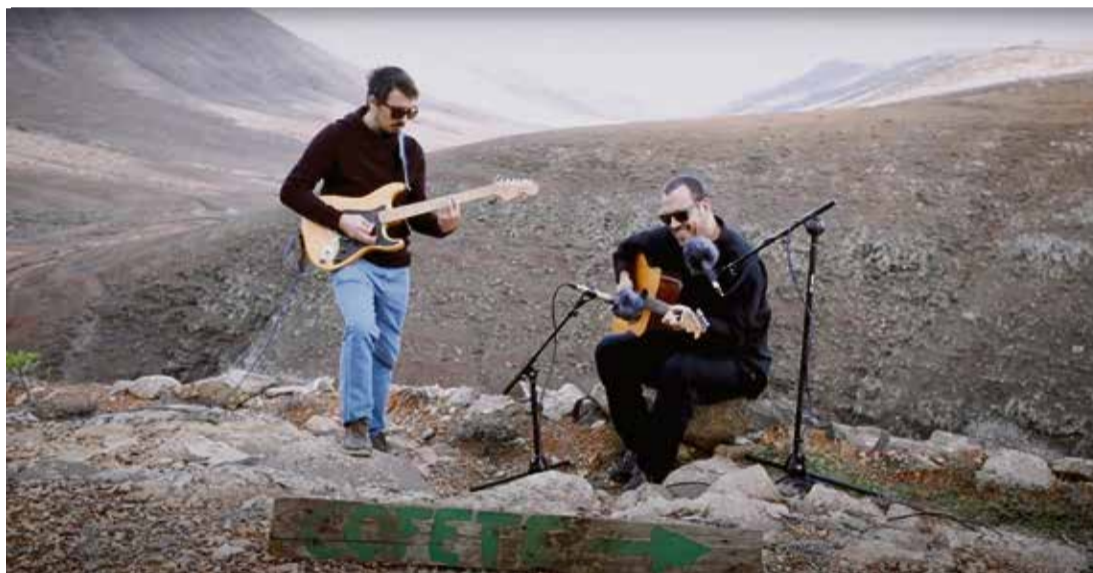
El primer tema de D'Vaso ha sido grabado por Acústicos Puipana, proyecto que pone en valor a los creadores grabándolos en parajes naturales de las Islas.

Échale'engó, creada por los miembros de Guineo en 2016 y, desde ahí, continuar defendiendo la idea de la música como herramienta de transformación.