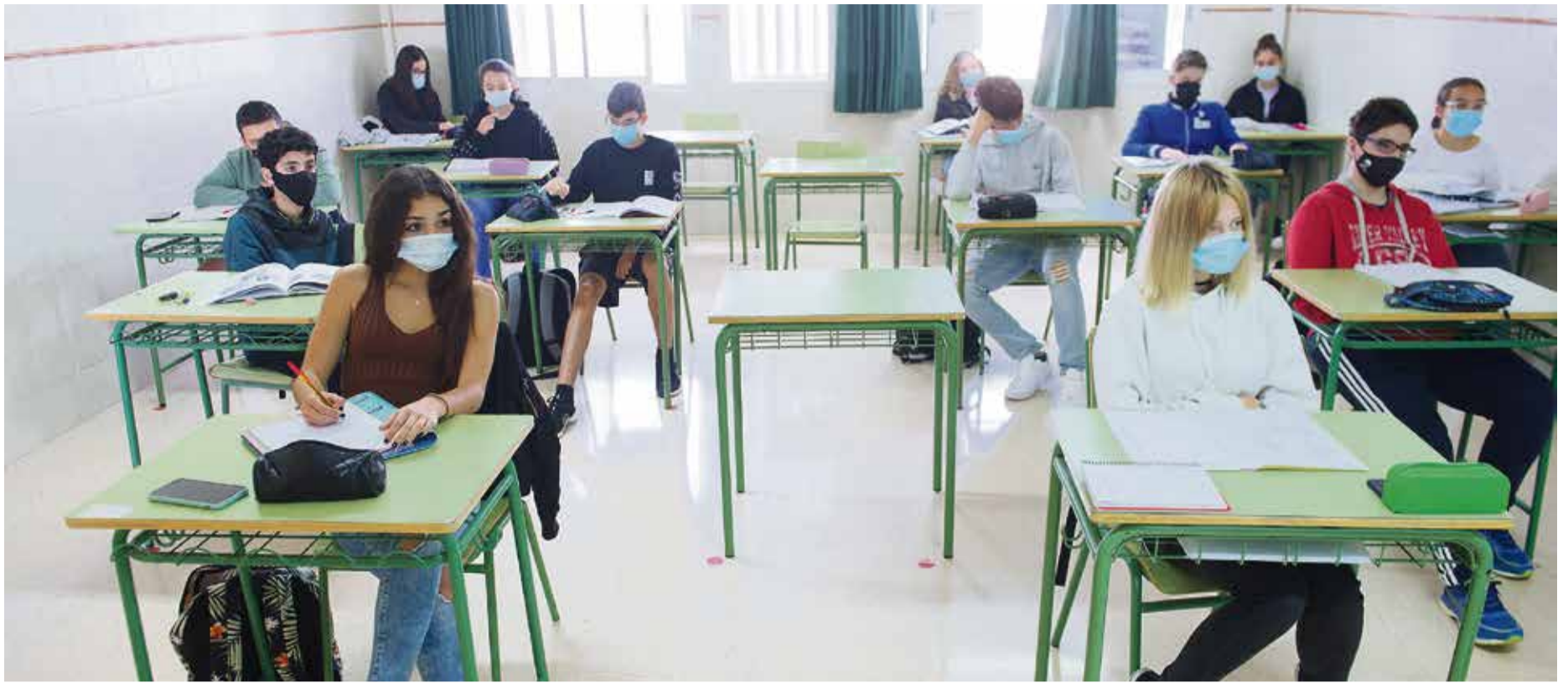
Clases de francés en el IES San Diego de Alcalá.