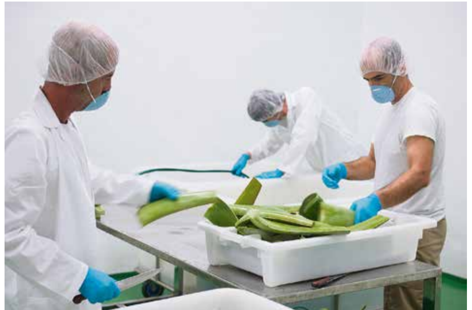
Centro de transformación de Vidaloe en su finca de Agua de Bueyes.

frenta este cultivo en Canarias la tienen los propios productores: “Nos vemos como competencia entre nosotros. Hace falta una visión global, en la que tengamos claro que nuestro oponente son las firmas que venden productos asegurando que proceden de cultivos canarios. Es un engaño al cliente. No pueden pretender que la producción de China se equipare a la del Archipiélago en cualidades, algo que, en definitiva, puede ser contraproducente al crear el consumidor que esa calidad inferior que adquiere es la que se produce en las Islas”. Los beneficios de estos “falsos” productos de aloe canario se verán reducidos considerablemente.