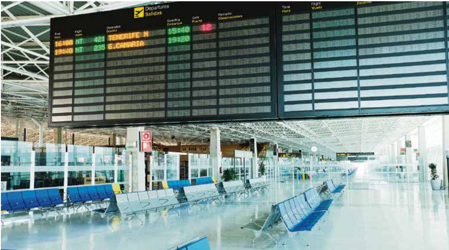
La cancelación de vuelos ha dejado el aeropuerto prácticamente sin actividad.

cando una gran explosión de la construcción y el comercio. Dinero fácil y rápido corría por dos ínsulas ancestralmente muy pobres. Fue también el momento del nacimiento de los grupos ecologistas locales, cuando las voces críticas con los excesos del turismo de masas se empezaron a escuchar más.