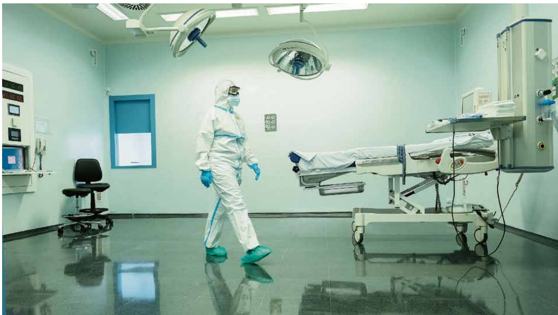
Paritorio COVID, en Maternidad del Hospital Virgen de la Peña.