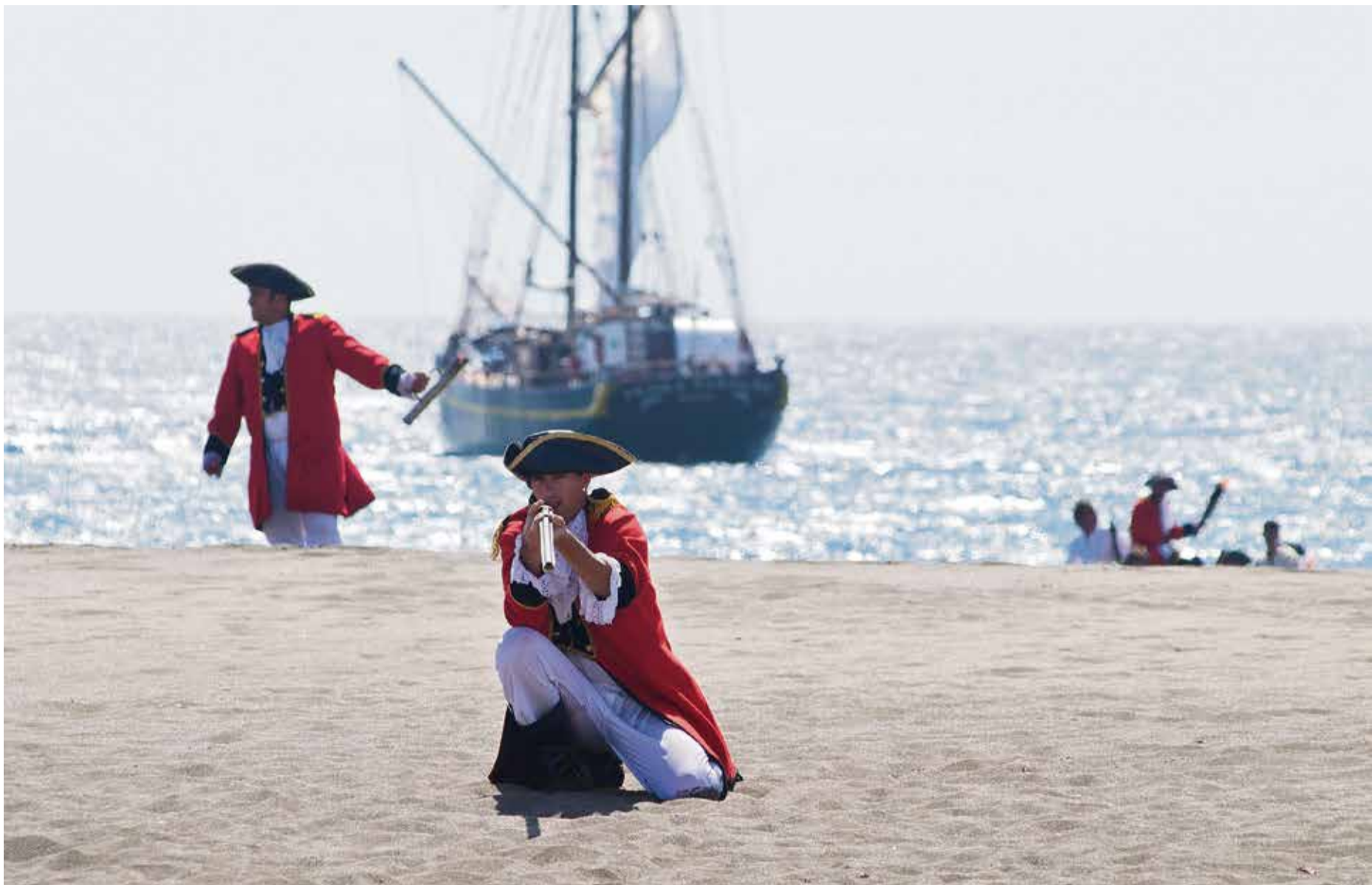
Recreación de la Batalla de Tamasite en 1740, en Tuineje.