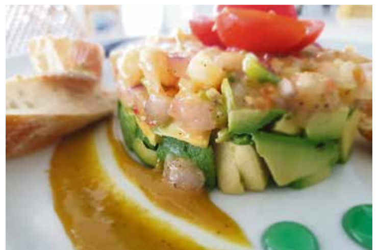
Otro de los platos con Gamba de Corralejo como ingrediente principal es el tartar.

“Es un lujo contar con un producto de esta calidad asociado a Corralejo”