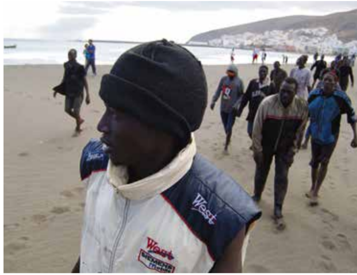
Llegada de inmigrantes a Gran Tarajal.

La patera llegó a Las Playitas. De ahí a la comisaría de Puerto del Rosario, donde estuvo una semana y, luego, al furgón que los llevaba al viejo aeropuerto. Tuvo la suerte de llegar cuando aún no se habían producido los primeros episodios de hacinamiento.