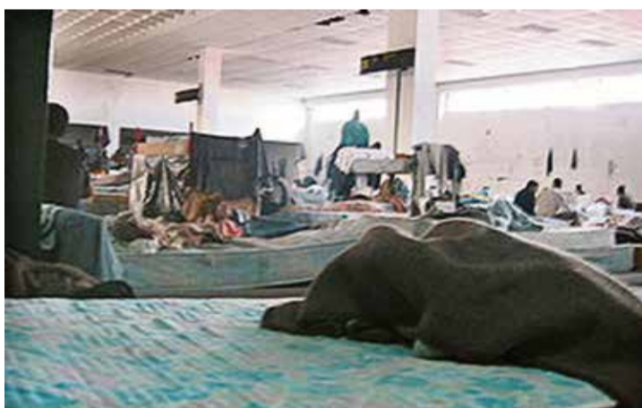
Interior de la antigua terminal del aeropuerto: Foto: MSF.

ces, los titulares de la prensa lo ocupaban no solo la llegada de barquillas sino la situación y la vulneración de derechos que sufrían las personas encerradas en la terminal del aeropuerto, un espacio que la prensa y las organizaciones humanitarias llegaron a bautizar como Guantánamo 2 .