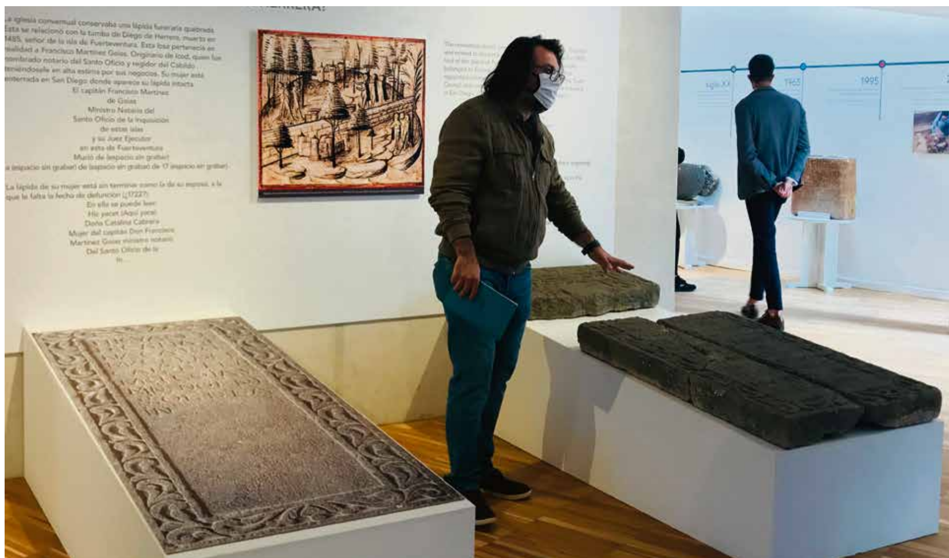
La historia de Diego de Herrera en la exposición 'Betancuría, la fe en la piedra'.