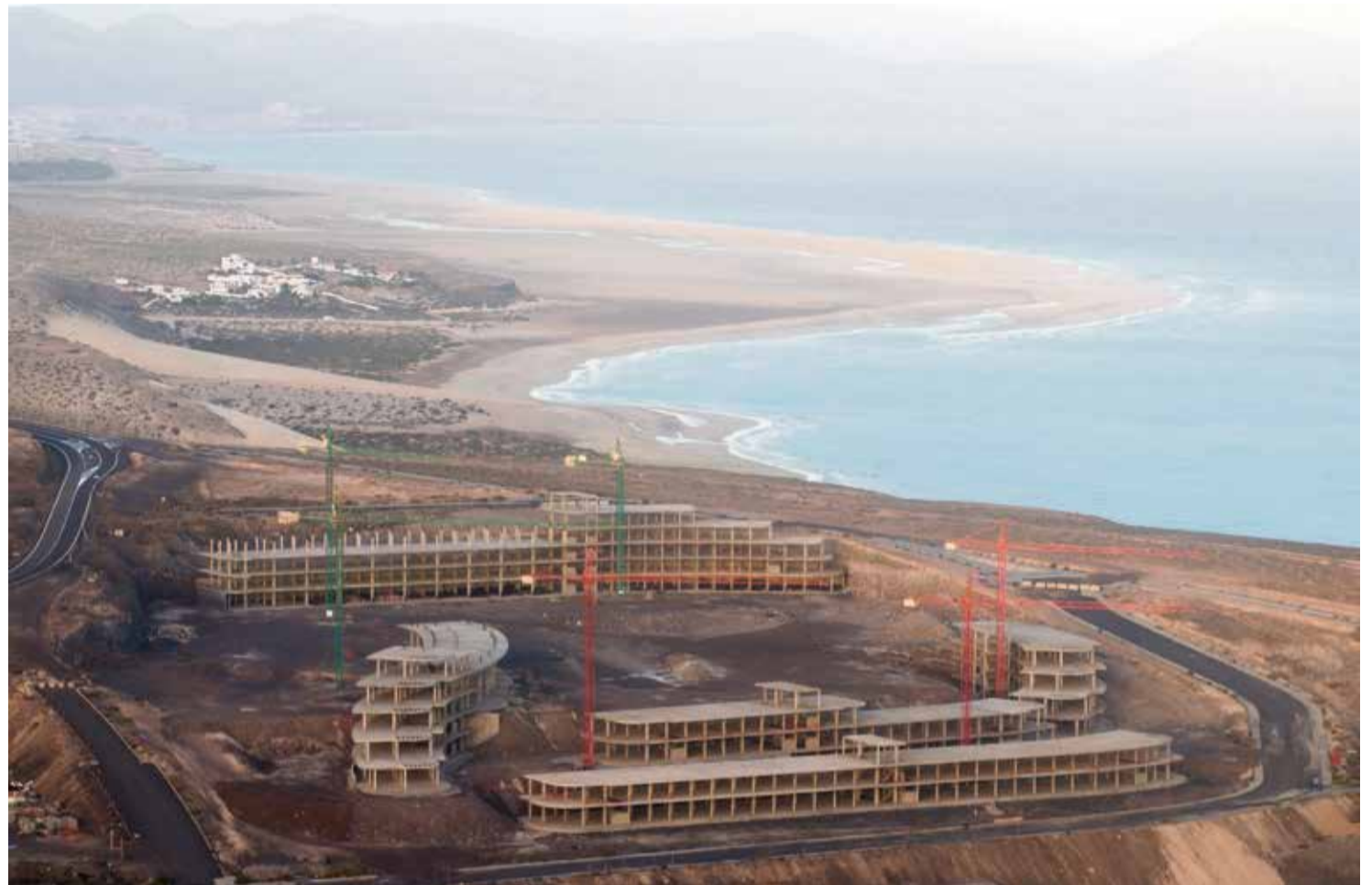
Esqueleto de un hotel paralizado en el plan parcial Canalbión.

Más de 5,7 millones de metros pasan de urbanizables a rústicos en Matas Blancas, Costa Calma, Canalbión o Morro Jable, con piezas de alto interés empresarial