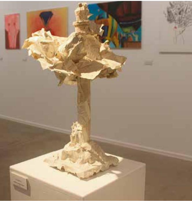
Obra del artista Zebensui Armas Godoy.