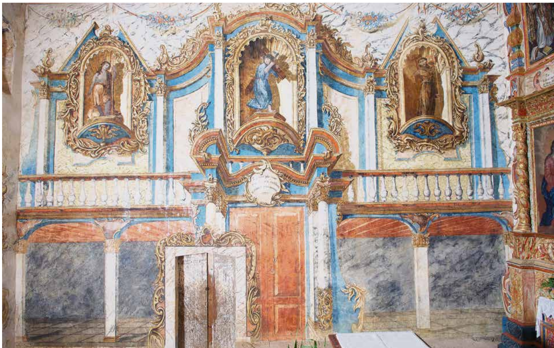
Pinturas murales de la ermita de La Ampuyenta realizadas en las últimas décadas del siglo XVIII.