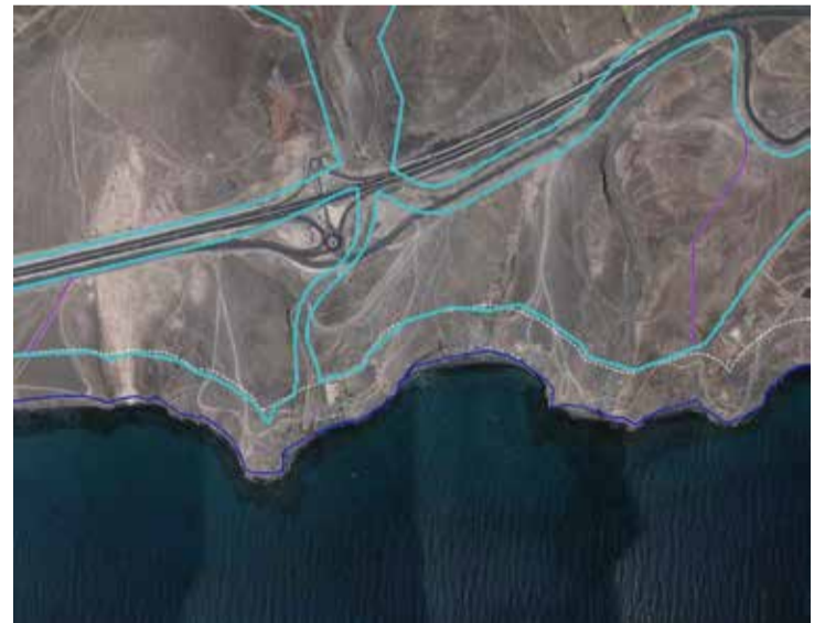
Terrenos donde estaba previsto construir en Matas Blancas, junto a Costa Calma.