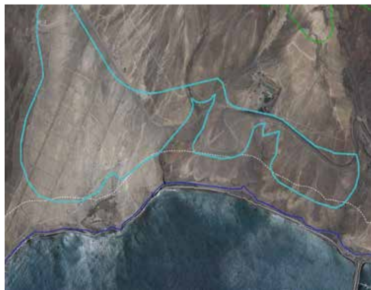
Ámbito de la urbanización desclasificada Tablero del Moro, en Morro Jable.

bolsa de suelo urbanizable –denominada SUNP3– de más de un millón de metros cuadrados, que ha pasado a ser rústica y se divide en tres partes. Una de ellas, donde se encuentran los hoteles H10 Playa Esmeralda y R2 Pájara Beach, tiene todas las parcelas edificadas salvo una, precisamente entre ambos es-