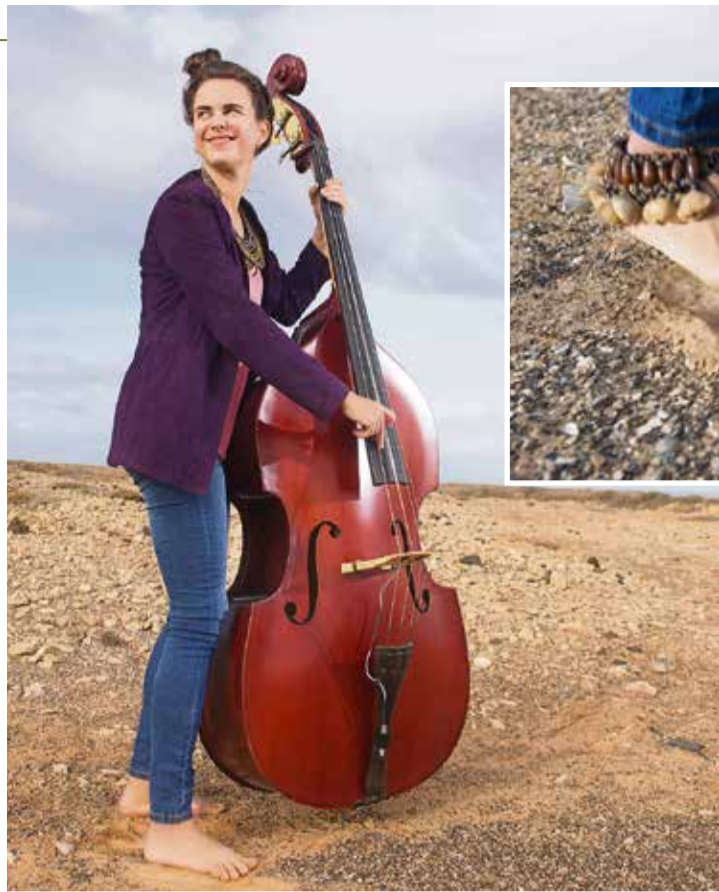
En ‘Temas propios’ se oyen tipples, tambores y hasta el sonido que desprende el picón.

Aceysele inició el duelo en pleno confinamiento. Encerrada en su casa de El Cotillo, empezó a digerir la nueva situación. Llegaba el momento de comenzar en solitario su carrera musical y continuar con aquella aventura que inició con 15 años en el garaje de su casa. “Me di cuenta de que me tenía que adaptar a la