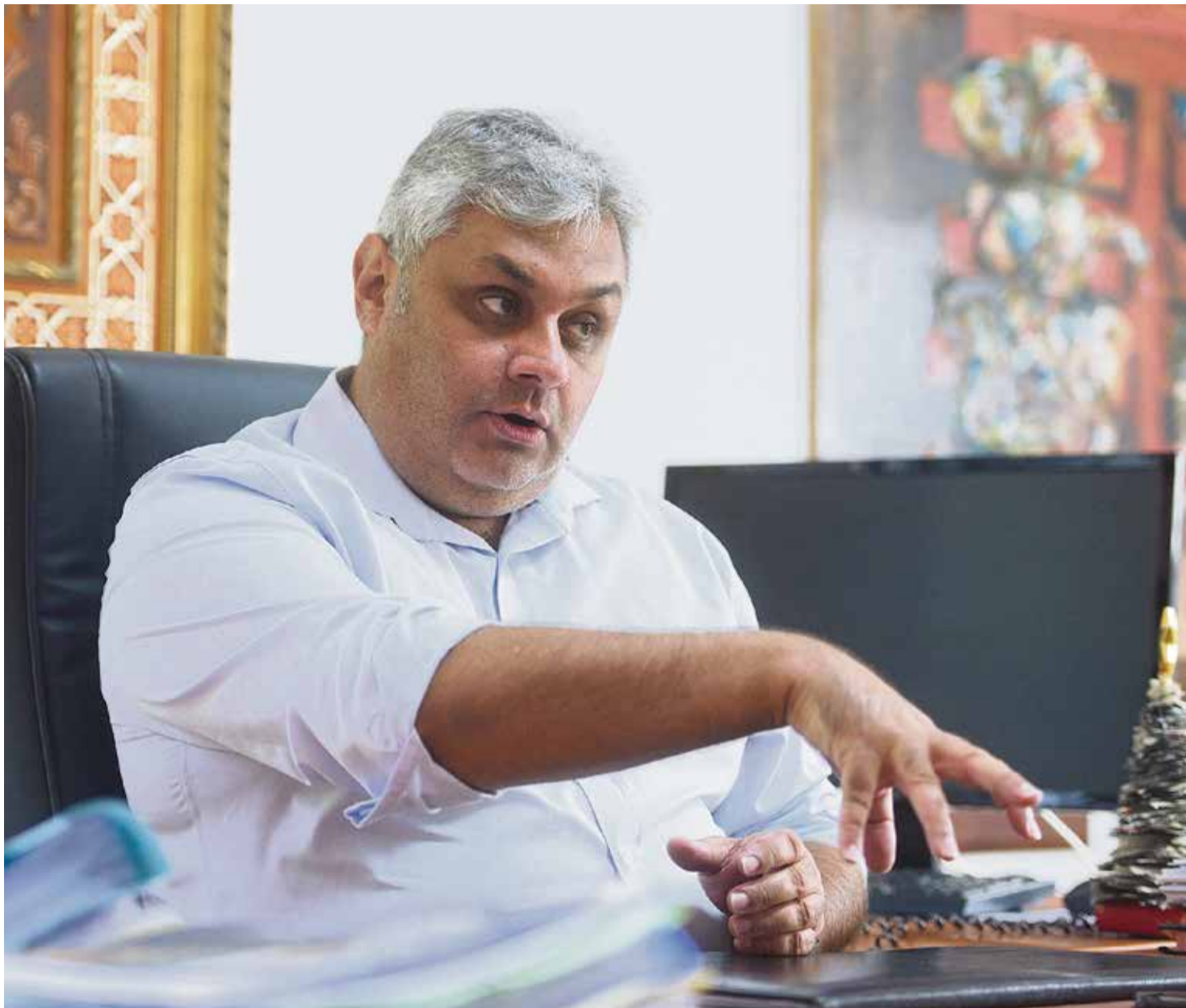
El alcalde de Puerto del Rosario, durante la entrevista.