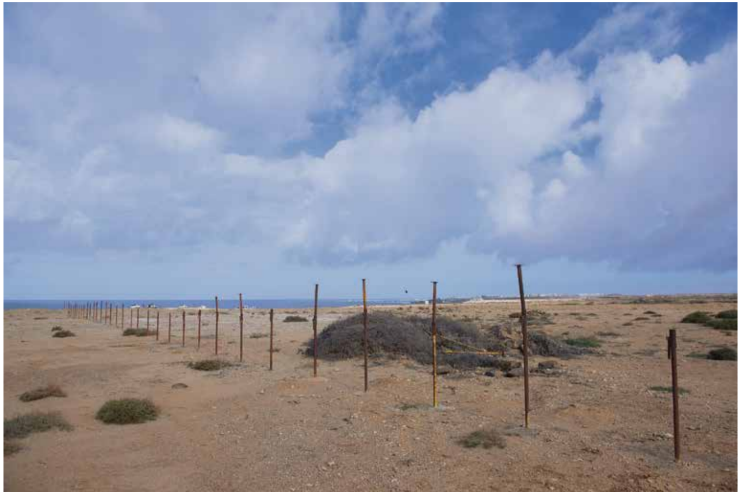
Terrenos en El Cotillo donde se pretende instalar un camping turístico.

En el nuevo Plan General de Ordenación (PGO) de La Oliva, añade el Ayuntamiento en sus alegaciones, se quiere habilitar un espacio para camping, pero “en las cercanías del propio pueblo, cerca de la conocida urbanización Cotillo Lagos”, una localización que no afecta a ninguna Zona de Protección de Aves. Además, agrega la institución, las “tradicionales acampadas” en puntos de la costa norte se pretenden “delimitar y regular” con la Demarcación de Costas y el Cabildo.