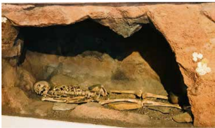
Recreación del enterramiento funerario de la cueva de Solapa del Cuchillete.

rigen de Fuerteventura que califica de “excepcional”. Como novedad, tras analizarse las tapas encontradas, que se pensaba que eran de arenisca, “se ha constatado la presencia de cal”. La pregunta que surge es: ¿quién enseñó a utilizarla, aunque no fuera con una combustión alta? “De nuevo, una de las hipótesis es Roma”, puntualiza el director del museo.