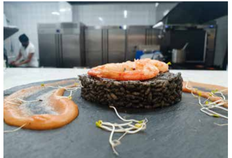
El arroz negro del restaurante La Lonja de Corralejo presentado en la jornada de degustación es otra de las variantes gastronómicas para aprovechar al máximo las posibilidades del camarón soldado.

El “exitoso” arroz negro presentado en la jornada de degustación es otra de las variantes gastronómicas para aprovechar