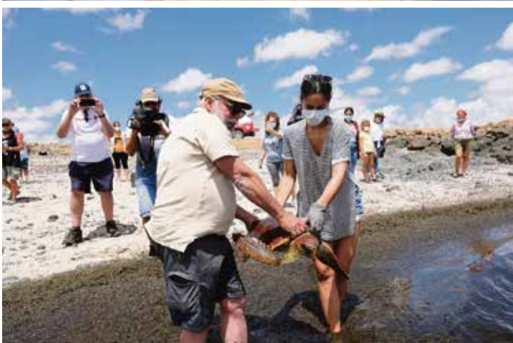
Este verano Avanfuer realizó una campaña de sensibilización en Cofete, con actividades para saber cómo responder ante emergencias como la aparición de cetáceos varados, identificación y seguimiento de nidos de tortugas o muestreo de microplásticos.