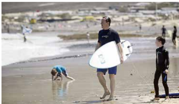
David Cameron, antiguo primer ministro, durante unas vacaciones en Lanzarote.

ser tan fuerte que en Gran Canaria, por ejemplo, no solo tenían sus grandes negocios y comercios, sino también sus propios cementerios, iglesias, hospitales o clubes de tenis, cricket o golf.