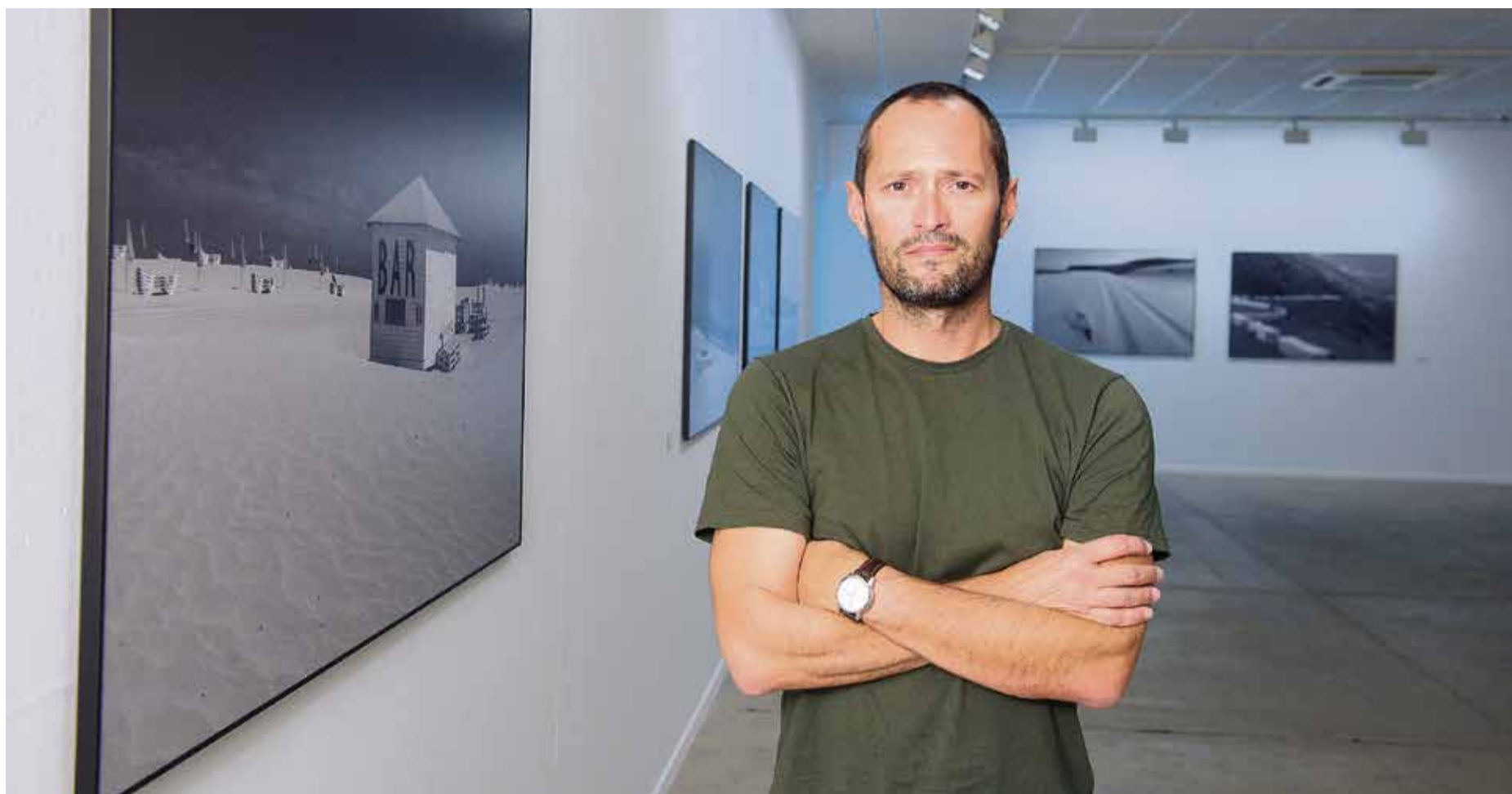
El Centro de Arte Juan Ismael acoge las 19 fotografías en blanco y negro de la exposición de Carlos de Saá.