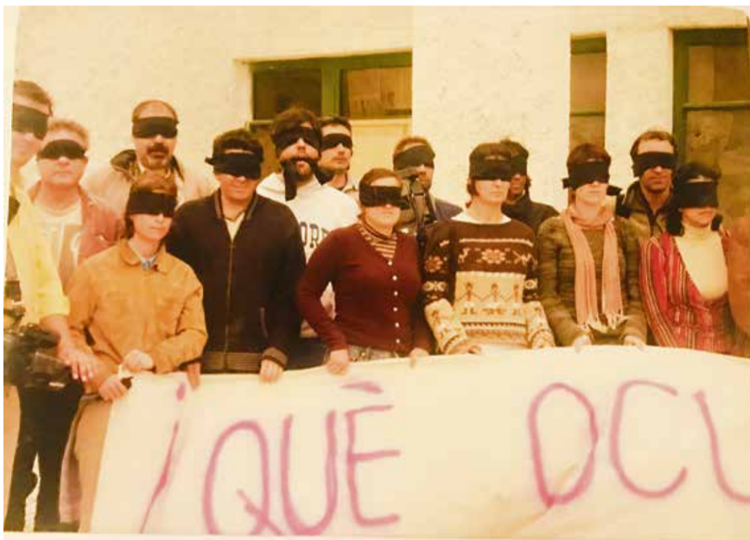
Periodistas manifestándose ante la prohibición de acceder al edificio.

A principios del siglo XXI viajó en varias ocasiones para documentar la llegada de pateras a Fuerteventura. En aquel entonces,