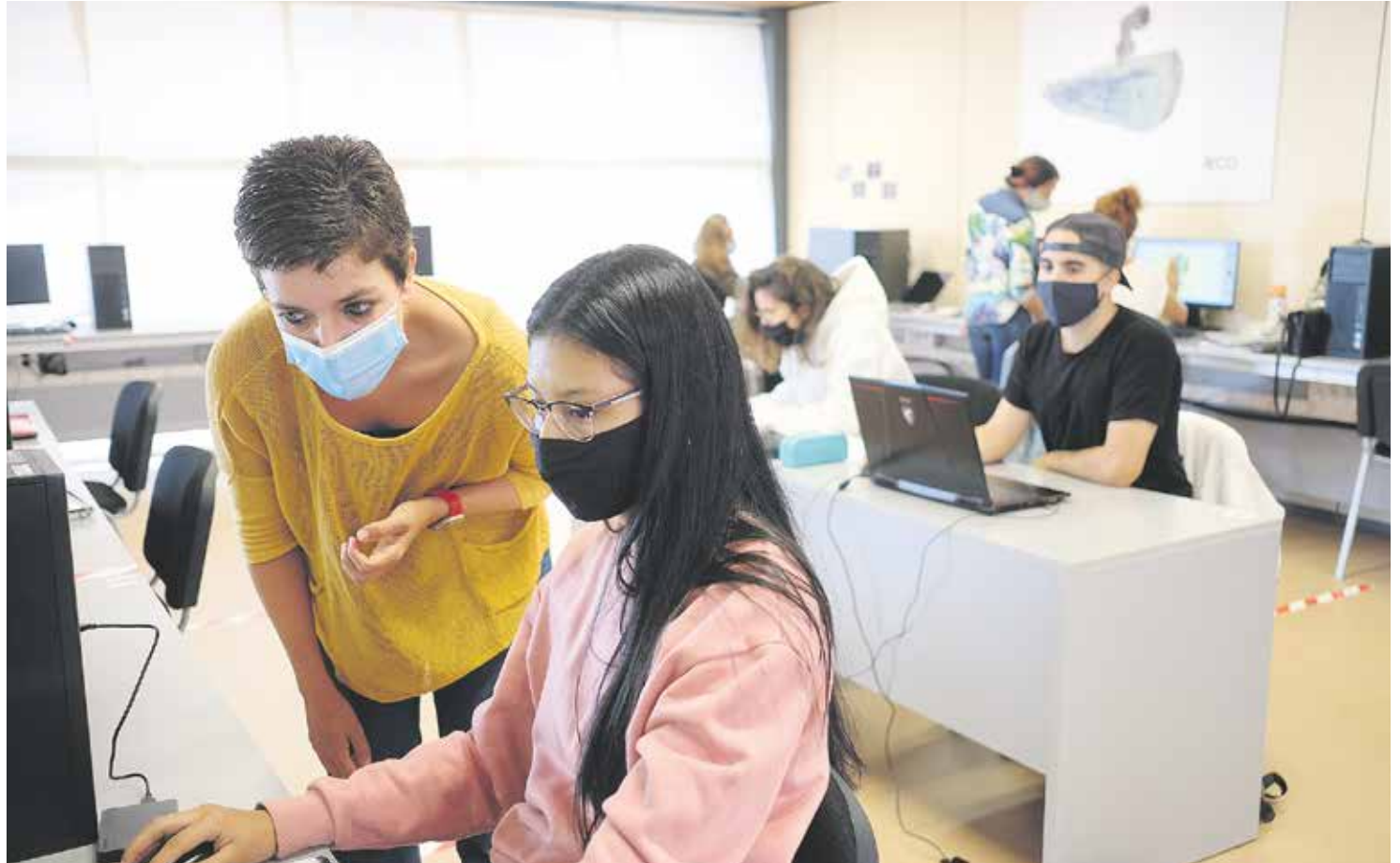
Un total de 187 alumnos ha comenzado este año el tercer curso académico de la Escuela de Arte de Fuerteventura.

También en este curso se afianza el nuevo ciclo de decoración de interiores que se puso en marcha el año pasado. Las