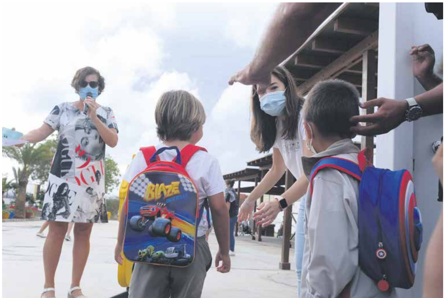
Todos los centros han habilitado en tiempo récord sus planes de contingencia.

El sindicato ANPE critica la falta de material de protección en los centros y pide que los ‘docentes COVID’ de refuerzo permanezcan todo el año