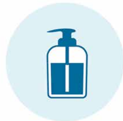
Uso de solución desinfectante