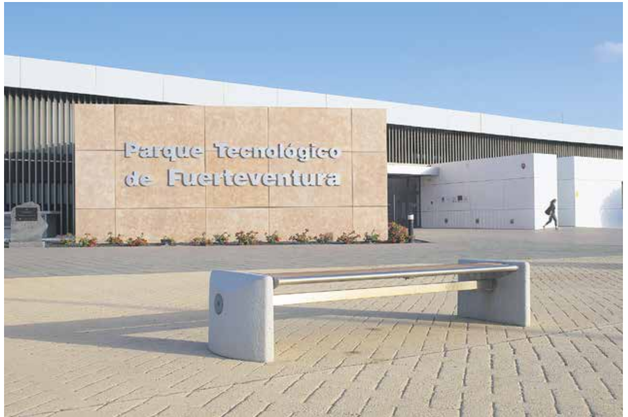
El Parque concurrirá a las consultas de la Xunta de Galicia para proyectos tecnológicos con haps y drones.

Smart Security and Emergencies Center' (ISSEC) del Parque a las nuevas consultas preliminares lanzadas al mercado por la Xunta de Galicia, a través de la Agencia Gallega de Innovación. La Xunta busca definir un nuevo modelo de programación de su 'Civil UAVS Initiative 2021-2025', y el Parque Tecnológico de Fuerteventura concurrirá en el ámbito de los haps (plataformas para pseudosatélites a gran altura) y UAVs (drones).