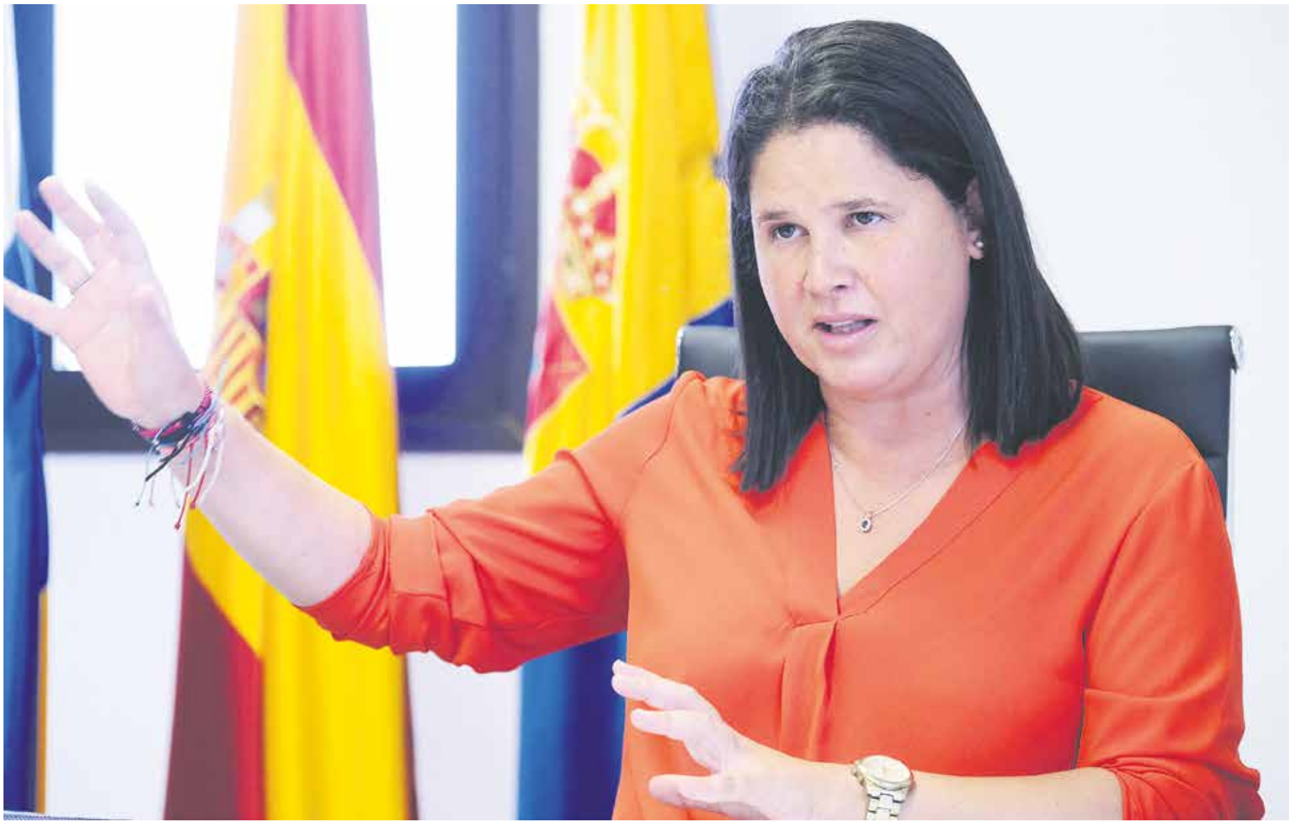
La alcaldesa, en un momento de la entrevista.