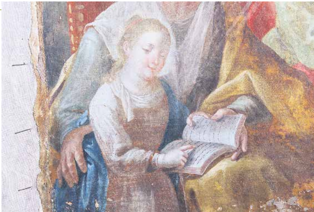
Detalles de Santa Ana con San Joaquín y la Virgen Niña.

“No sabemos qué pasó, pero lo más probable es que no se hi-