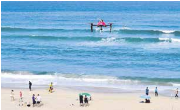
Ya se trabaja en prototipos de salvamento marítimo.