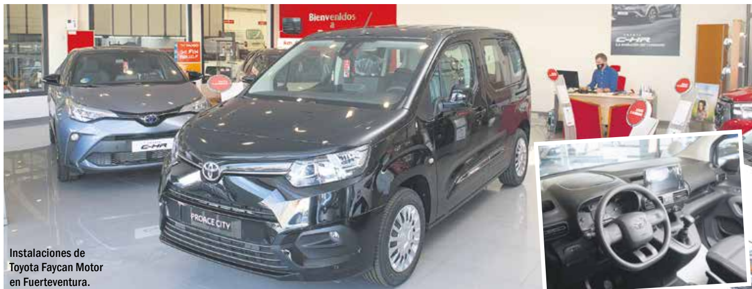
Instalaciones de Toyota Faycan Motor en Fuerteventura.

El vehículo cumple las expectativas de las familias, los deportistas y las empresas