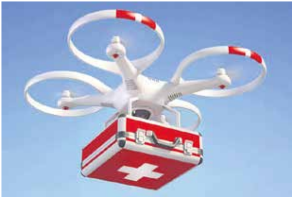
Ejemplo de dron no tripulado, portando ayuda médica.