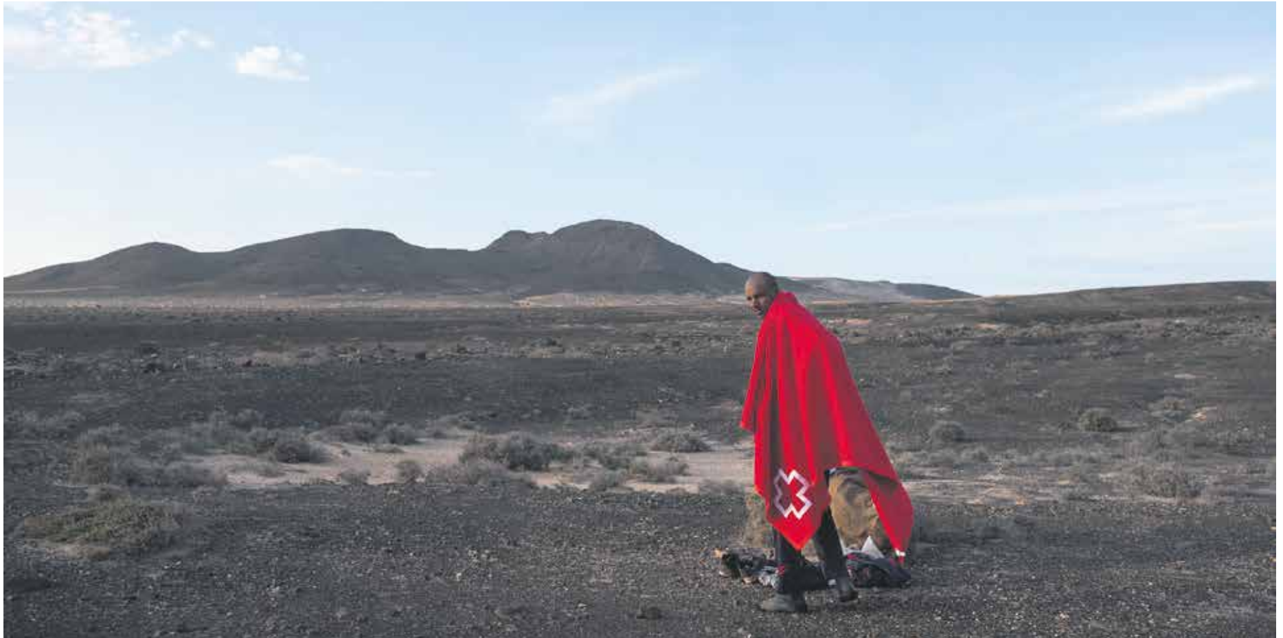
Un migrante, en la Punta de Jandía, tras llegar en patera el pasado 26 de diciembre.

La improvisación en la red de acogida, la falta de recursos y de políticas migratorias marcan la reapertura en la ruta hacia Fuerteventura tras años de ‘tranquilidad’