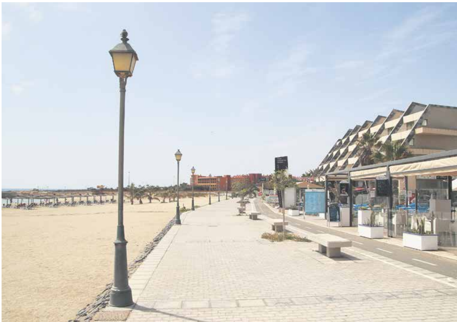
Playa y paseo de El Castillo prácticamente vacíos a finales de septiembre.