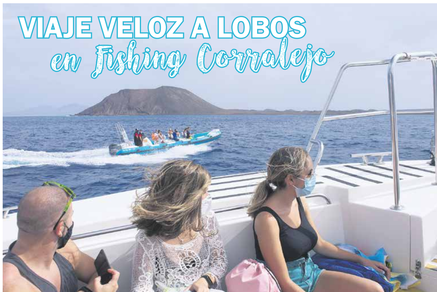
Los trayectos cumplen todas las medidas de seguridad anti-COVID.

“Han reducido la capacidad de carga y sólo podemos llevar un 75 por ciento de ocupación en el barco a Lobos, con las medi-