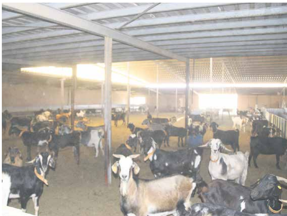
El centro alberga una selección de machos sementales limpios que permitirían perpetuar la raza.

Los avances para depurar la raza y limpiar las cabañas de la Isla precisan de la ejecución de este proyecto para conseguir mejorar la producción lechera