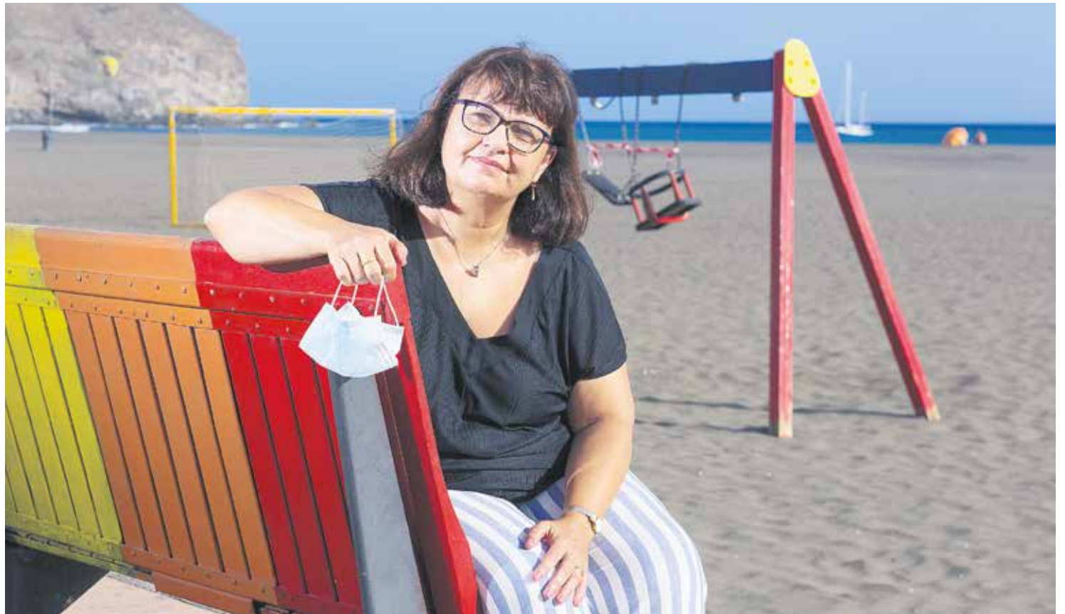
La doctora, en la playa de Gran Tarajal durante la entrevista.

-¿Qué les suele afectar más: una gripe o la COVID-19?