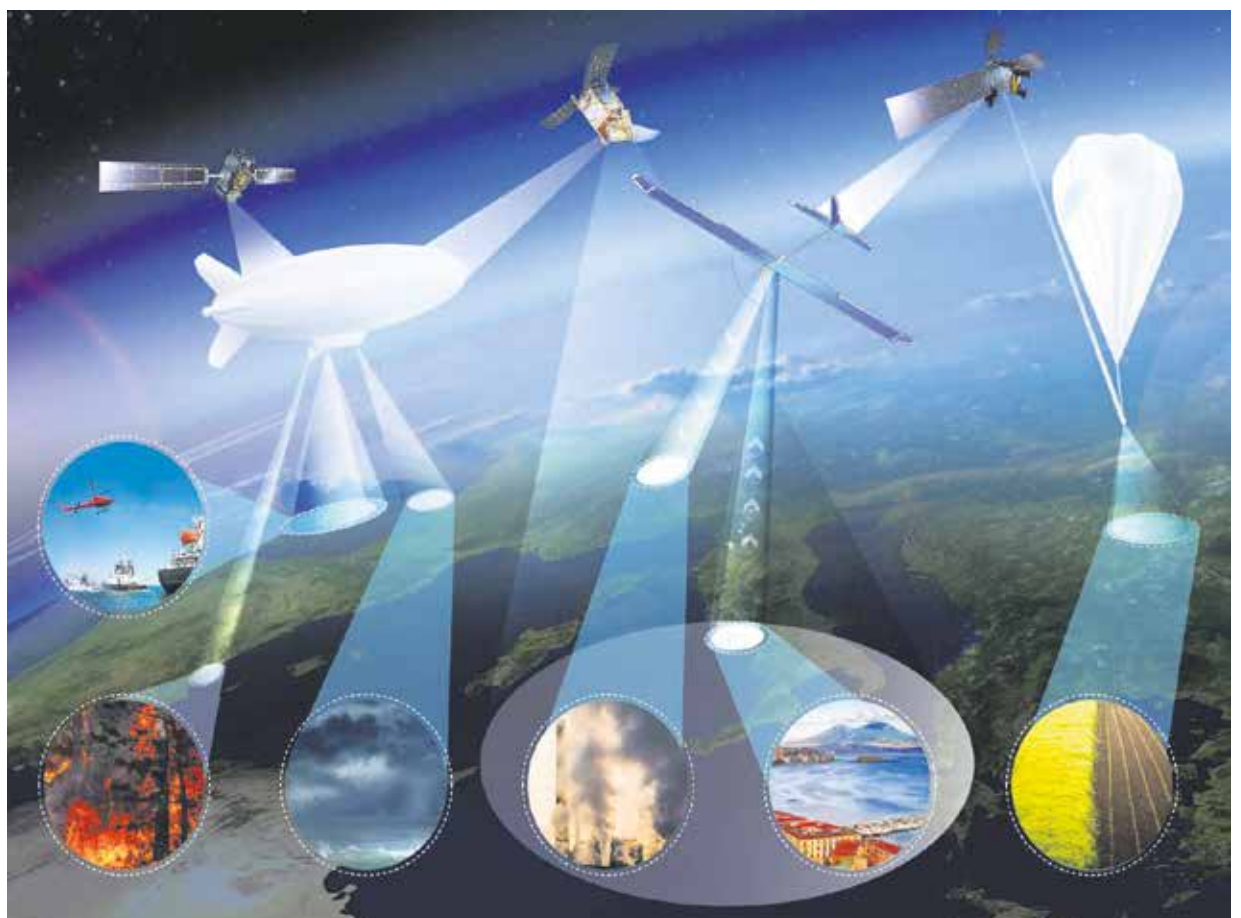
En esta simulación se aprecian las múltiples aplicaciones posibles del proyecto de Stratoport para haps, que posibilita la visión aérea de las actividades en mar y tierra.

Durante los meses de confinamiento, desescalada y en la temporada de verano, el Parque Tecnológico de Fuerteventura ha avanzado en el ambicioso proyecto Canarias Geo Innovation Program 2030, centrado en dar soluciones que conlleven desarrollos de producto innovadores y sostenibles. En el caso de la propuesta majorera, la innovación deriva de la observación del medio aéreo, terrestre y marítimo, a través de diversas tecnologías y fuentes de datos (ópticas, radares, térmicos o hiperespectrales), procedentes de plataformas satélites, aéreas, las llamadas UAV's (drones) y sensores terrestres o marinos, entre otras.