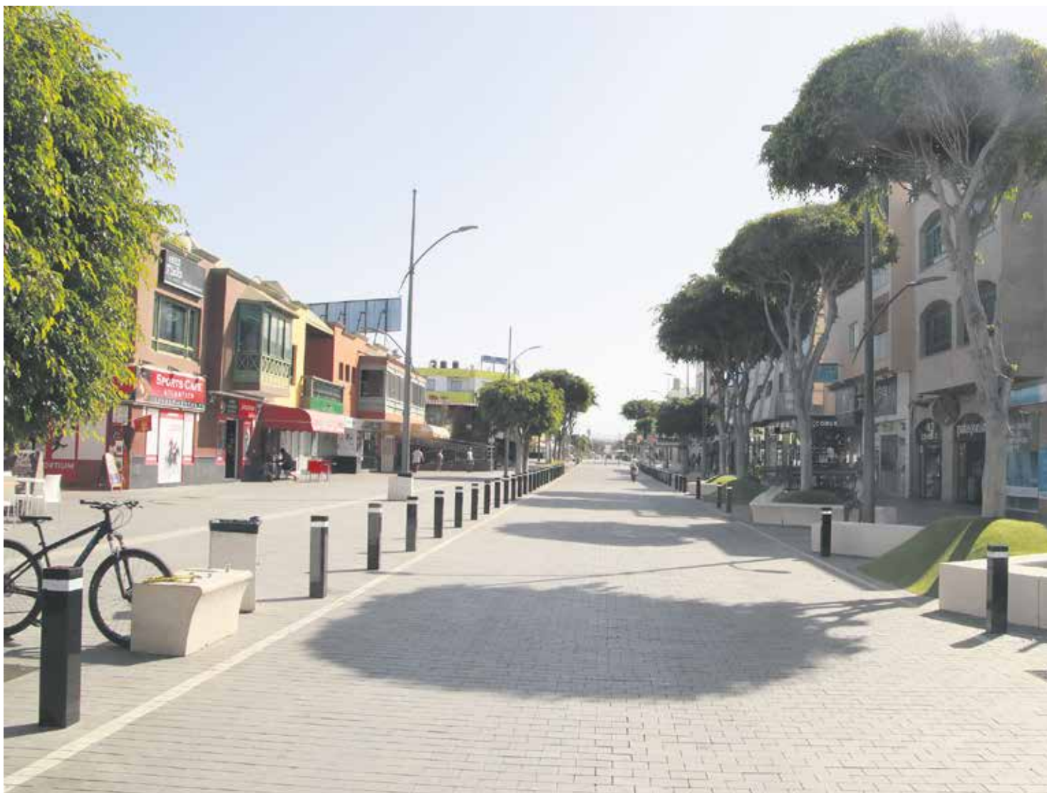
La avenida más turística de Corralejo ofrece una desoladora imagen.

El sector turístico agoniza mientras los escasos empresarios y trabajadores que permanecen activos siguen a la espera de los tan anunciados corredores seguros