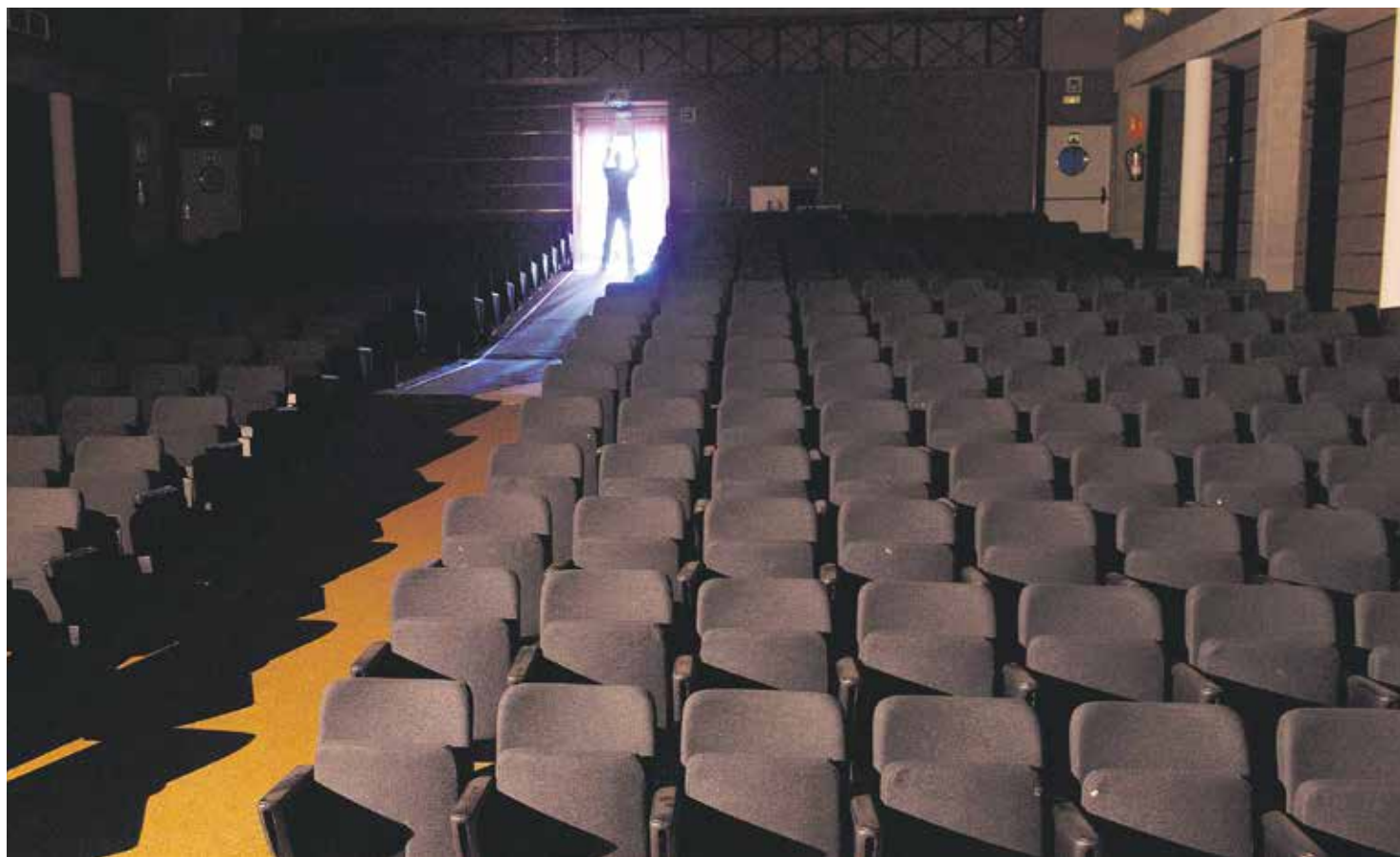
Todos los espacios escénicos de Fuerteventura permanecen cerrados al público.

Aunque el ‘semáforo verde’ de COVID permitía, hasta hace poco, actos con público en la Isla, la Consejería solo programa eventos en ‘streaming’