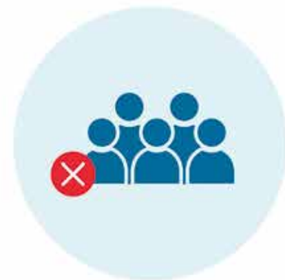
Limite sus contactos