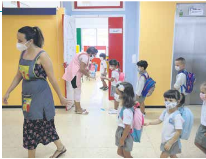
La mascarilla es obligatoria a partir de seis años.

“Sabemos que hay padres que se han negado a llevar a sus hijos al colegio y profesores que se han quejado del riesgo que corren, pero tienen que saber que se trata de la misma realidad laboral que se vive en la empresa privada y en la calle. Es lo que hay”, sentencia la presidenta de