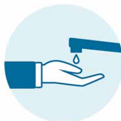
Lavado frecuente de manos