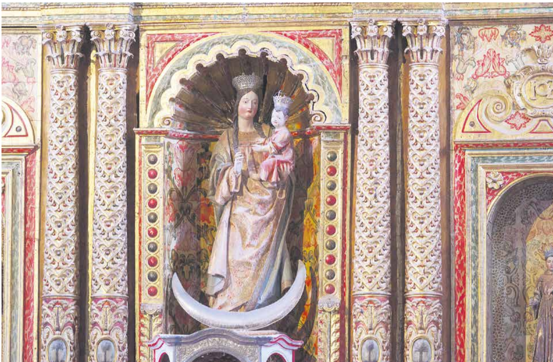
La talla de Nuestra Señora de la Concepción de Betancuria recuerda el estilo del retablo mayor de la Catedral de Sevilla.