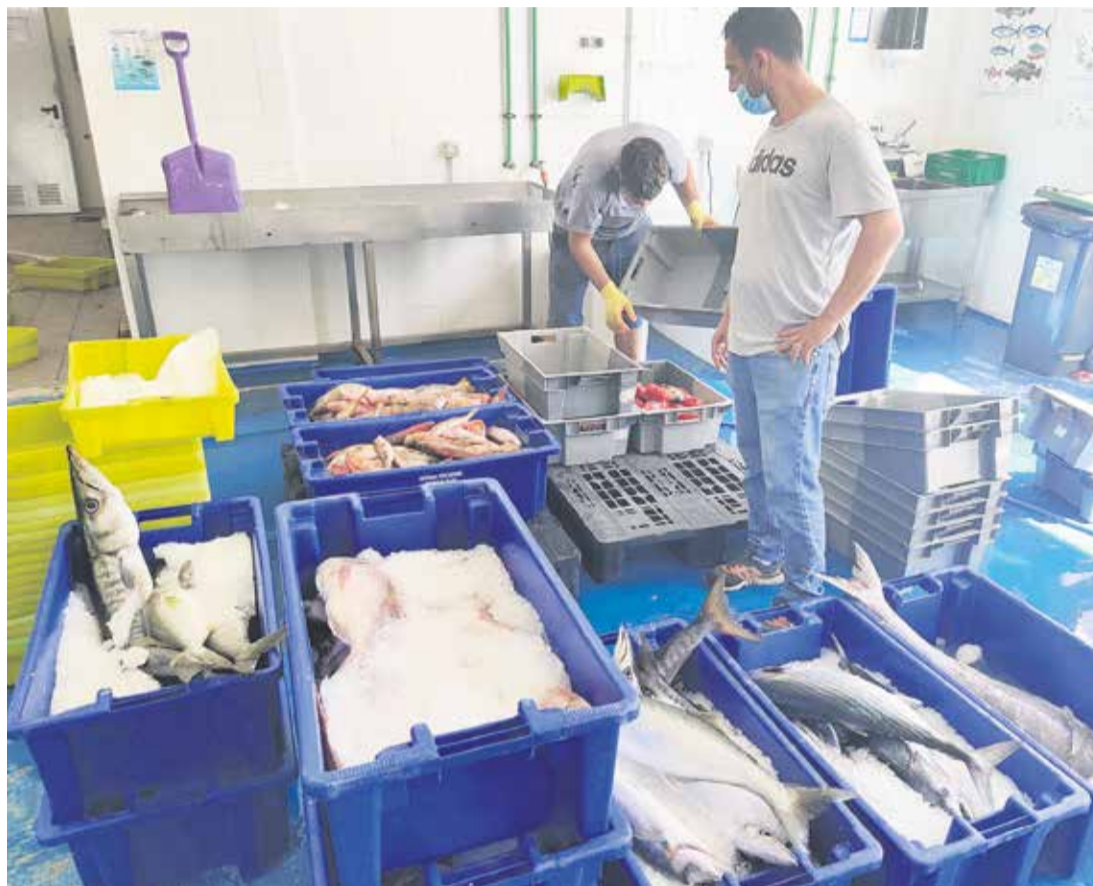
El sector mayorero practica una pesca sostenible de ejemplares adultos.

El sector pesquero profesional en Fuerteventura se enfrenta al descenso de la demanda como consecuencia de la caída del turismo y a la incertidumbre que genera el devenir de la pandemia, al tiempo que reclama una regulación acorde a las especiales características del territorio insular.