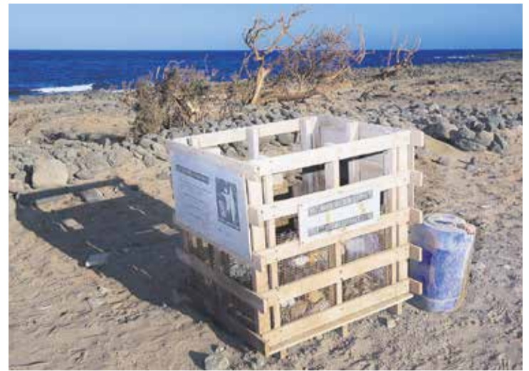
Un estudio de las playas mayoreras advierte de la "alarmante" presencia de microplásticos en la costa oeste y macroplásticos en la zona este.

persistentes que pueden existir en las muestras recogidas.