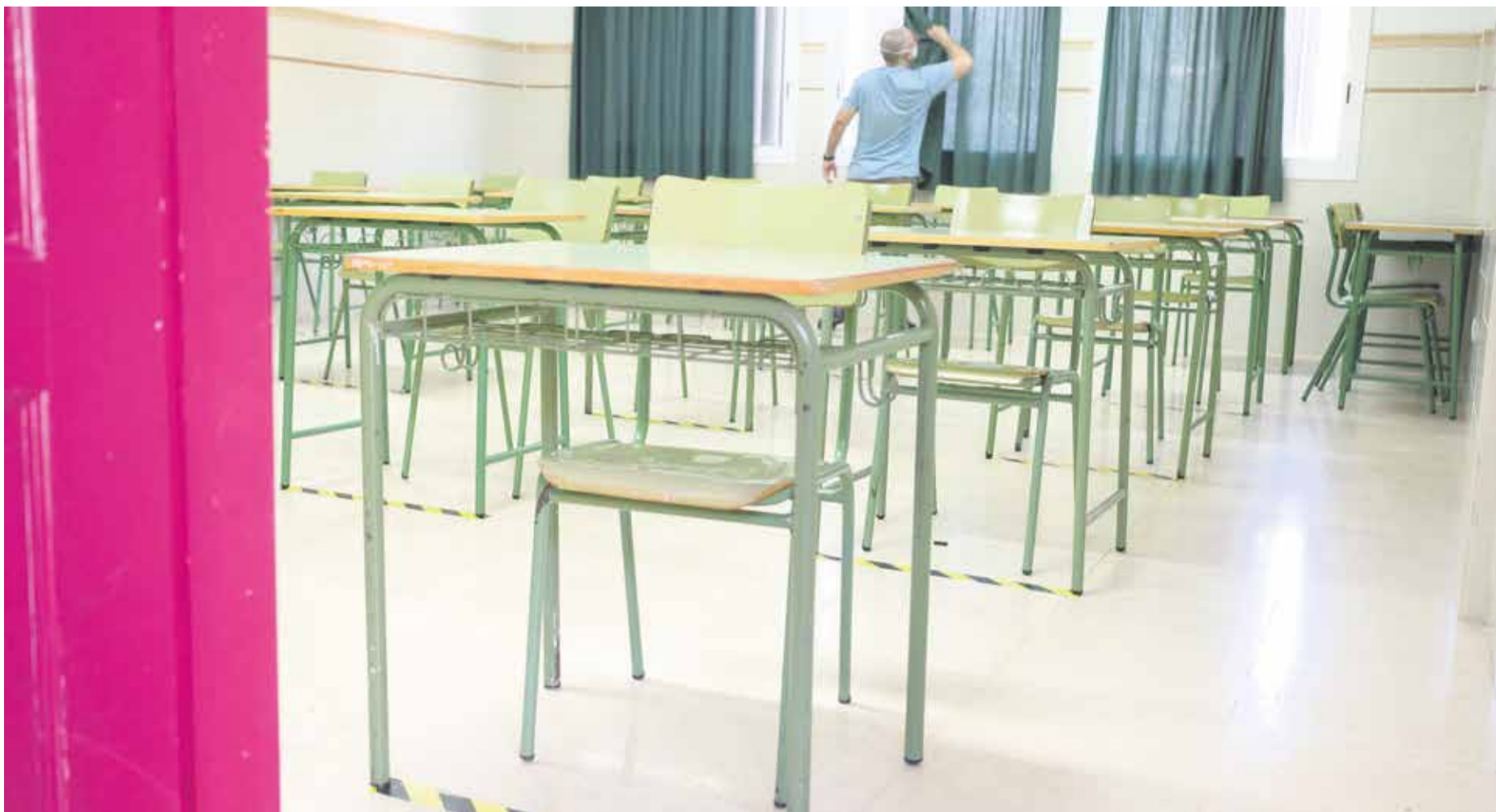
Aula del IES San Diego de Alcalá de Puerto del Rosario, con las medidas de seguridad establecidas.