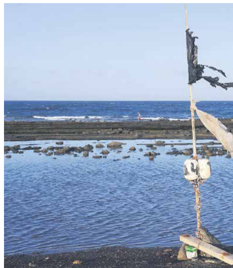
El proyecto prevé una metodología específica con un protocolo de recogida, clasificación y pesado de los restos recogidos en las playas.