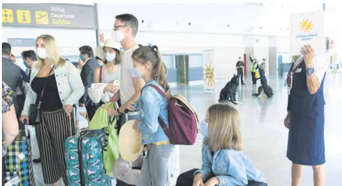
Los empresarios están dispuestos a colaborar en el coste de las pruebas en destino.

“No tenemos datos fiables de cara al invierno porque todo dependerá de cómo se desarrolle la curva epidemiológica en las próximas semanas”