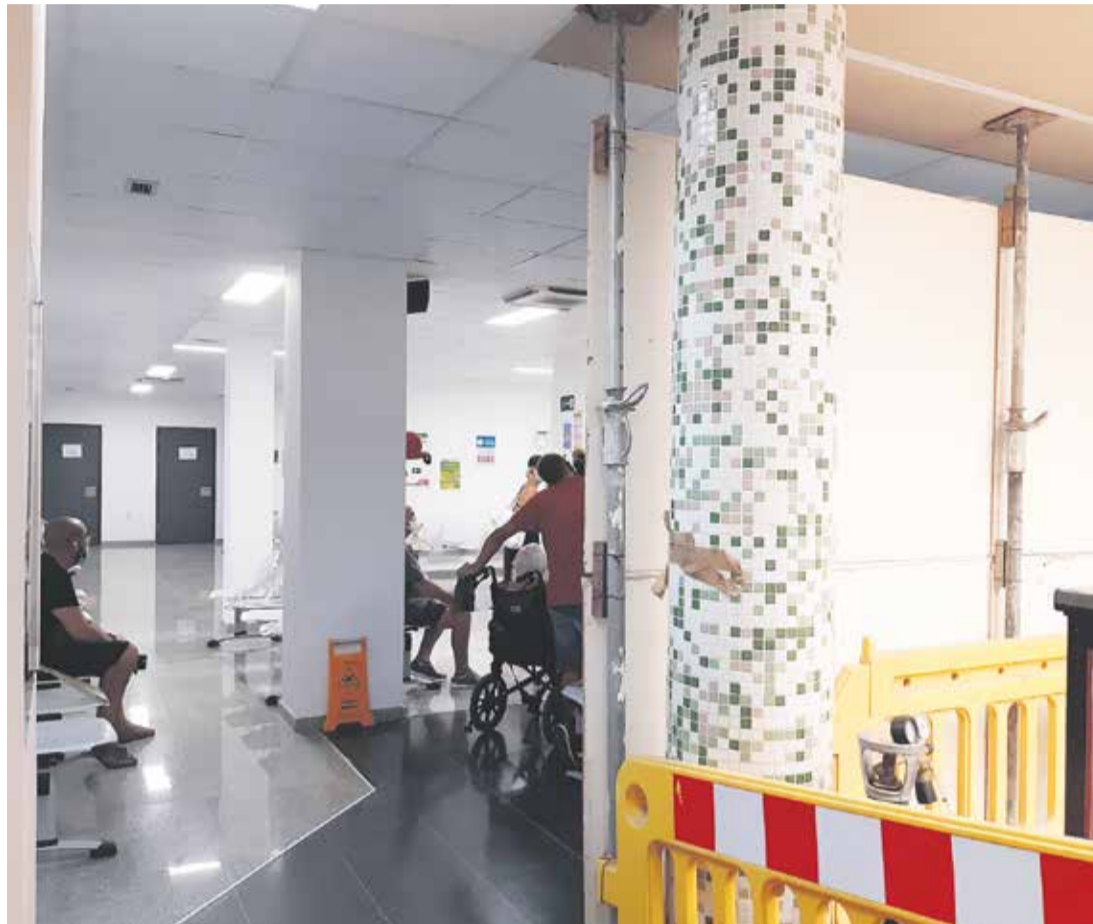
Una vez iniciadas las obras, hubo modificaciones del proyecto y del presupuesto.

El personal relata los dolores de cabeza ocasionados por los ruidos, derribos de paredes, los humos y polvo propios de las obras que han desesperado a toda la plantilla, especialmente a los servicios de limpieza, e incluso un escape de gas que provocó el desalojo de las instalaciones en julio del año pasado. Aunque también es cierto que, durante estos dos años, la mayoría del tiempo las obras han