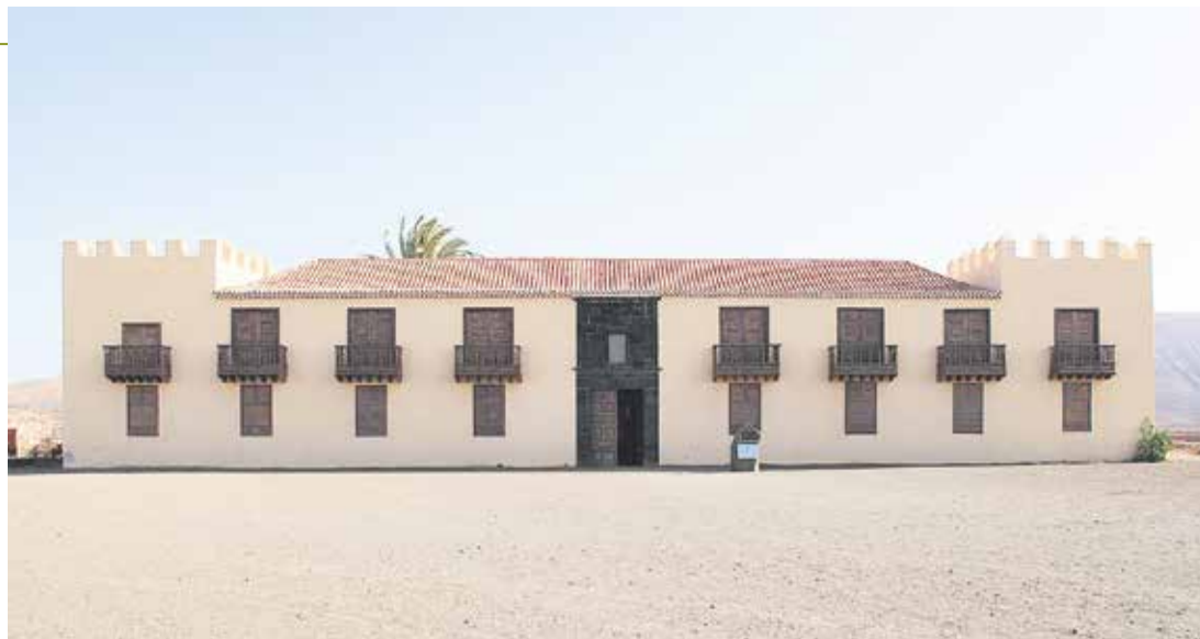
Casa de los Coroneles.

De esa cueva se cuenta que, una vez finalizado el coronelato de La Oliva, tras pasar el mando a manos del nuevo coronel de Puerto del Rosario, hubo una lucha entre el coronel saliente y el entrante: “uno porque no quería entregar el poder y el otro porque le exigía el traspaso. Ante la angustia de tener que entregar todo lo que había creado, se dice que, en ese subterráneo, el coronel de La Oliva ordenó enterrar su valioso arsenal y durante dos meses estuvieron guardando sus tesoros para luego taponar la entrada al subterráneo”, relata el historiador. Carreño confía plenamente en la existencia de esta cueva, de la que explica dio pie, en su origen, a un asentamiento aborigen. No en vano, existe un catálogo de cuevas de similares características en la zona norte de la Isla, como la de Villaverde o la del Llano. Explica que, alrededor de esa cueva, antes de la construcción de la Casa de los Coroneles, se fundó La Oliva, dado que en su entorno se encuentran las casas más antiguas del municipio, que más tarde pasarían a