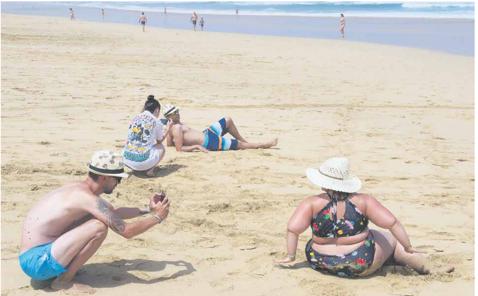
Las playas mayoreras han estado más vacías este verano.