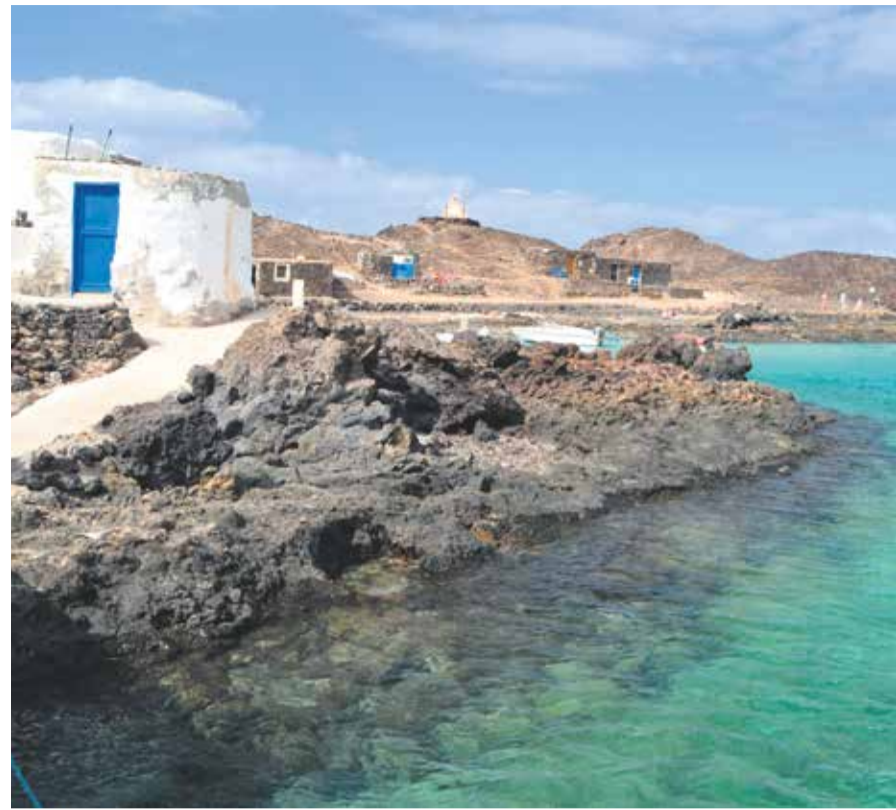
El Islote de Lobos es Parque Natural desde 1982.

Por ello, desde la actual Consejería regional de Transición Ecológica se considera “necesario realizar una adecuada evaluación” de las “repercusiones”, te-