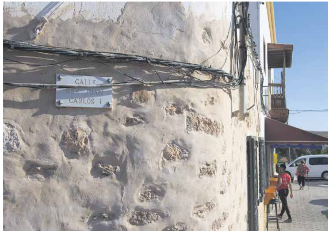
Calle Rey Juan Carlos I, en Tuineje.

La Isla cuenta con cuatro de las nueve calles dedicadas a Juan Carlos I en la provincia de Las Palmas, repartidas por los municipios de Tuineje, Antigua y La Oliva. Sus alcaldes aseguran que, en momentos de pandemia, no es oportuno plantear el cambio, tal y como están realizando otros municipios españoles.