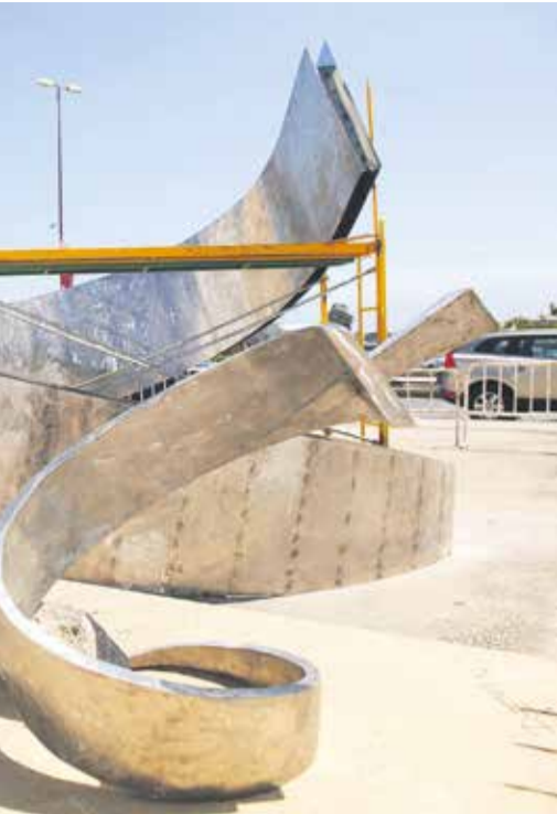
Esculturas de la edición del año pasado.

cultural paralela, con conferencias, un taller formativo y una exposición de fotografías. El jueves, 17 de septiembre, a las 19.00 horas, la periodista y escritora Mayte Martín disertará sobre Mujer y Cultura , con la intención de visibilizar y potenciar el papel femenino en las artes. Al día siguiente, a la misma hora en este espacio de arte se celebrará la conferencia Escultura y Escultora , a cargo de