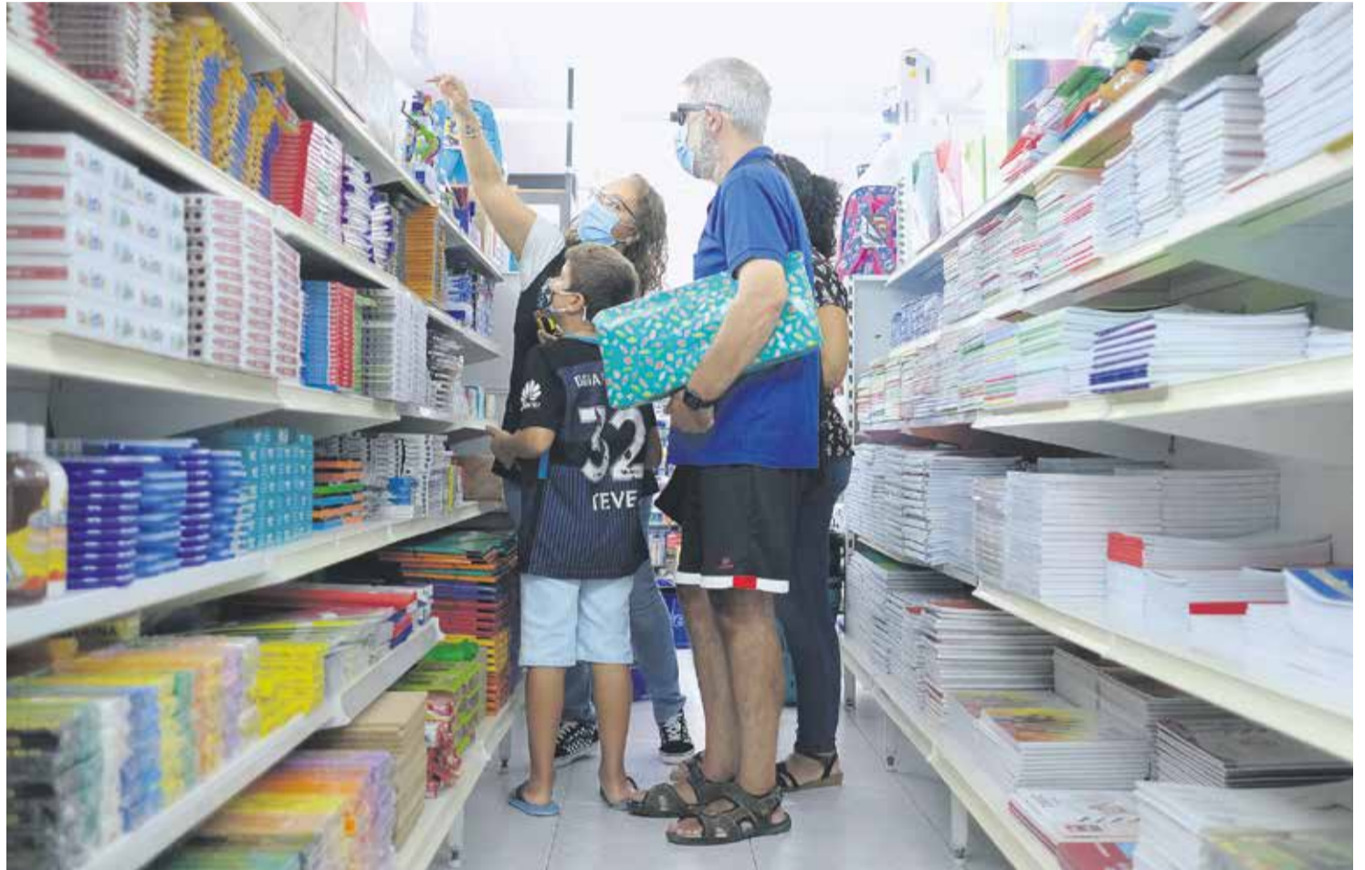
Una familia compra material escolar en una librería de Puerto del Rosario.

Las familias de Fuerteventura a las que la pandemia ha dejado sin empleo afrontan el inicio de curso sin saber cómo hacer frente a la compra del material escolar y el resto de los gastos que acarrea el regreso a las aulas