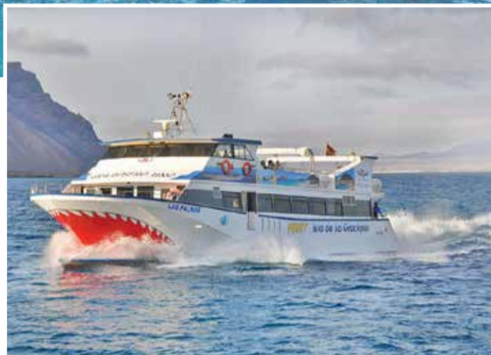
La ruta entre Corralejo y Playa Blanca cuenta con varias salidas diarias en horario de mañana y tarde.