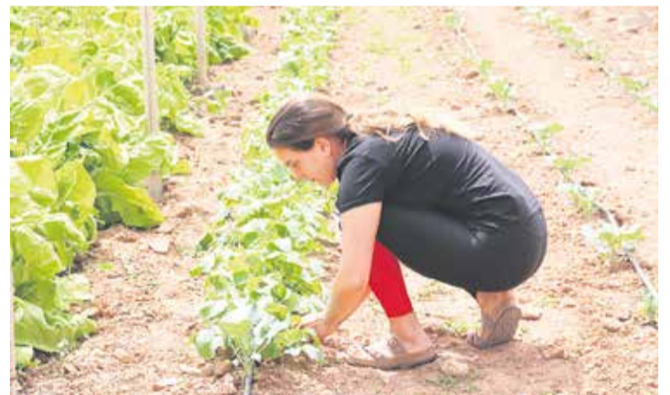
En Agroviva también hay espacio para las lechugas.