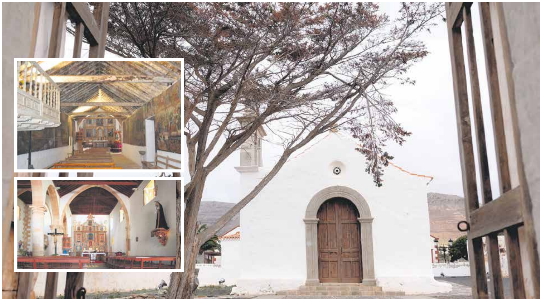
En la imagen principal y en la primera superior, ermita de La Ampuyenta. Debajo, la iglesia de Tuineje.