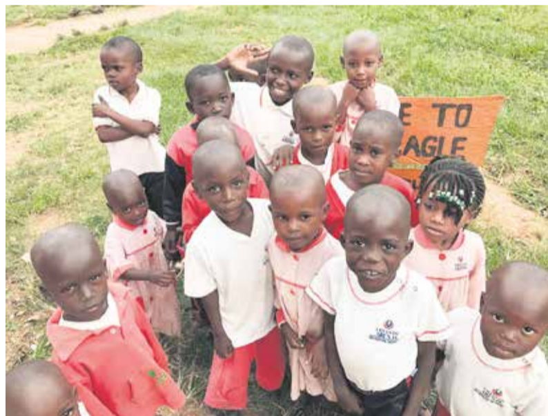
Colegio de la organización, en la isla ugandesa de Zinga.

no infecciosos e incluso quemados. “Hay muchos accidentes caseros con el fuego, ya que siempre hay brasas encendidas para cocinar y los niños suelen quemarse”, explican. Mantener en la misma estancia a infecciosos con estos heridos, completamente expuestos a las infecciones, es, “prácticamente, condenarlos a muerte”.