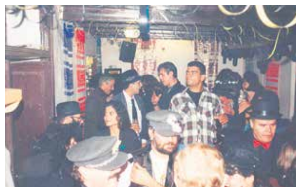
Varios habituales en un animado carnaval.