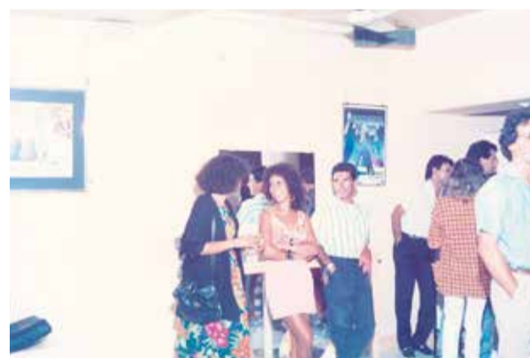
Pub Mafasca, concebido como un espacio para distintas disciplinas artísticas, como muestran las obras colgadas de sus paredes.