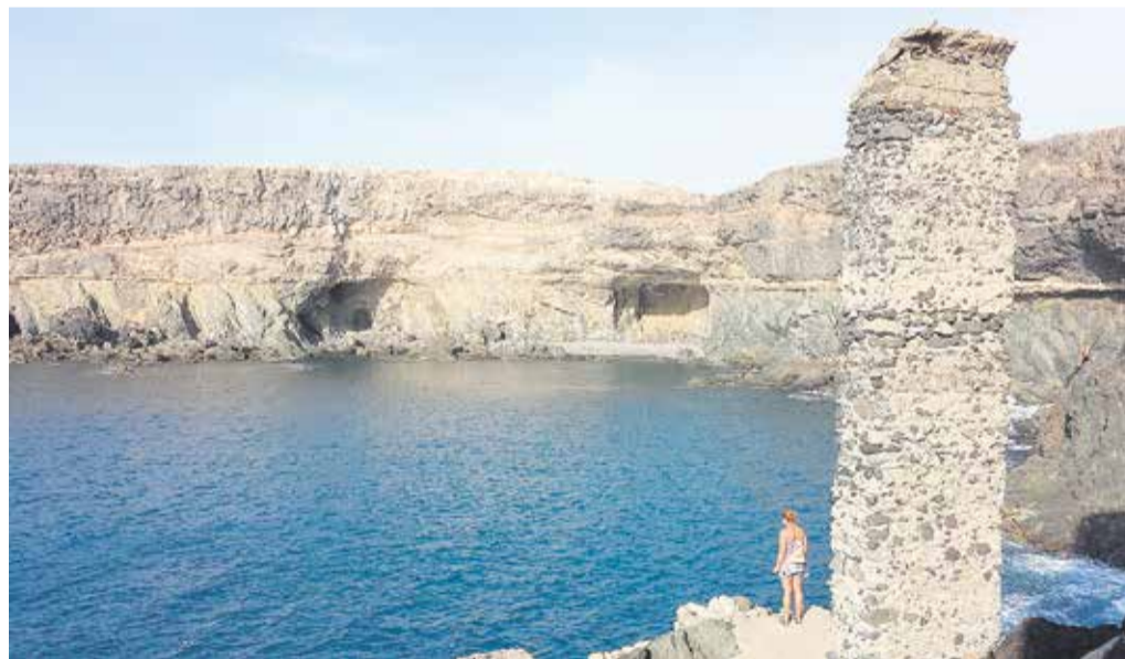
Cuevas de Ajuj.