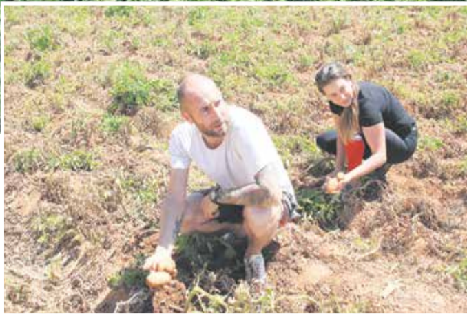
Campos de papas.