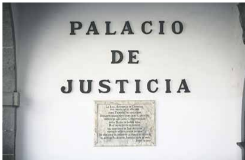
Sede del TSJC en Las Palmas de Gran Canaria.