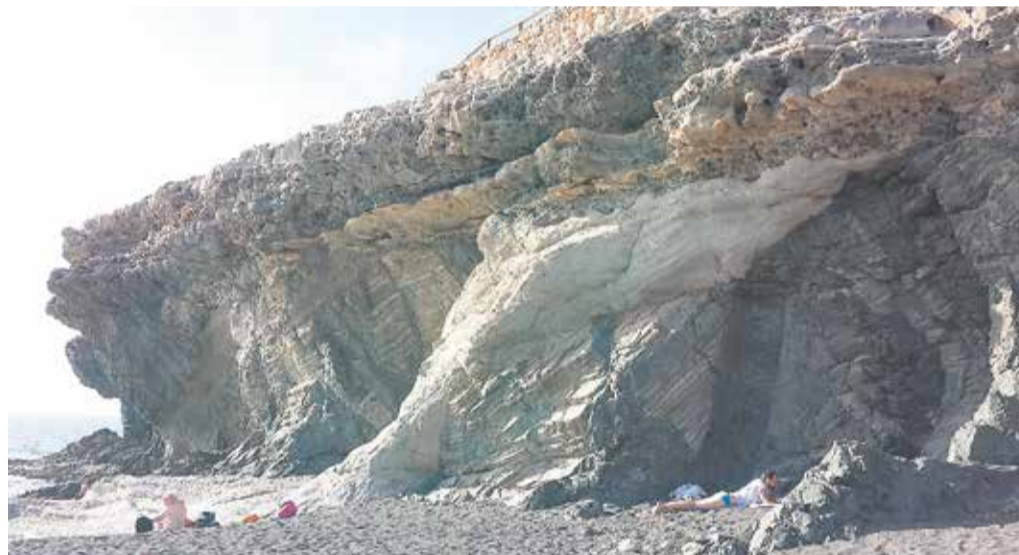
Sedimentos en Ajuj.