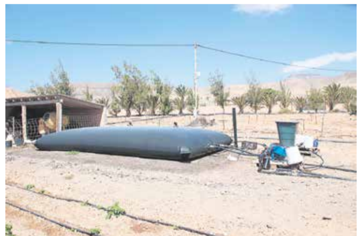
Depósito de agua.

“Fuerteventura tiene un espacio increíble para cultivar, pero ahora nos encontramos con terrenos agrícolas abandonados e invernaderos vacíos. Sería importante que la gente volviera a cultivar de nuevo”