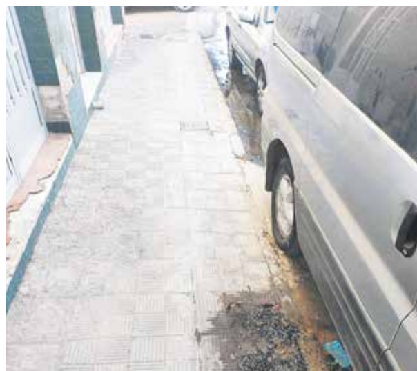
A la izquierda, edificio del Consorcio de Aguas. A la derecha, destrozos en la vía pública como consecuencia de una reparación.