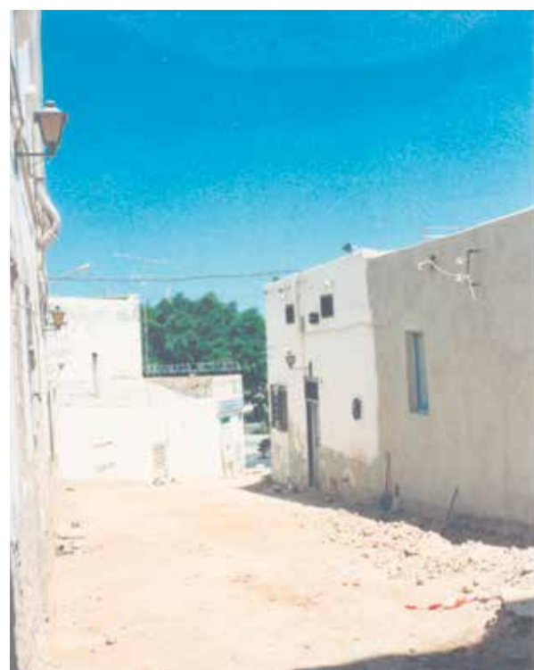
Aspecto de la calle Eustaquio Gopar en los años 80.