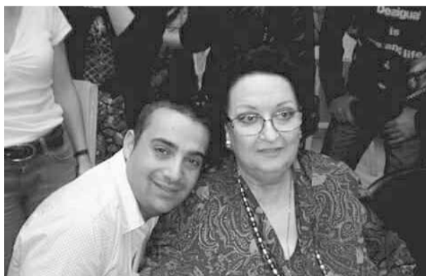
Junto a Montserrat Caballé.