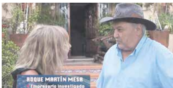
'Roquito' en un programa de televisión de Cuatro.

Esta sentencia es uno de esos casos. En el fallo, señala la Audiencia que el contrato de compraventa es "sumamente sospechoso por el precio de adquisición de la finca" que sólo ascendió a 2.499 euros. La escritura que esgrimía el comprador deriva de una ampliación de capital de la sociedad Gaviás Nuevas Sol del año 1995. El comprador alegó en su favor que llegó a hacer movimientos de tierras con fines agrícolas y a construir un cuarto de aperos autorizado por el Ayuntamiento de La Oliva. También argumentó que los socios de la Comunidad Aljibe Los Curbelos, "doce matrimonios", sólo tenían derechos sobre el aljibe