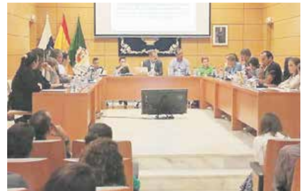
Algunos representantes del Consejo insular se desplazaron a la Casa Palacio para intervenir en el Pleno de noviembre de 2017.