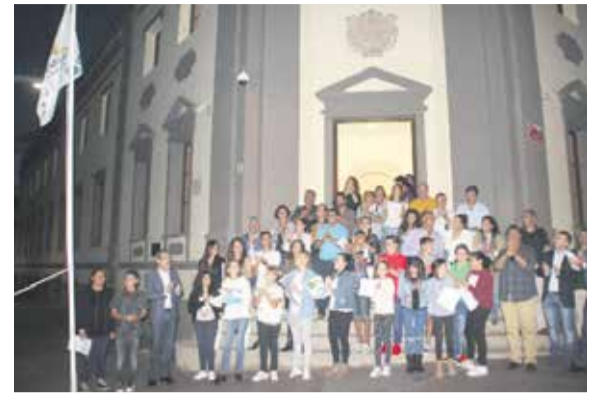
La lectura del Manifiesto por la Infancia y el izado de la bandera marcaron la actividad del Día Internacional que se celebra cada 20 de noviembre.

El día 20 de noviembre, Día Internacional de la Infancia, el protagonismo en el Pleno insular fue para el Consejo Insular de la Infancia. Ante la mirada atenta de los consejeros adultos, uno de sus miembros leyó un manifiesto en el que recordó que pese a que la Convención sobre los Derechos del niño y de la niña es el tratado internacional más ratificado de la historia, los niños y niñas son el colectivo más vulnerable y, por tanto, el que más sufre las crisis y los problemas del mundo. “Desde el CIIA pedimos que se respeten nuestros derechos, que se nos escuche y que nuestras opiniones sean tenidas en cuenta. No tenemos derecho a voto, pero sí tenemos derecho a participar, a que se nos consulte y a que nuestras ideas y propuestas sean tomadas en serio como ciudadanos y ciudadanas que somos. Es necesario crear más espacios para la participación infantil y adolescente, recursos que permitan a los niños y las niñas crecer y desarrollarse como personas en igualdad de condiciones, e insistir en que no nos traten como ciudadanos y ciudadanas de segunda. La sociedad y la política deben velar por que se cumplan nuestros derechos. Soñamos una Fuerteventura del