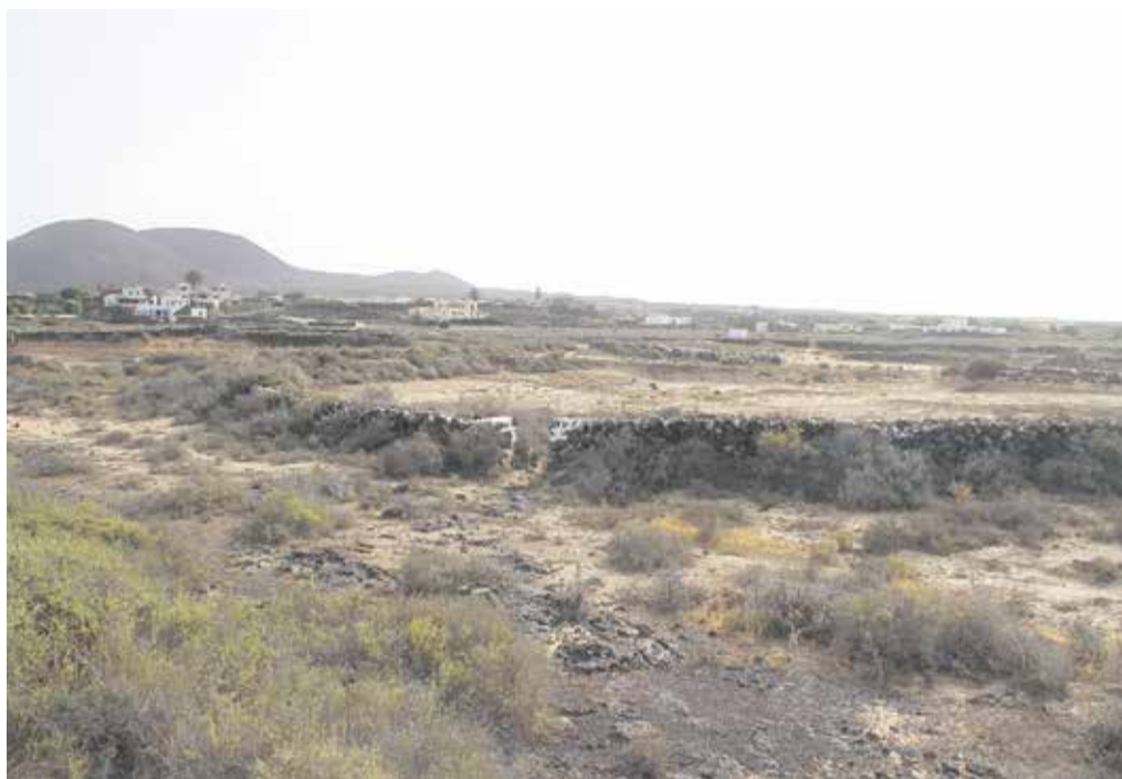
Finca matriz en Lajares, objeto de la disputa.