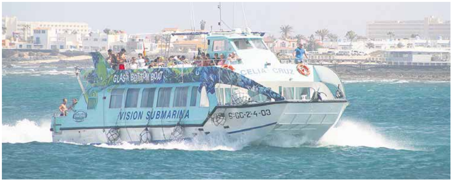
El barco 'Celia Cruz', que cubre la conexión con Lobos de forma regular, con horarios establecidos y descuentos para residentes.

Sin embargo, el incremento en las cifras turísticas de la Isla ha llevado a que en la actualidad se multipliquen los visitantes, que la actividad de los 'water taxis' se haya disparado y que sea haya convertido en un chollo, sobre todo por la falta de cumplimiento de la normativa. Este tipo de embarca-