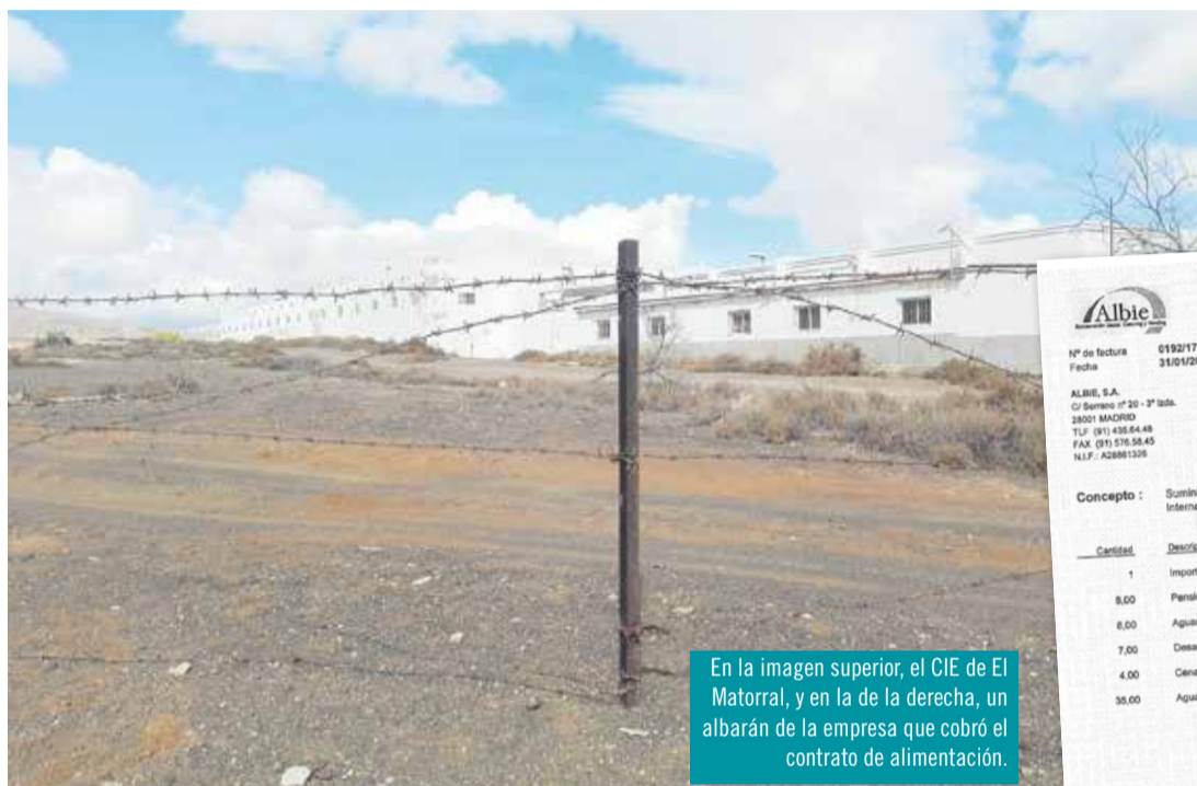
En la imagen superior, el CIE de El Matorral, y en la de la derecha, un albarán de la empresa que cobró el contrato de alimentación.

Sin embargo, cuando el Ministerio licitó el contrato de abastecimiento de todos los centros en el conjunto del Estado, en el año 2013, por un máximo de 11,5 millones de euros, estableció una condición muy beneficiosa para la empresa que resultara adjudicataria: 150.000 euros anuales fijos por alimentación en el CIE de Fuerteventura, aunque estuviera vacío. La cantidad garan-