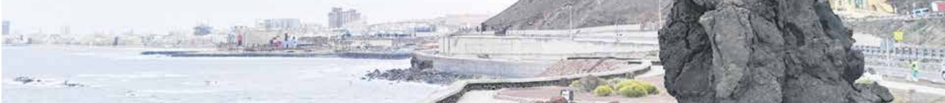
'El Atlante' de Tony Gallardo en la salida norte de la capital grancanaria, el 2 de agosto.

Fuerteventura ejerció un notable influjo sobre el escultor Tony Gallardo (Las Palmas de Gran Canaria, 1929-1996), uno de los grandes artistas canarios de la segunda mitad del siglo XX