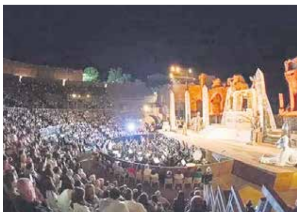
En el escenario de Taormina, en agosto de 2017, interpretando a Radames.

a lo que se sumará la taquilla, que se reinvierte en los espectáculos.